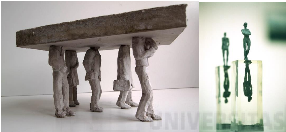
Fig. 2. A) Many one men (2014), hormigón armado 36 x 34 x 12 cm

Este escultor influye en nuestra percepción temática de la identidad por su preocupación por la relación del hombre tanto consigo mismo como con los que le rodean, esos que él mismo llamará “espectadores”, se convierte en hilo conductor de su discurso artístico. Parece concebir a unos y otros como energías que interactúan entre sí de forma positiva y/o negativa pero siempre influenciándose, condicionándose entre sí.