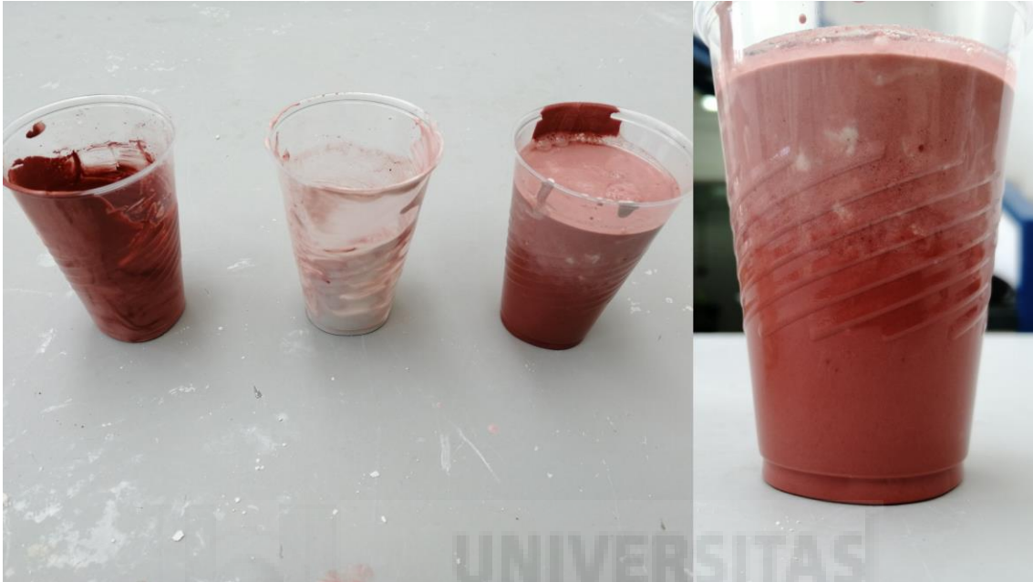
Fig. 7. Pruebas y maquetas.

En primer lugar, se realizaron una serie de bocetos y maquetas que concretasen la idea y barajamos las posibilidades técnicas y materiales de las columnas.