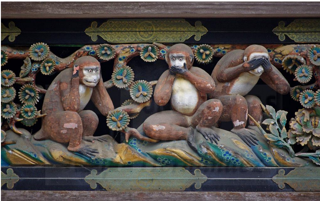
Fig. 1. Mizaru, Kikazaru, e Iwazaru. Los tres monos sabios (s. XVII), Madera policromada.

El principal referente temático y, del que es representación el código moral chino del santai , es el germen de la filosofía japonesa que, con el paso de los años, se convirtió en un proverbio japonés que sostenía la creencia de que toda persona posee tres caras; la que mostramos al mundo, la que mostramos en confianza y la que no mostramos a nadie.