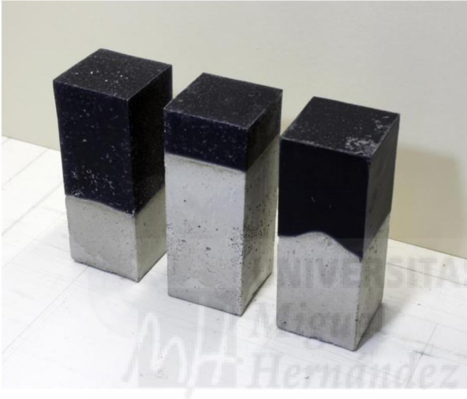
Fig. 6. Beton-Wachs (2016), hormigón y cera de abeja, 17 x 7 x 7 cm.

Este autor es interesante en nuestra obra artística por la técnica de la encapsulación, el encofrado y el uso de materiales industriales, como el hormigón, y naturales, como la cera de abeja entintada.