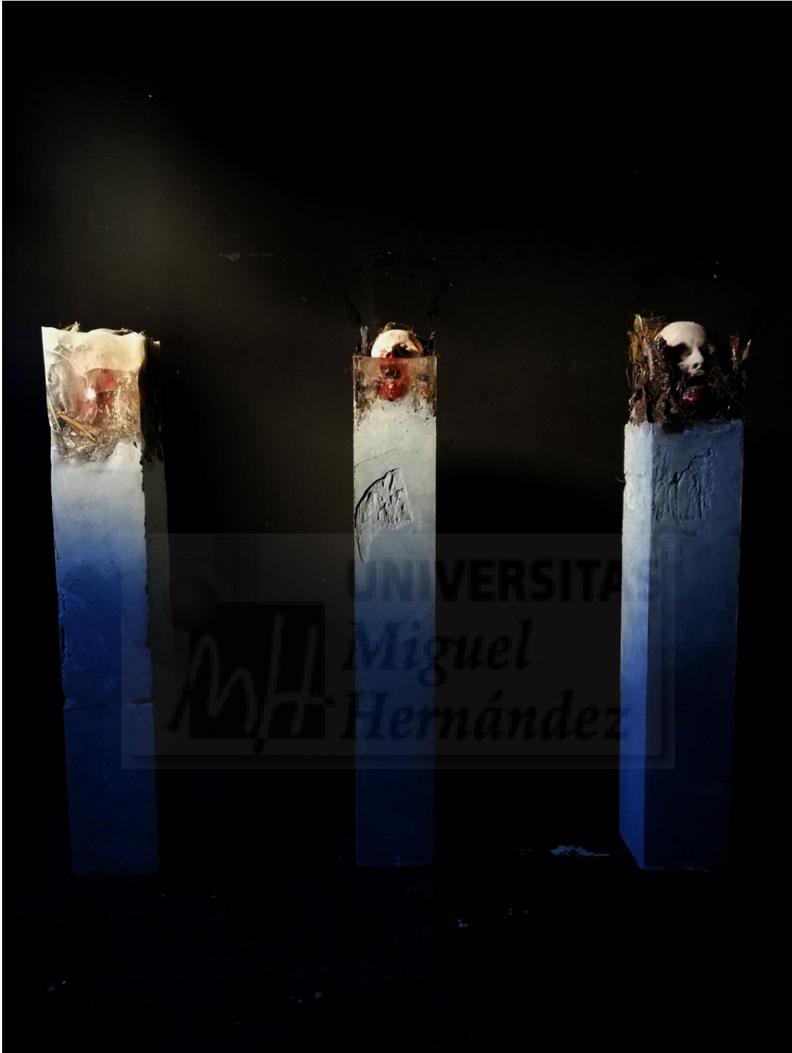
Fig. 13. Las tres caras del ser (2019), resina de poliéster, escayola, hormigón y corteza de árbol, 120 x 20 x 20 cm.