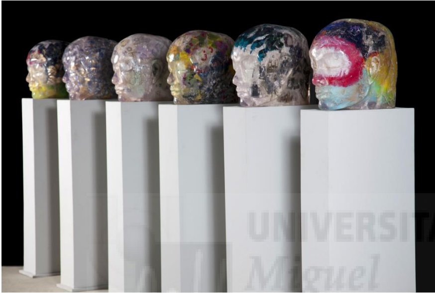
Fig. 5. La mirada interior (2012), resina de poliéster con inclusiones de objetos y pintura acrílica, 45 x 28 x 48 cm.

Eugenio Cuttica es un escultor interesante en cuanto a referencia técnico-material, ya que utiliza la resina de poliéster como material encapsulante de objetos, por lo que las operaciones pertinentes en la realización de sus obras, así como algunos de los materiales utilizados, se asemejan en gran medida a nuestras piezas.