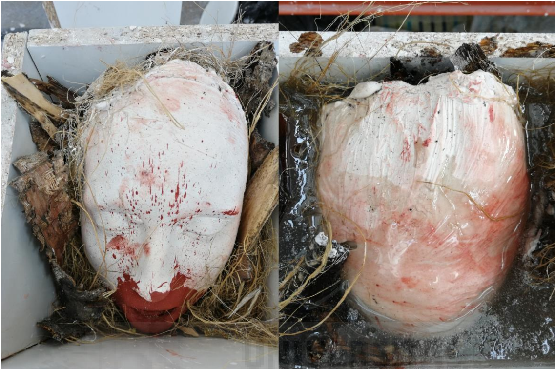
Fig. 11. Moldes y reproducciones.

Por último, se introdujeron las cortezas de árbol, la estopa y los bustos en los encofrados y se llenaron con resina de poliéster transparente.