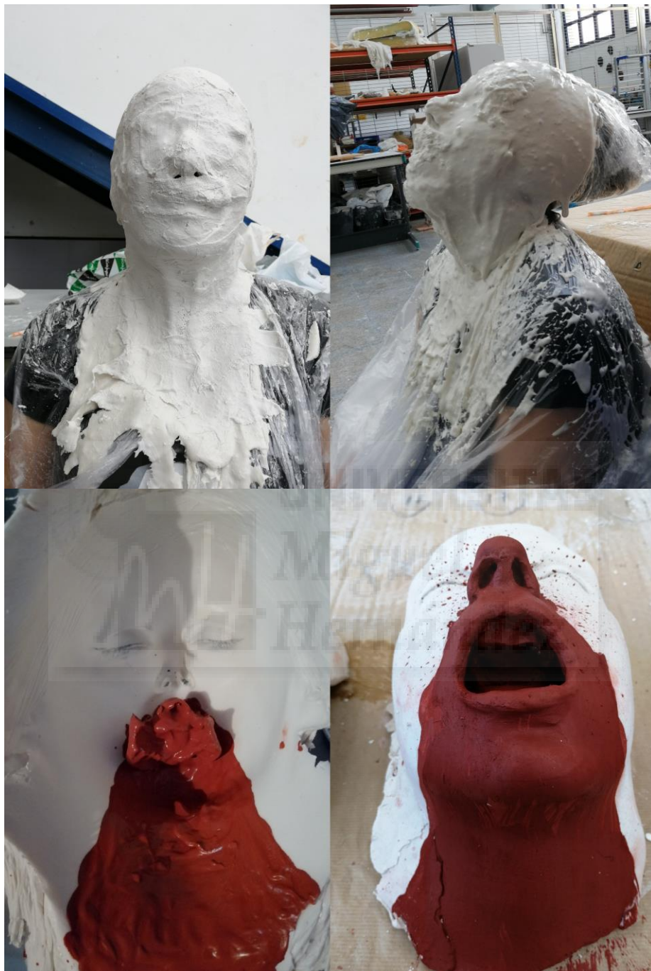
Fig. 10. Moldes y reproducciones.

La siguiente fase fue la del proceso de moldeado y reproducción. Los moldes fueron realizados por contacto directo con alginato y venda de escayola. Una vez fraguados, se procedió a su llenado con escayola blanca pigmentada en algunas zonas a destacar.