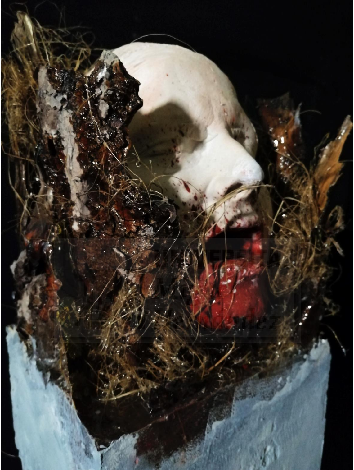
Fig. 17. Iwazaru (2019), resina de poliéster, escayola, hormigón y corteza de árbol, 120 x 20 x 20 cm.