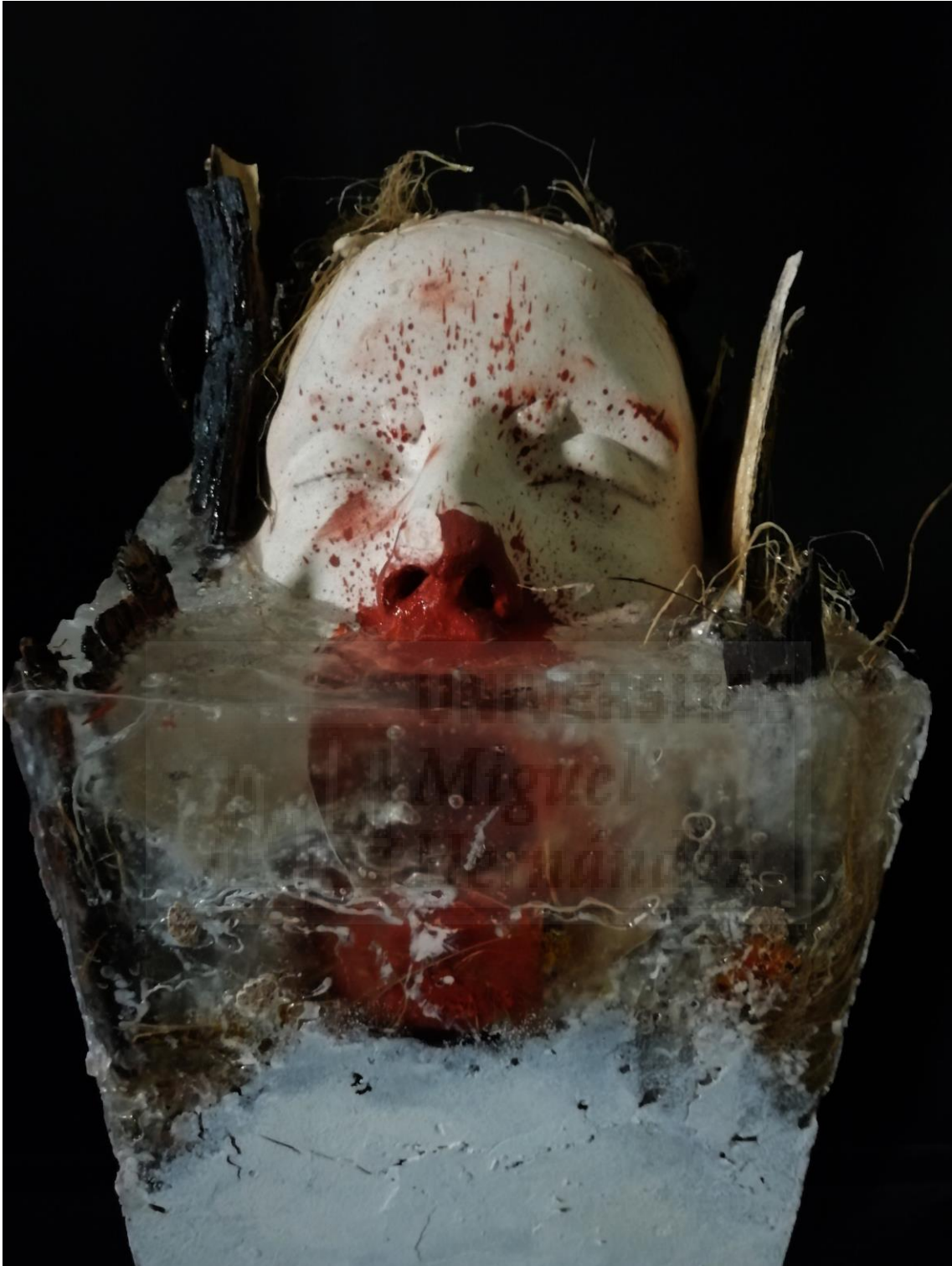
Fig. 16. Kikazaru (2019), resina de poliéster, escayola, hormigón y corteza de árbol, 120 x 20 x 20 cm.