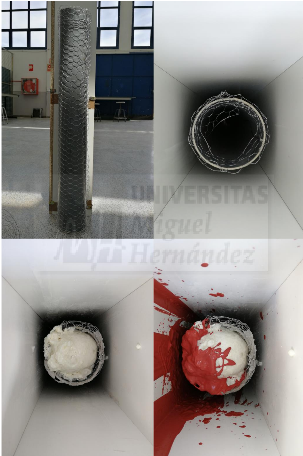
Fig. 9. Estructura interna.

Luego, introducimos un tubo de pvc de 12 cm de diámetro y lo envolvimos en malla metálica para que el hormigón agarrase mejor. Este procedimiento se realizó con la finalidad de hacer las piezas más livianas. Después, se rellenó con espuma de poliuretano y cuando esta terminó el proceso de expansión y secado, llenamos el encofrado con el hormigón y la escayola.