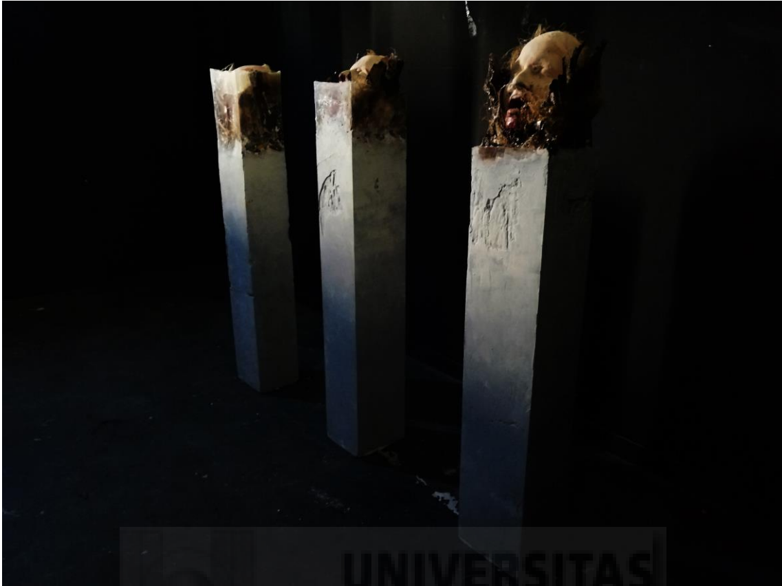
Fig. 14. Las tres caras del ser (2019), resina de poliéster, escayola, hormigón y corteza de árbol, 120 x 20 x 20 cm.