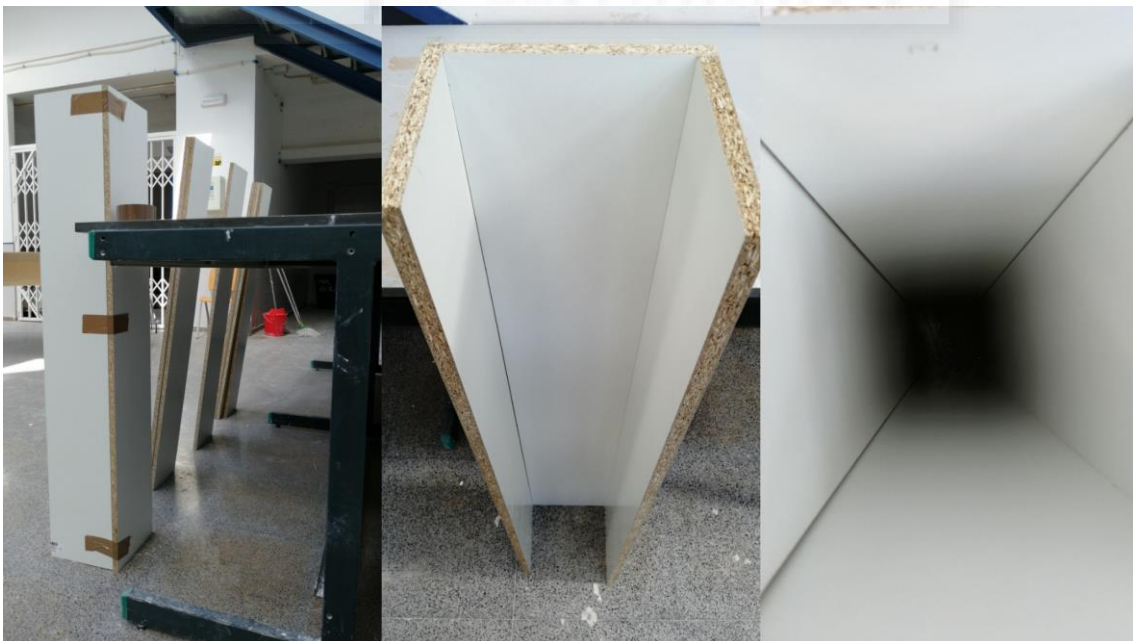
Fig. 8. Encofrado.

A continuación construimos los encofrados con tableros de madera conglomerada revestida de melamina con el fin de crear una capa desmoldeante.