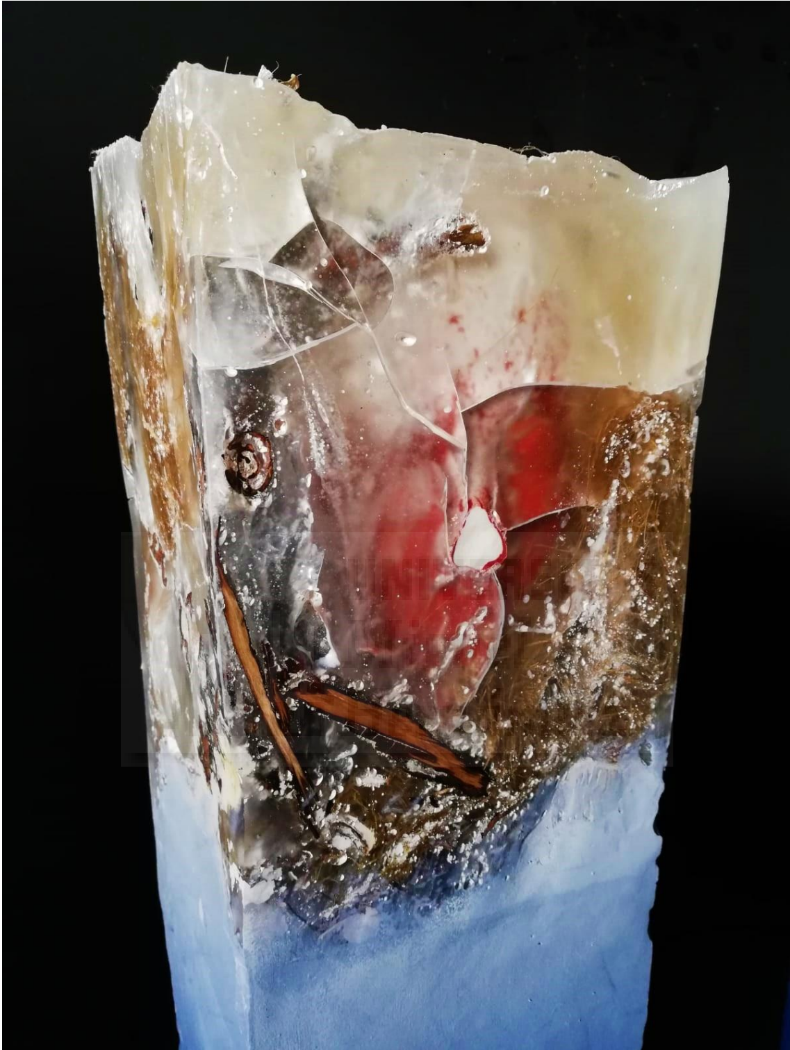
Fig. 15. Mizaru (2019), resina de poliéster, escayola, hormigón y corteza de árbol, 120 x 20 x 20 cm.