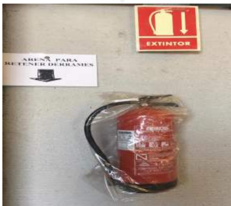
Fotografía 5: Extintor contra incendios