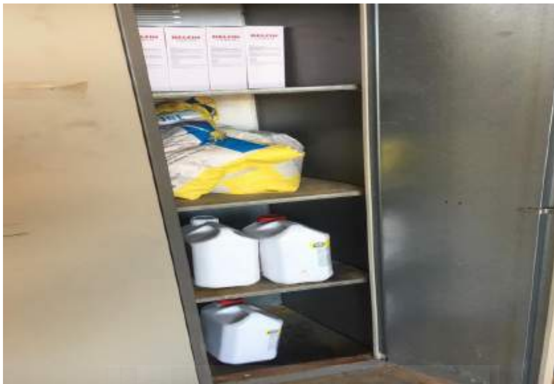
Fotografía 11: Productos fitosanitarios ecológicos I