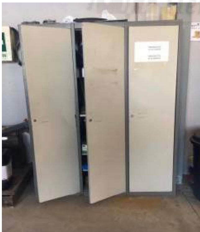
Fotografía 3: Armario de productos fitosanitarios y equipo de protección individual (Epi)