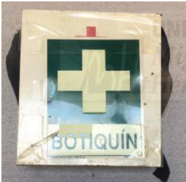
Fotografía 6: Botiquín primeros auxilios

En el siguiente nivel, a cuatro escalones de altura, se accede a la abertura para cargar los tanques de abono, cada uno de ellos etiquetado y señalizado correctamente, que están a un escalón del suelo, con su rejilla correspondiente en caso de derrame o fuga. Estos tanques de productos (azufre, magnesio...) van conectados al cabezal de riego, donde se mezclan con el agua de riego y así se distribuyen a los invernaderos para abastecer el cultivo. Al subir los escalones se encuentra el último extintor.