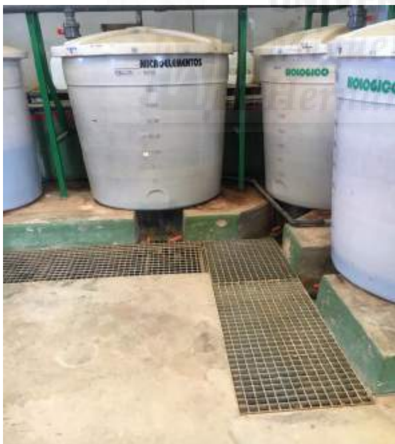
Fotografía 8: Tanques de productos de abono y rejillas antiderrame