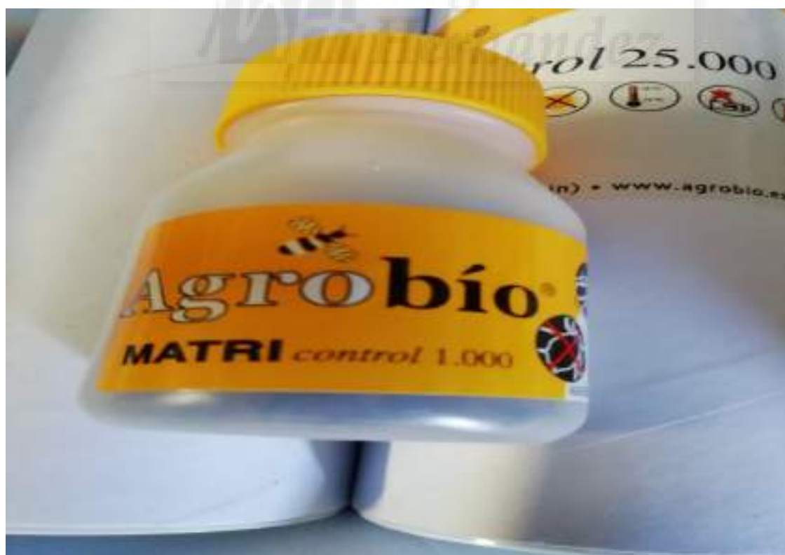
Fotografía 14: Aphidius matricariae