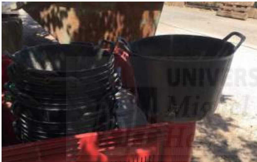
Fotografía 10: Capazos de plástico

Conforme se van llenando las cajas, un trabajador formado o el mismo agricultor, con la carretilla elevadora las traslada al camión, colocándolas adecuadamente y con sujeciones para trasladar la cosecha, una vez lleno el camión a la cooperativa. En la cooperativa agrícola se pesan los pimientos y se etiquetan y a continuación se lleva a cabo el proceso de lavado, clasificación y envasado, para ser distribuido a diferentes empresas o tiendas internacionales, principalmente Alemania y Suiza.