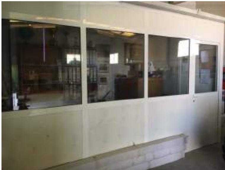
Fotografía 1: Oficina

-Almacén de hormigón. Con una extensión de 200m 2 . En esta nave se encuentran dos zonas de distinto nivel. En la zona baja hay dos puertas elevadoras para que los vehículos y máquinas (camión, tractor y carretilla elevadora) se puedan aparcar en el almacén, en su lugar señalizado de carga y descarga. Justo al lado de estos aparcamientos hay una pequeña oficina/despacho de 8 m 2 , cerrada y fabricada con material PVC. En ella, hay una mesa, un ordenador, un sillón y un mueble con archivos, donde se encuentran los manuales de instrucciones de todas las máquinas, los recibos del banco y todo el administrativo. Cerca de esta zona se encuentra un grupo electrógeno, que se utilizaría de manera automática en caso de emergencia, ante un fallo eléctrico.