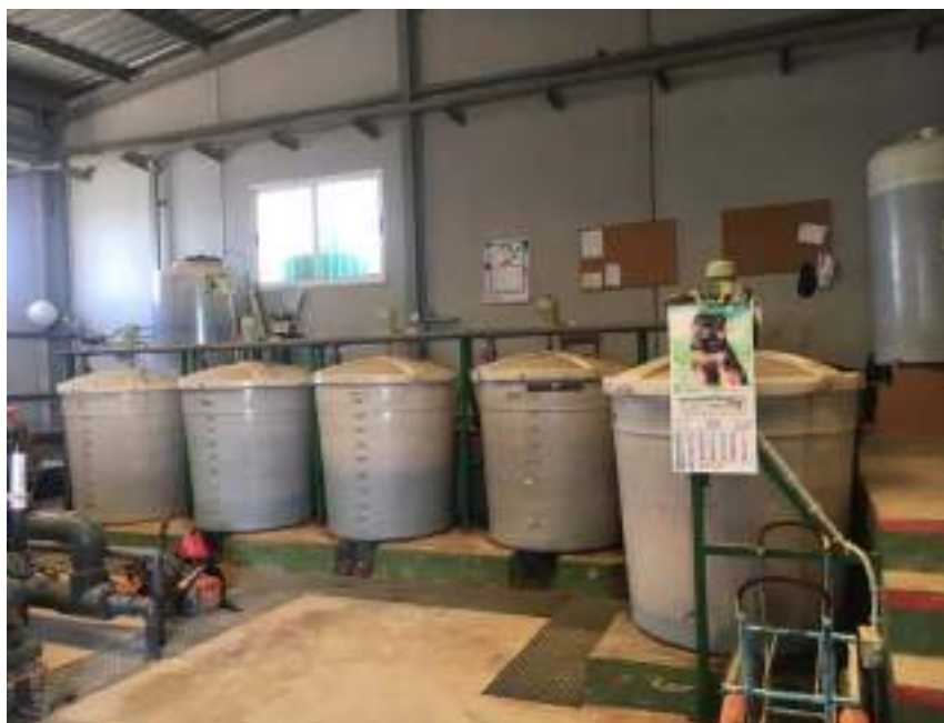
Fotografía 7: Tanques de productos de abono y su acceso