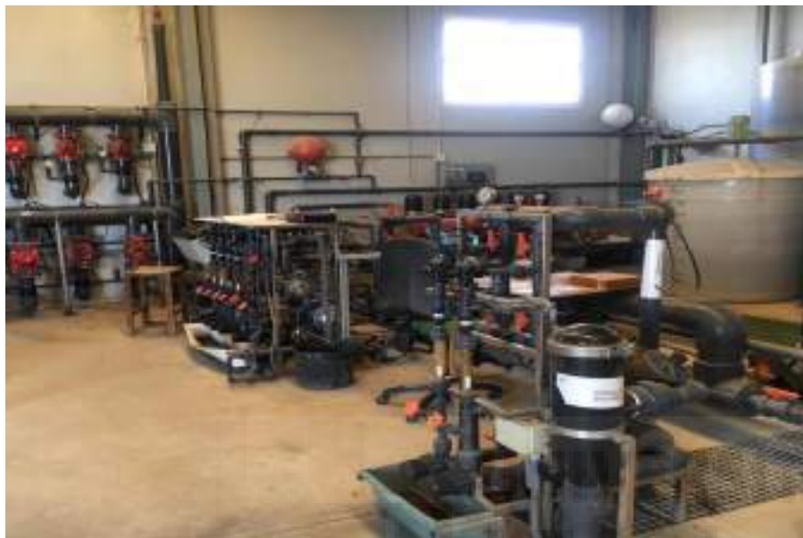
Fotografía 2: Cabezal de riego y tanques de productos de abono

lavabo y dos armarios, uno de ellos con los productos fitosanitarios ecológicos, envasados y etiquetados correctamente y el otro con el material de protección individual (monos, mascarillas, gafas de protección, protectores auditivos, sombreros y guantes de goma). Este tipo de material lo solía utilizar por completo cuando fumigaba con plaguicidas e insecticidas, pero desde hace 15 años ya tiene solo agricultura ecológica y biodinámica, aunque aún siguen utilizándolo cuando es necesario.