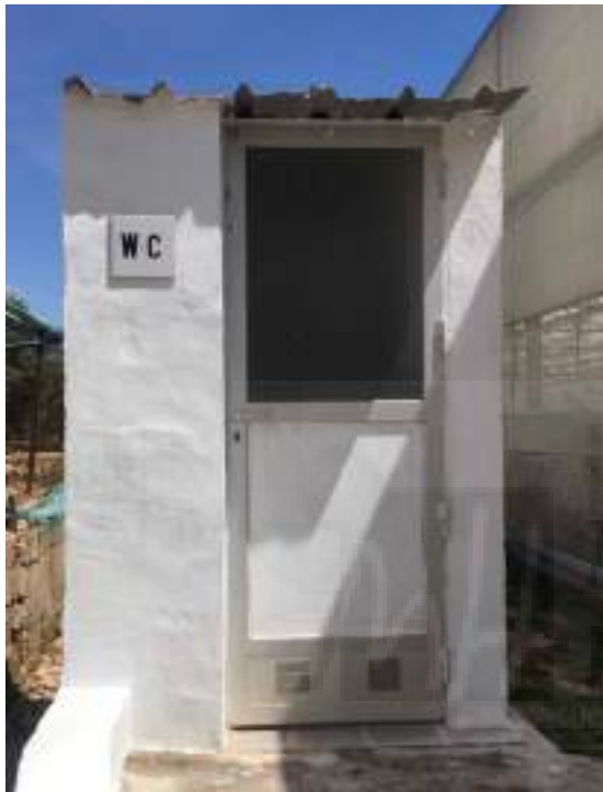
Fotografía 9: Aseo para personal

-En el exterior de la nave. Dentro del recinto, justo en la parte de atrás del almacén se encuentran los aperos del tractor, además de la balsa de riego, con 800m 2 y de 7m. de profundidad, está construida de hormigón e inaccesible, ya que está vallada en todo su perímetro y con la señalización pertinente de prohibido el baño, además de un aseo para uso de los trabajadores. En esta finca se encuentran 7 de los 14 invernaderos pertenecientes al agricultor. Estos invernaderos se distinguen con números, los cuales son: el nº2 con 2500m 2 , el nº3 con 12500m 2 , el nº4 con 3500m 2 , el nº11 con 3500m 2 , el nº12 con 6000m 2 , el nº13 con 9000m 2 y el nº14 con 9000m 2 .