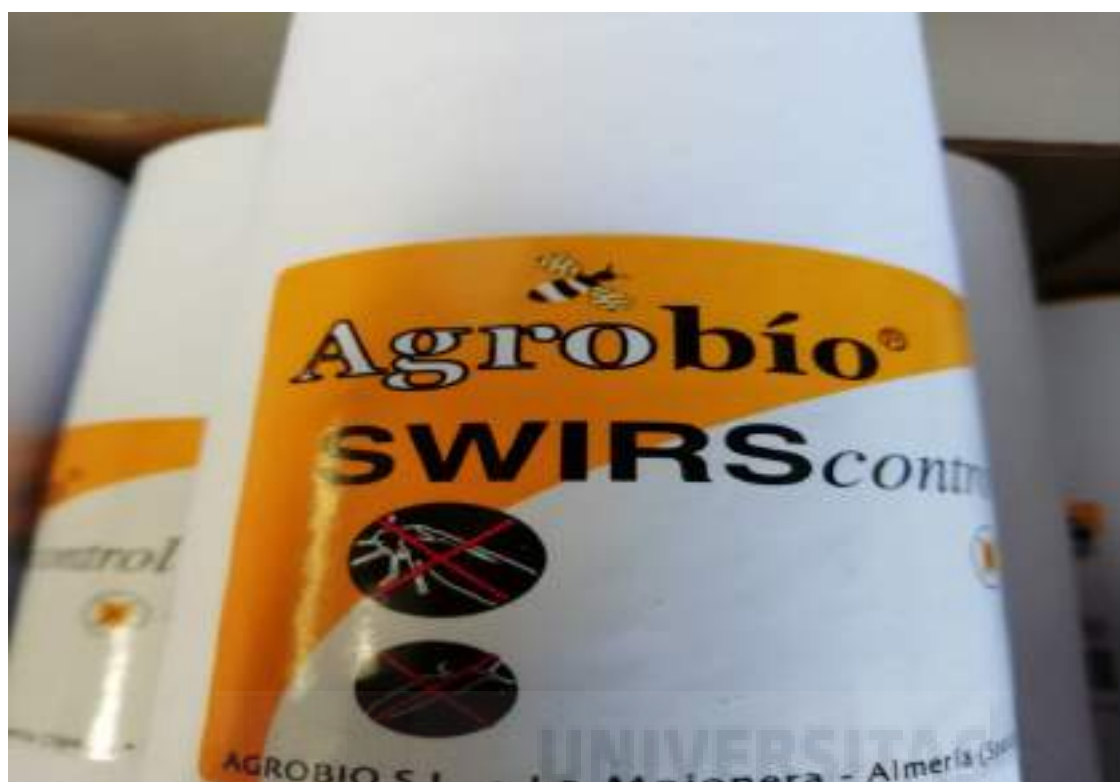
Fotografía 13: Amblyseius swirskii