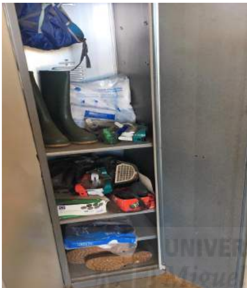
Fotografía 4: Equipo de protección individual (Epi)