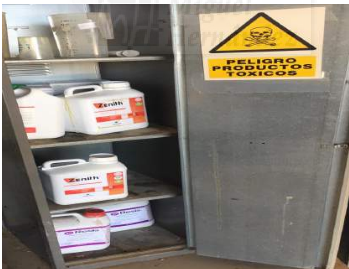
Fotografía 12: Productos fitosanitarios ecológicos II