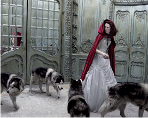
Fig. 3. Caperucita Roja de Eugenio Recuenco (2005).