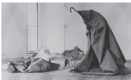
Fig. 2. I Like America and America Likes Me, 1974. Joseph Beuys.

•Referents en l'art relacional i de la memòria: per a l'acció performativa i instal·lativa de la segona peça ( El te que mai arriba ), el projecte beu de conceptes de l'Escultura Social introduïts per Joseph Beuys , (Fig.2) on el procés comunitari, la sanació i l'ús de materials quotidians carregats de simbolisme (com el sabó o el greix en el cas de Beuys) són l'obra d'art en si mateixa. D'altra banda, l'estètica de l'acumulació i la pèrdua de la identitat connecta amb el treball de Christian Boltanski, l'obra del qual reflexiona constantment sobre la memòria, la fragilitat de l'existència, els arxius de l'oblit i el rastre humà.