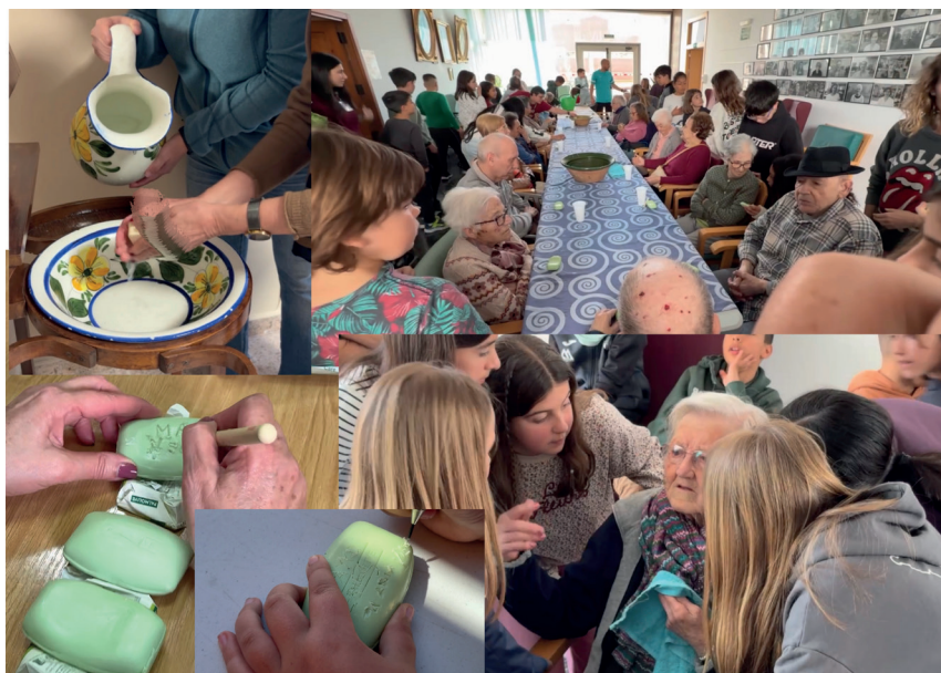
Fig. 8. Procés de producció.

L'acció, guiada des de la sensibilitat del moment del Sombrerer que està esperant des del passat el moment de les sis de la vesprada en bucle, va ser com l'espera dels ancians la visita dels més menuts. Convidar els participants a inscriure en la matèria aquelles paraules, noms propis o frases vitals que es neguen a oblidar, aquells records que constitueixen l'últim reducte de la seua identitat va ser el moment molt especial. Aquest acte de gravat va funcionar com un ritual d'afirmació: enfonsar l'estilet en el sabó va permetre fixar físicament la memòria vulnerable, convertint la paraula en un relleu tangible.