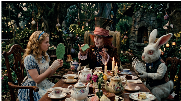
Fig. 5. IA. 2026. Imagen creada con intel·ligència artificial. [06-06-2026]

En definitiva, aquest TFG es justifica com un viatge de resiliència a través de la matèria. Es tracta d'agafar l'ombra de les patologies i de les neurodivergències i, de la mateixa manera que la llum revela la imatge blavosa en la tècnica de la cianotípia, permetre que la pràctica artística ens ajude a percebre aquestes condicions des d'una perspectiva poètica, transformadora i profundament humana. (Fig.5)