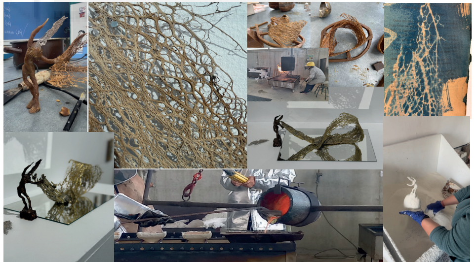
Fig. 6. Procés de producció. Imatges pròpies de l'artista.

El procés continuava una vegada feta la peça descascarillant la moloquita i repasant el metall, la soldadura i l'aplicació de les pàtines per a emfatitzar el caràcter noble i perdurable que es volia atorgar a l'alta sensibilitat.