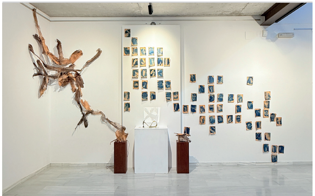
Fig. 7. El jardí d'Àlicia , 2026. Marga Cano. Centre d'Arts Taller d'Ivars en Benissa.

Aquesta peça ha format part de l'exposició Botànica , juntament amb el col·lectiu GAB de Benissa, a les instal·lacions del Centre d'Arts Taller d'Ivars. ANEXE I (Cartell i Fulla de Sala) (Fig.7)