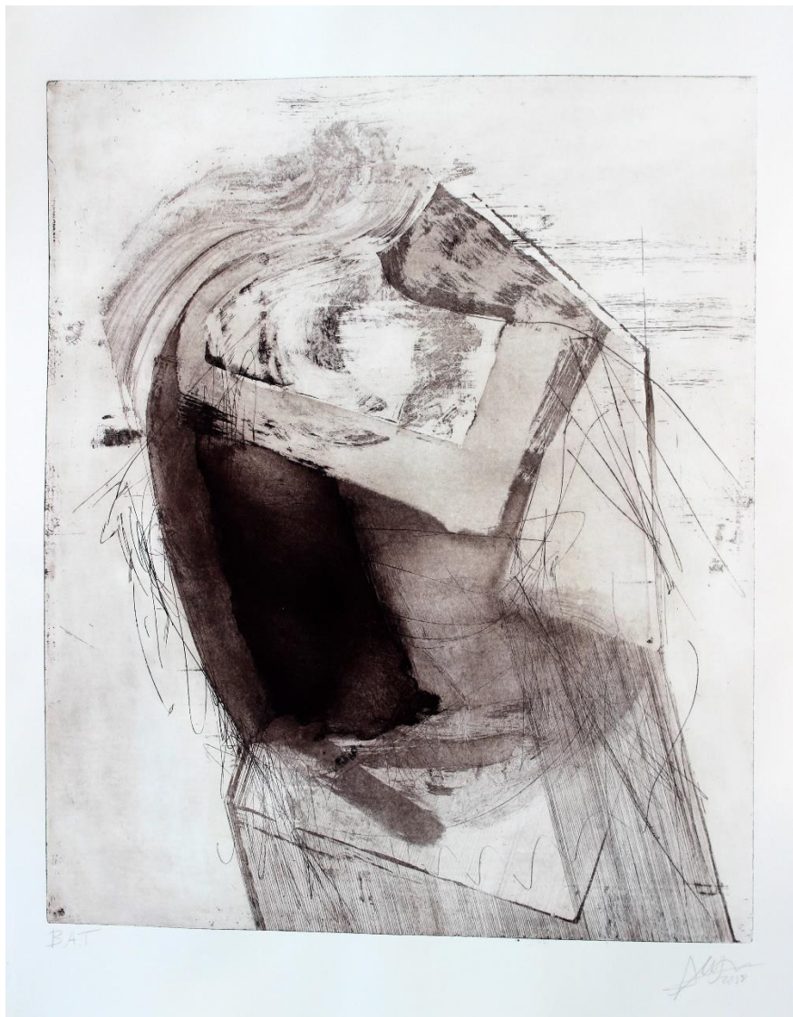
Melancolía. Grabado al Aguafuerte, aguatinta, mordiente directo y punta seca. Dimensiones: 75,9 X 65,4 cm. 2018

EXPOSICIÓN COLECTIVA: VI Bienal Internacional de Grabado AGUAFUERTE 2018. SELECCIÓN Y PARTICIPACIÓN DE OBRA, CATÁLOGO.