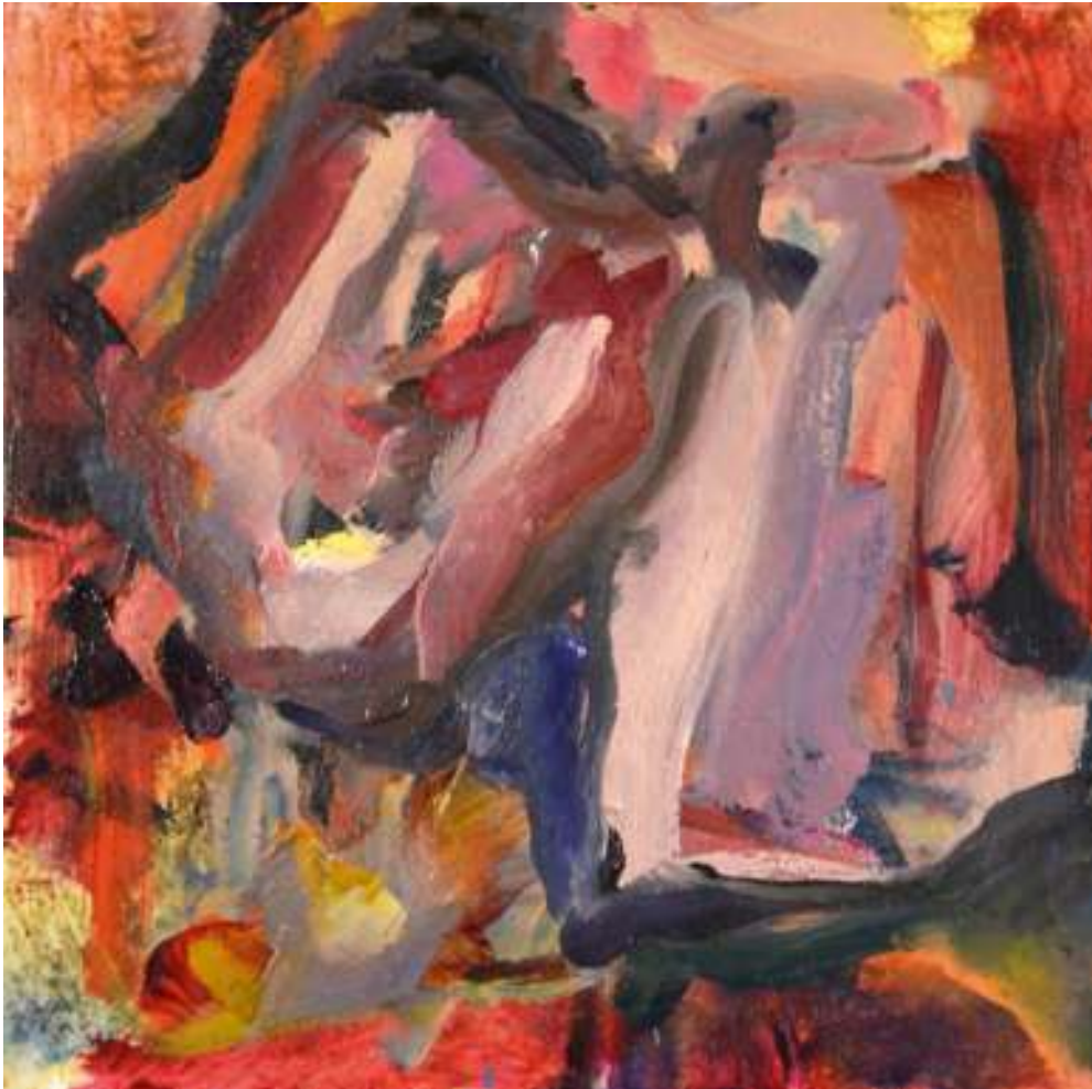
Igneo Corpore IV Óleo y tierras sobre tela. 50 x 50 cm.