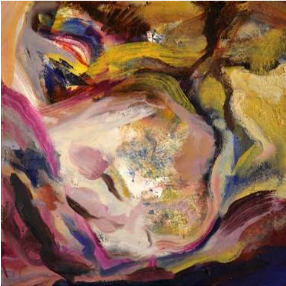
Igneo Corpore VIII Óleo y tierras sobre tela. 50 x 50 cm.