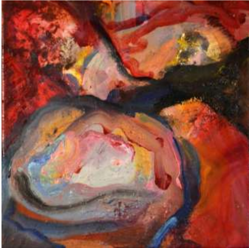
Igneo Corpore XIV Óleo y tierras sobre tela. 30 x 30 cm.