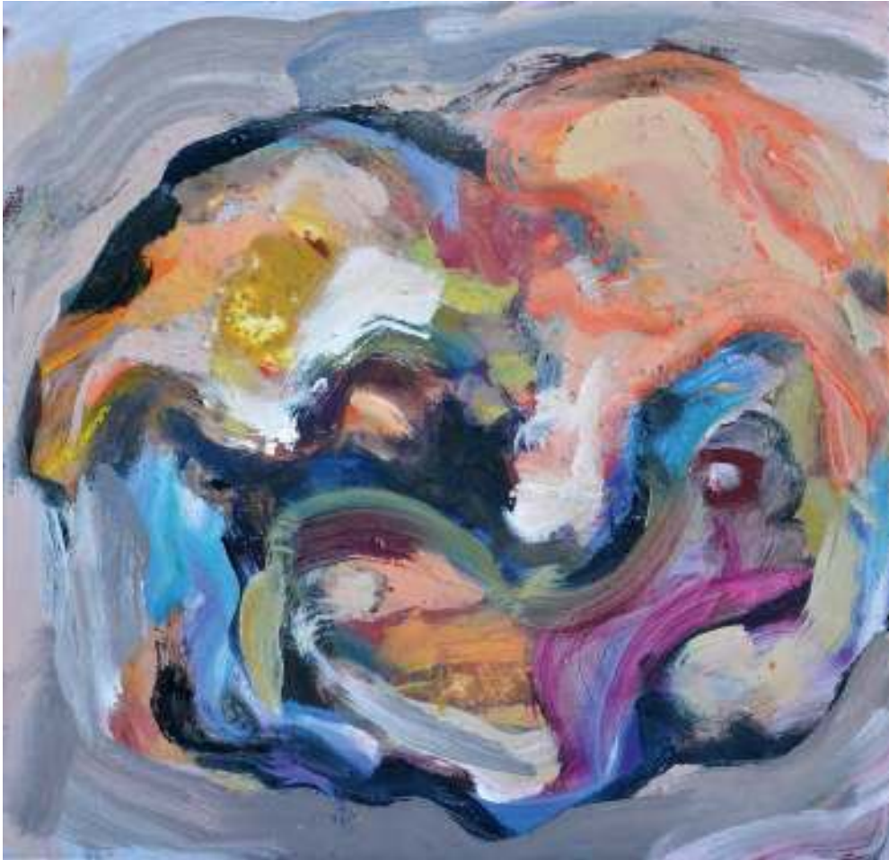
Igneo Corpore XXII Óleo y tierras sobre tela. 50 x 50 cm.