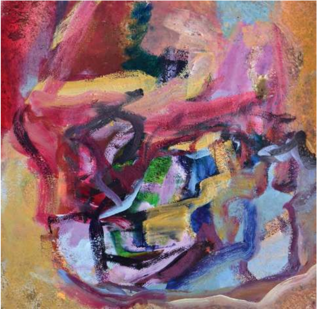
Ignis Re IV Óleo y tierras sobre tela. 100 x 100cm.