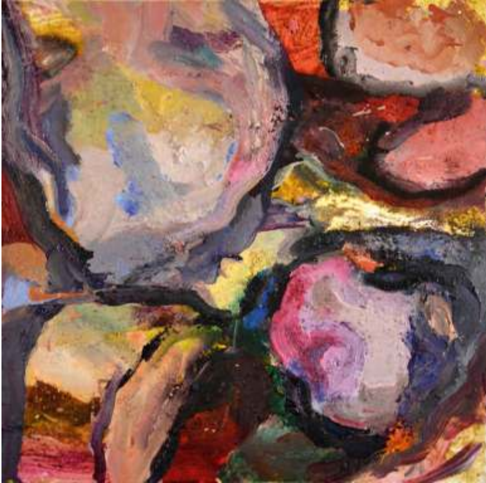
Igneo Corpore VII Óleo y tierras sobre tela. 50 x 50 cm.