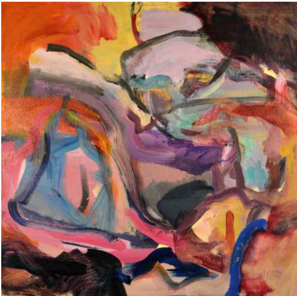
Igneo Corpore I Óleo y tierras sobre tela. 100 x 100 cm.