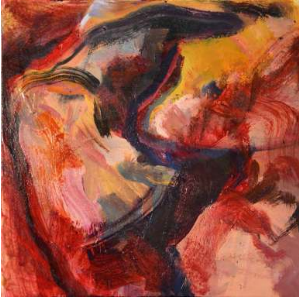
Igneo Corpore XI Óleo y tierras sobre tela. 50 x 50 cm.