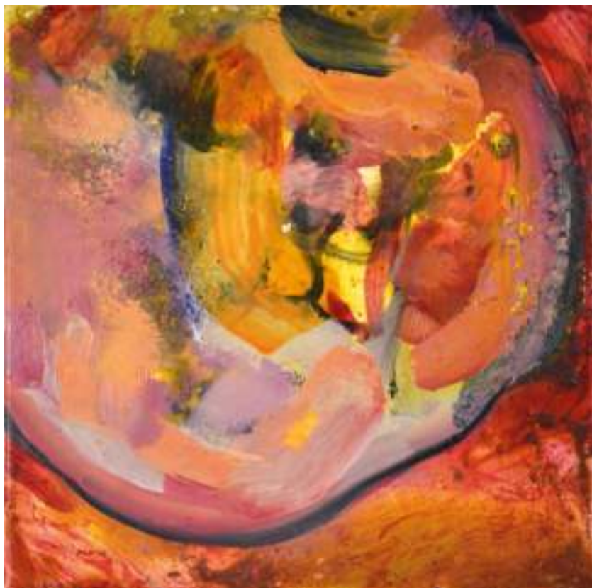
Igneo Corpore XIX Óleo y tierras sobre tela. 30 x 30 cm.