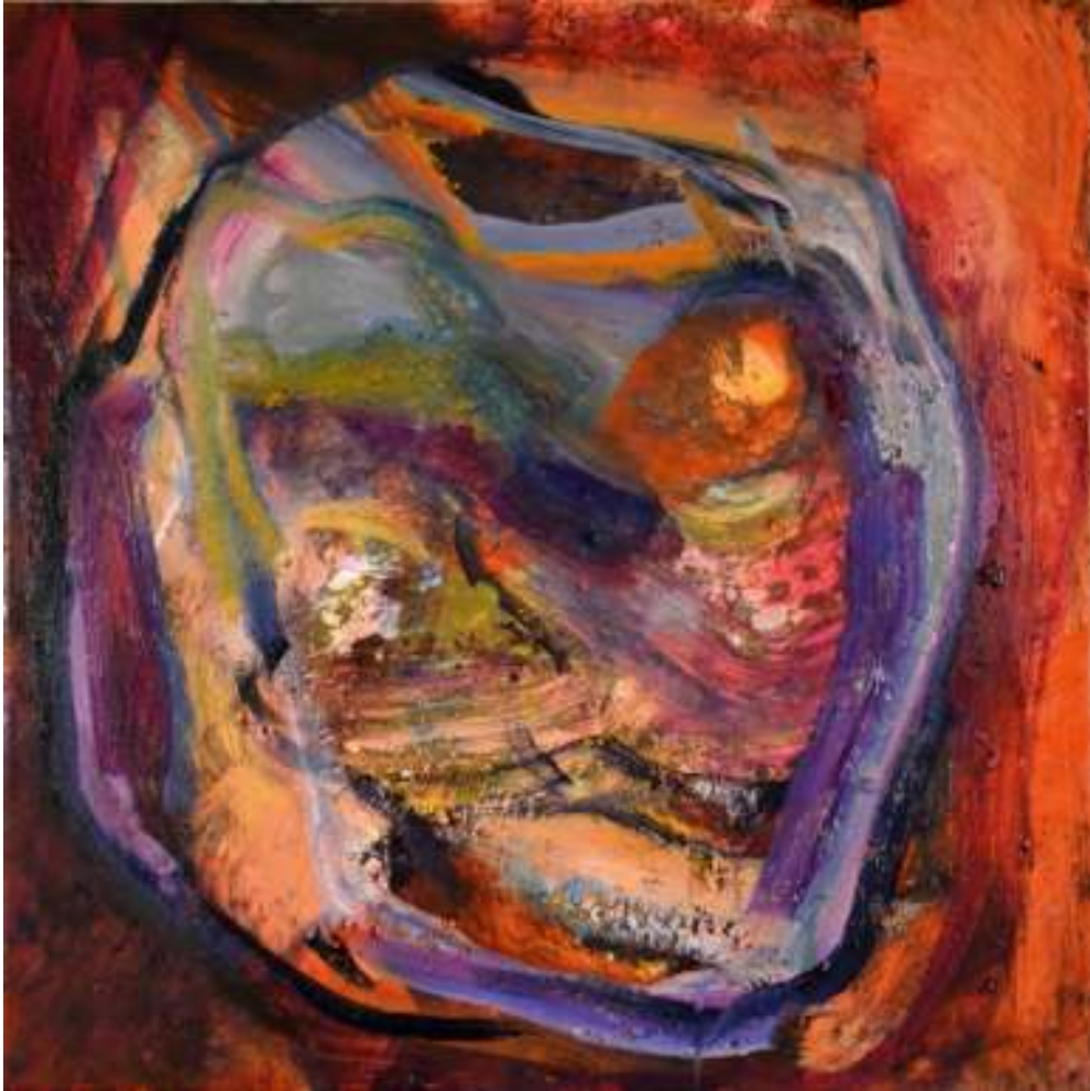
Igneo Corpore XII Óleo y tierras sobre tela. 50 x 50 cm.