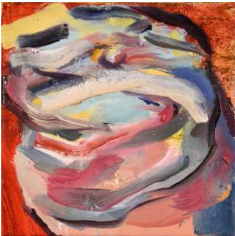
Igneo Corpore XV Óleo y tierras sobre tela. 30 x 30 cm.