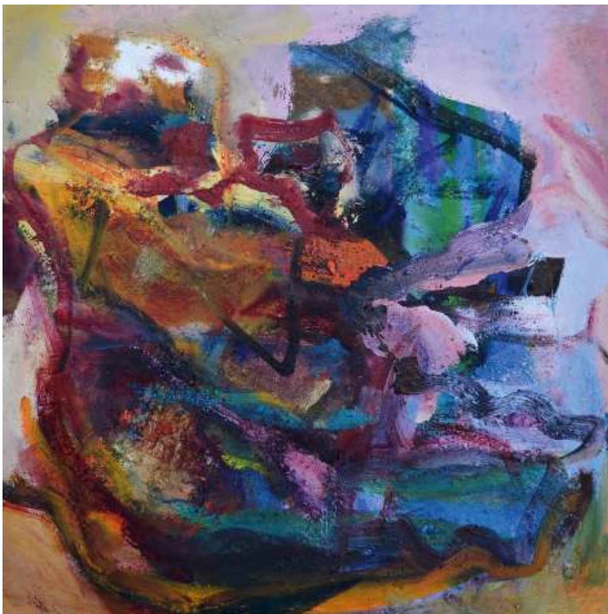
Ignis Re III Óleo y tierras sobre tela. 100 x 100 cm.