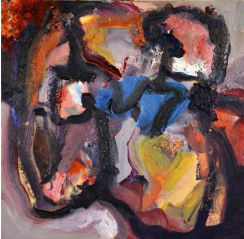
Igneo Corpore X Óleo y tierras sobre tela. 50 x 50 cm.