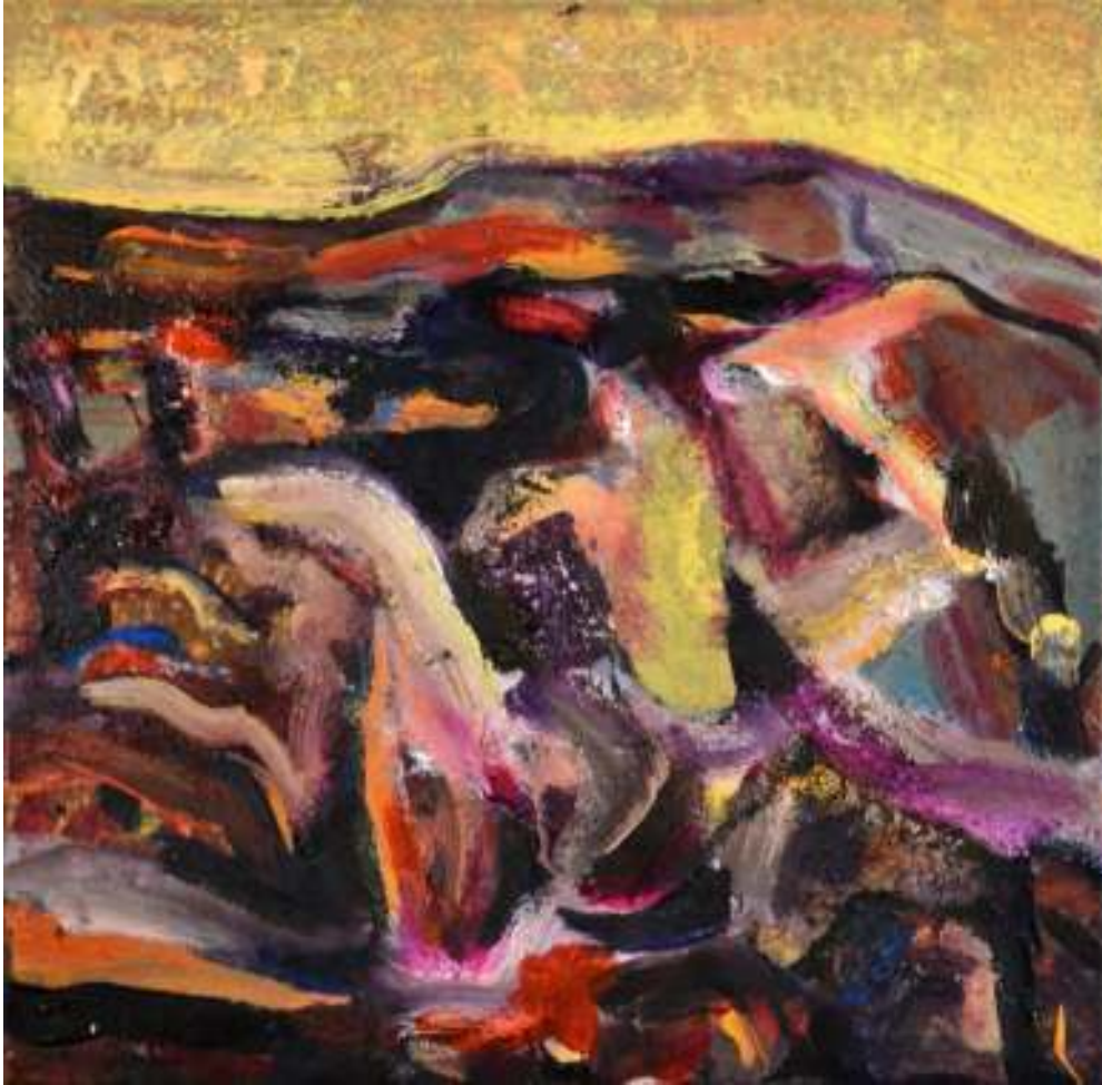
Igneo Corpore VI Óleo y tierras sobre tela. 50 x 50 cm.