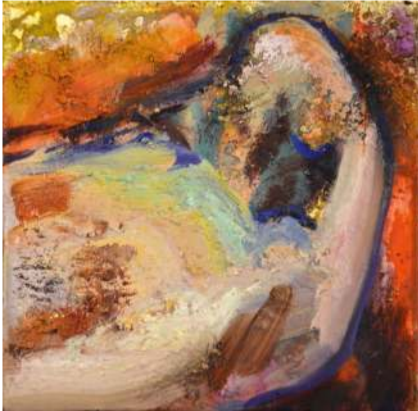
Igneo Corpore XVIII Óleo y tierras sobre tela. 30 x 30 cm.