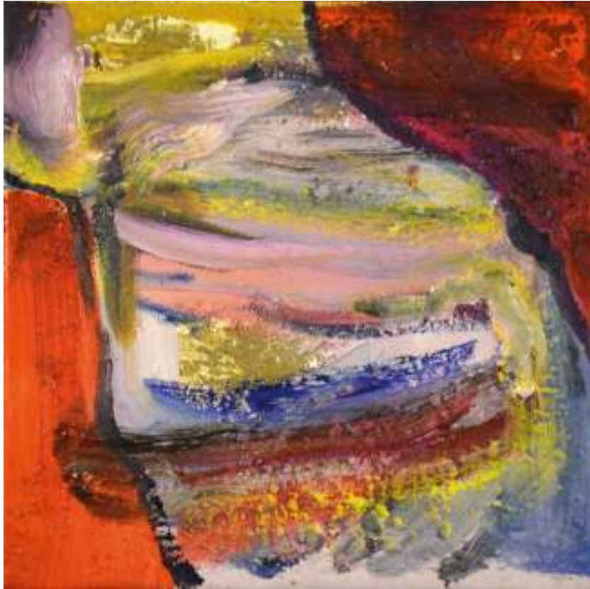
Igneo Corpore XVII Óleo y tierras sobre tela. 30 x 30 cm.