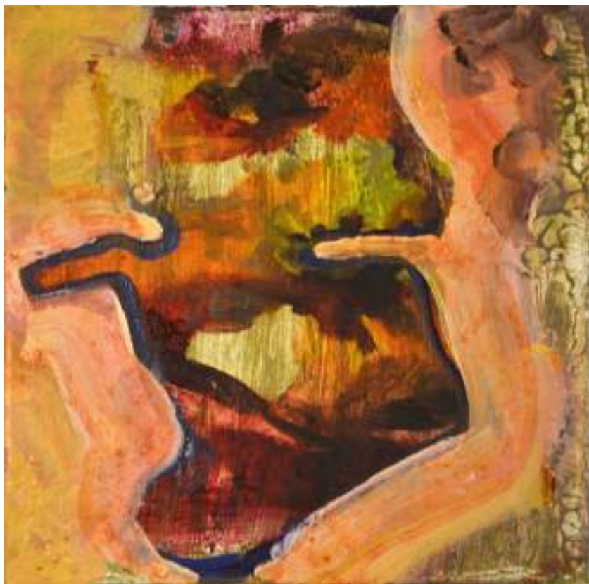
Igneo Corpore XVI Óleo y tierras sobre tela. 30 x 30 cm.