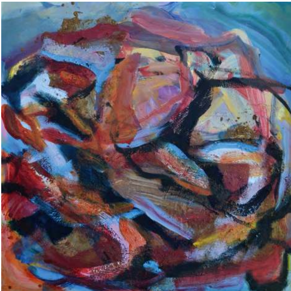
Ignis Re VI

Óleo y tierras sobre tela. 100 x 100 cm.