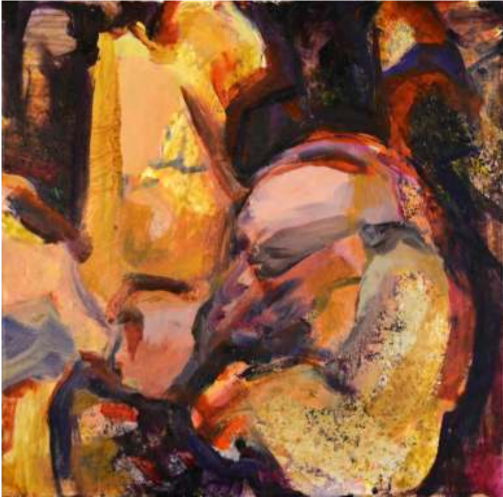
Igneo Corpore IX Óleo y tierras sobre tela. 50 x 50 cm.