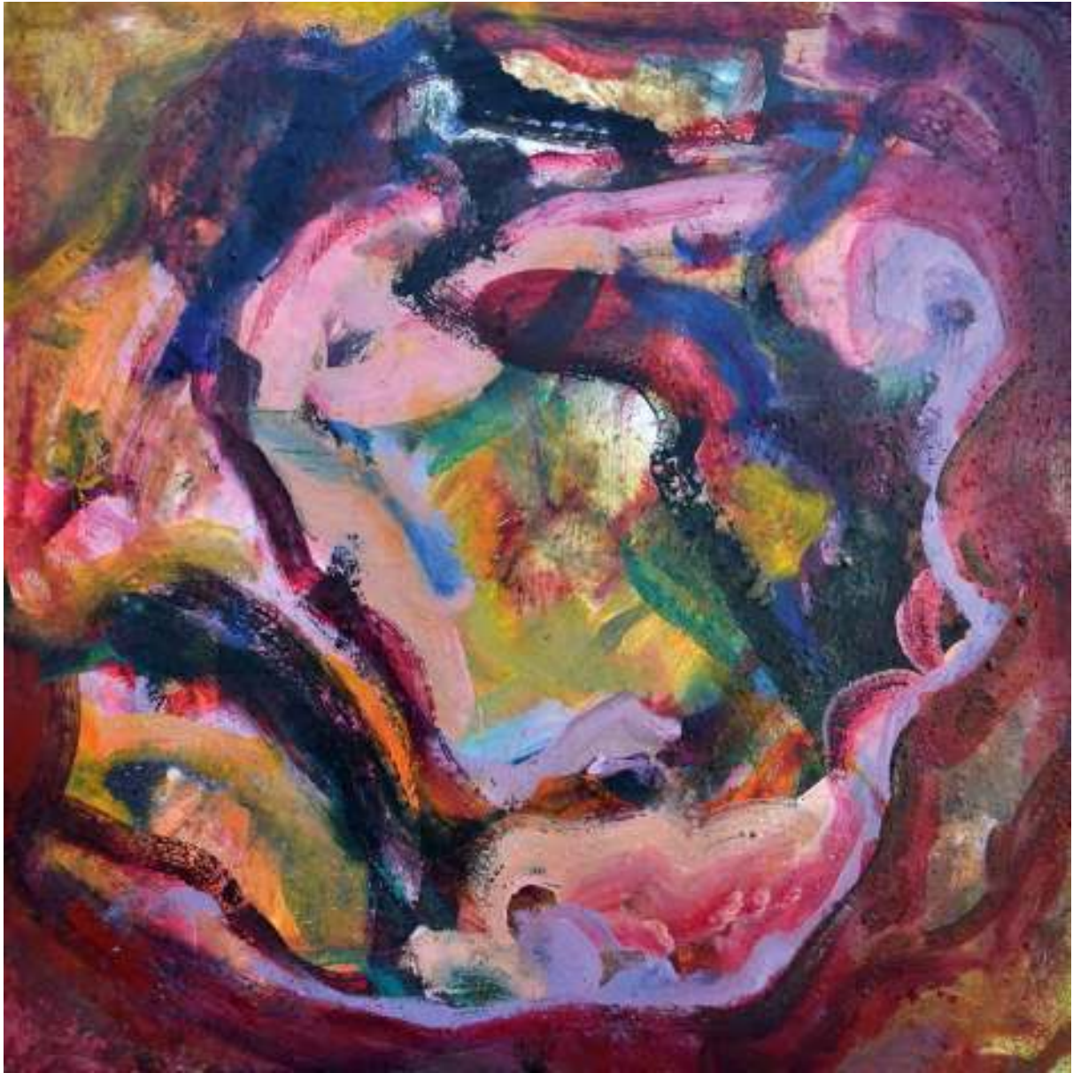
Ignis Re II

Óleo y tierras sobre tela. 100 x 100 cm.