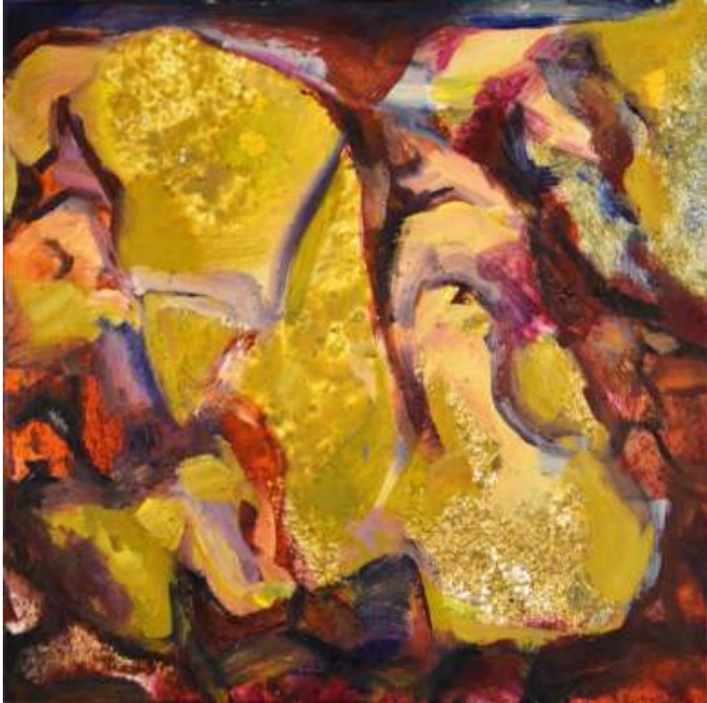
Igneo Corpore III Óleo y tierras sobre tela. 50 x 50 cm.