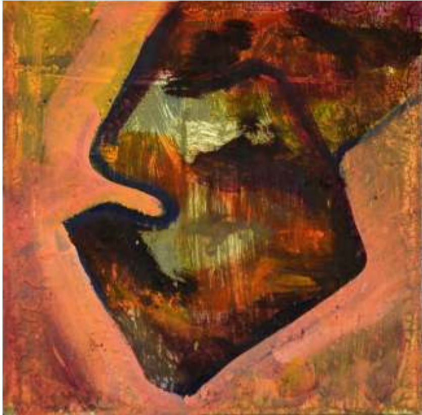
Igneo Corpore XX Óleo y tierras sobre tela. 30 x 30 cm.