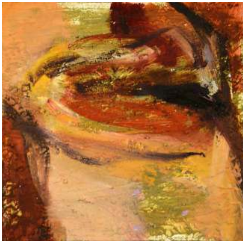
Igneo Corpore XXI Óleo y tierras sobre tela. 30 x 30 cm.