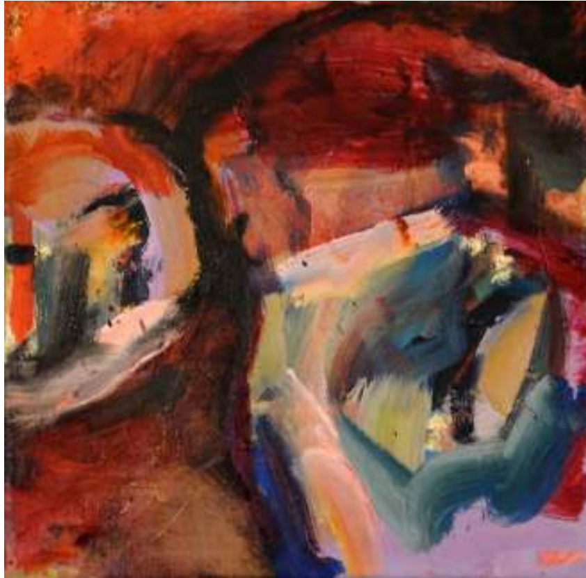
Igneo Corpore XIII Óleo y tierras sobre tela. 30 x 30 cm.