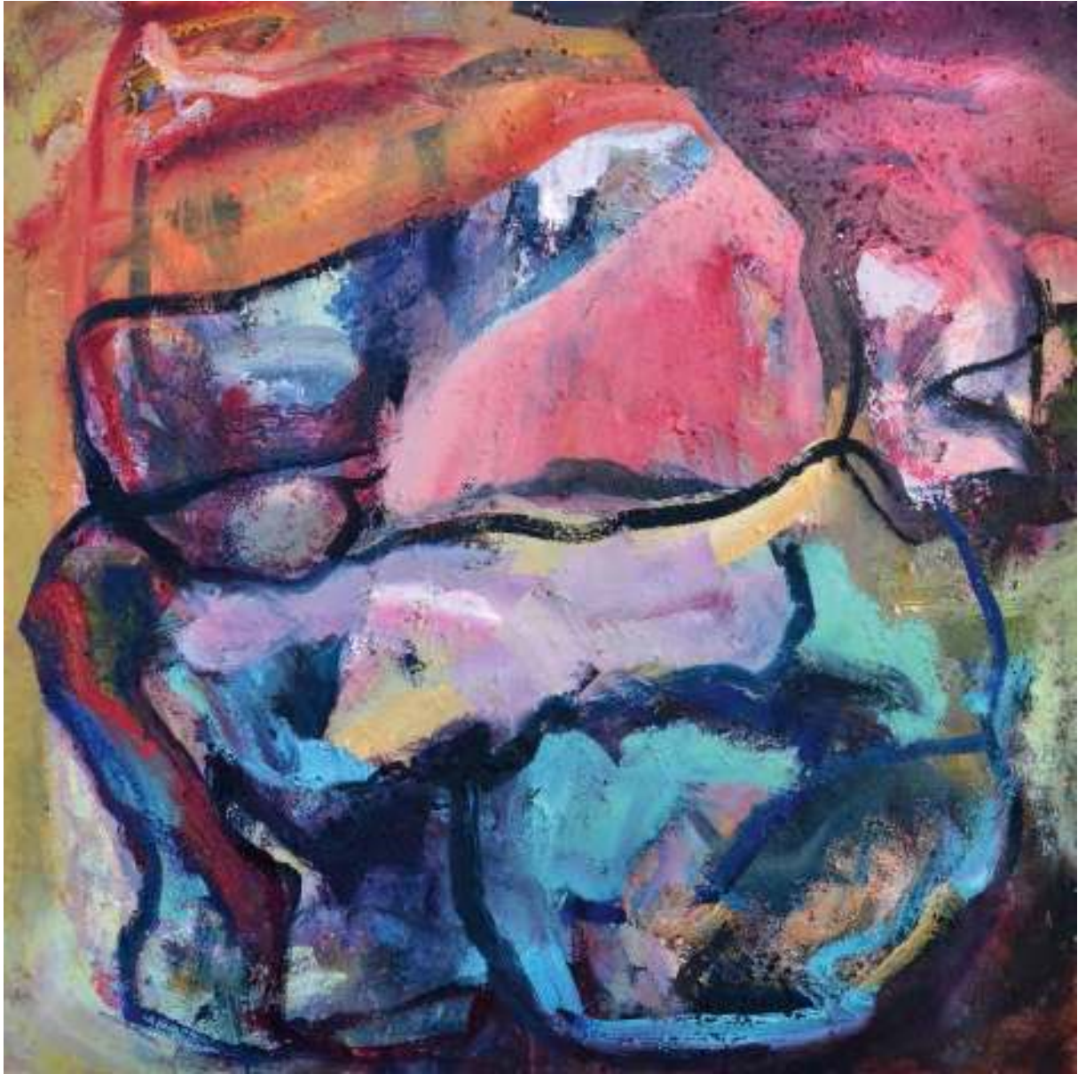
Ignis Re V

Óleo y tierras sobre tela. 100 x 100 cm.