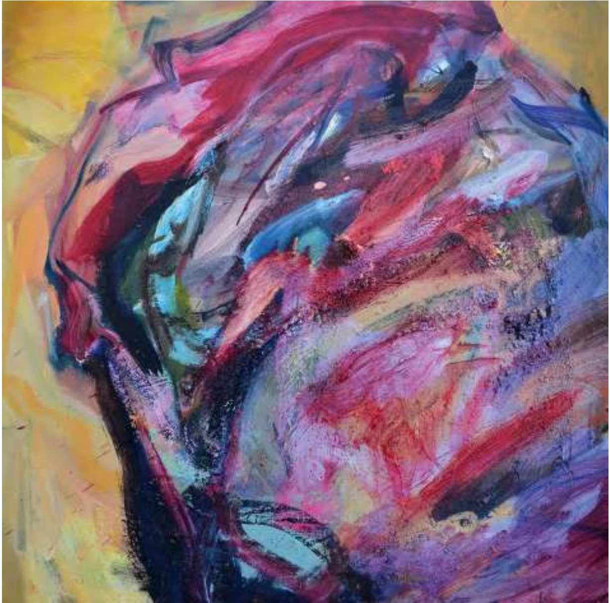
Ignis Re VII

Óleo y tierras sobre tela. 100 x 100 cm.