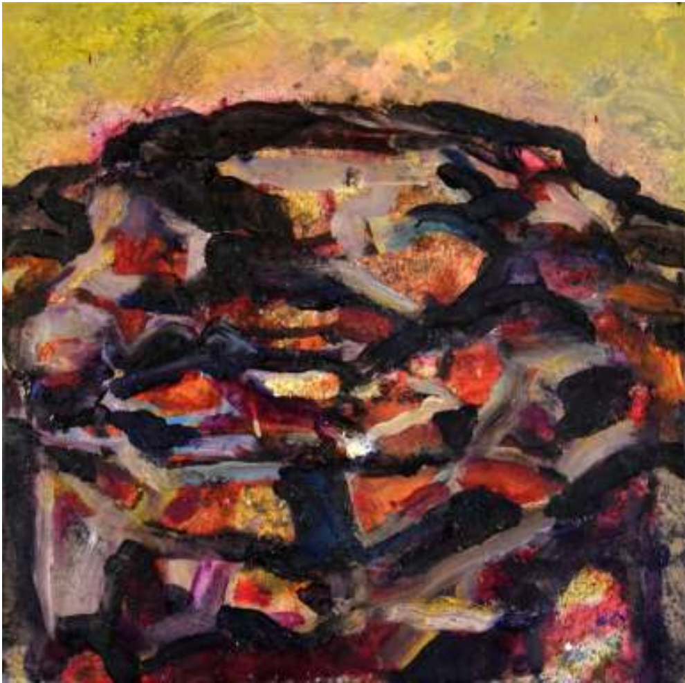
Igneo Corpore V Óleo y tierras sobre tela. 50 x 50 cm.