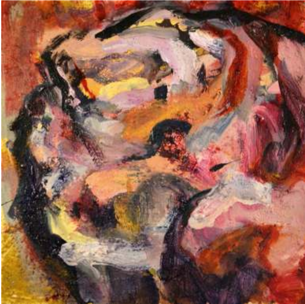
Igneo Corpore II Óleo y tierras sobre tela. 50 x 50 cm.