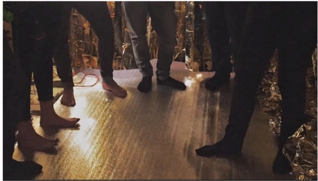
[Emergencias cotidianas] (2019). Vista parcial environment procesual en La Peluquería. Encuentro con participantes anónimos.