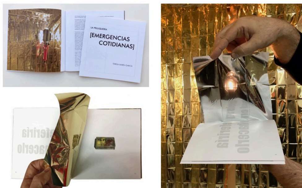
Publicación [Emergencias Cotidianas] .

1.1b_PUBLICACIÓN CON ISBN en formato de ensayo visual que incluye un ensayo teórico: [Emergencias Cotidianas] . Ediciones de La Peluquería. ISBN: 978-84-09-10535-9, 24 pp. Edición limitada de 75 ejemplares personalizados.