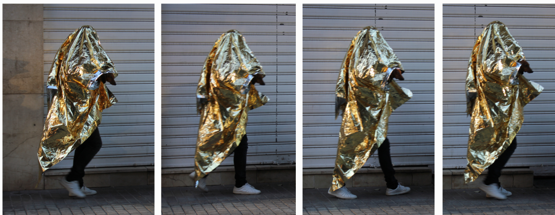
Emergencias cotidianas , 1018 - 2019. Varias acciones urbanas, colectivas e individuales, propias y de participantes, en distintos lugares y a lo largo del tiempo.

1.1b_PUBLICACIÓN CON ISBN en formato de ensayo visual que incluye un ensayo teórico: [Emergencias Cotidianas] . Ediciones de La Peluquería. ISBN: 978-84-09-10535-9, 24 pp. Edición limitada de 75 ejemplares personalizados.