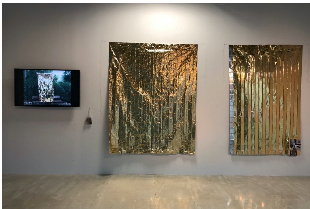
Teresa Marín. Kit de emergencia y vídeo Emergencias colectivas v1 . 2018. Exposición La senda es peligrosa . Facultad Bella Artes, UMA, Málaga.