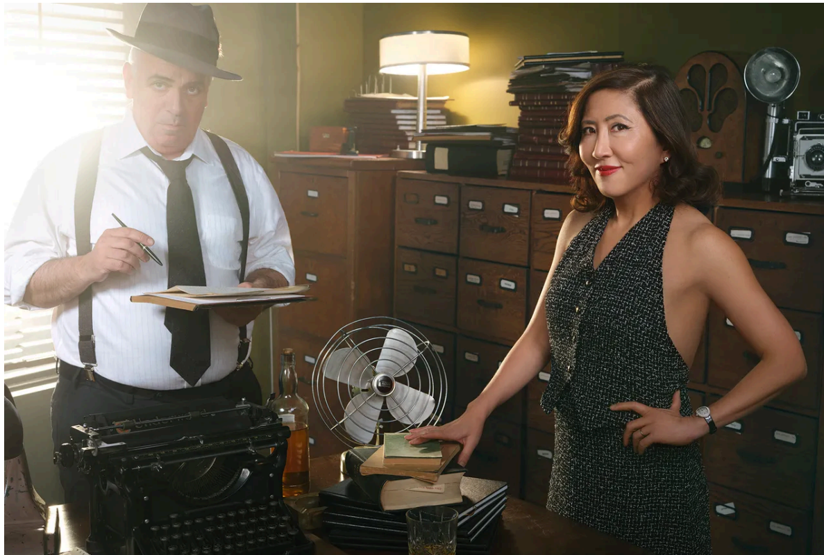
Martin Schoeller (Vanity Fair).

experimentada Janice Min, Rushfield ha demostrado que un proyecto periodístico especializado puede, a golpe de exclusivas, experiencia y trabajo de fuentes, desbancar a las clásicas revistas de cine angelinas. Cuenta con 130.000 suscriptores y se distribuye en Substack, plataforma desde la que ha multiplicado su aventura con una decena de boletines especializados.