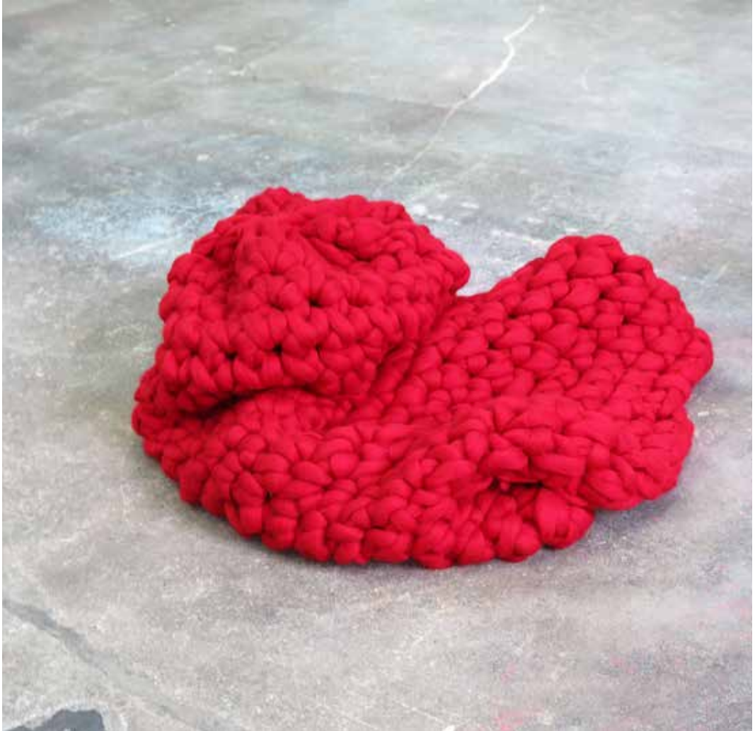
KOKON II 2020 LANA MERINO 150 X 50 CM