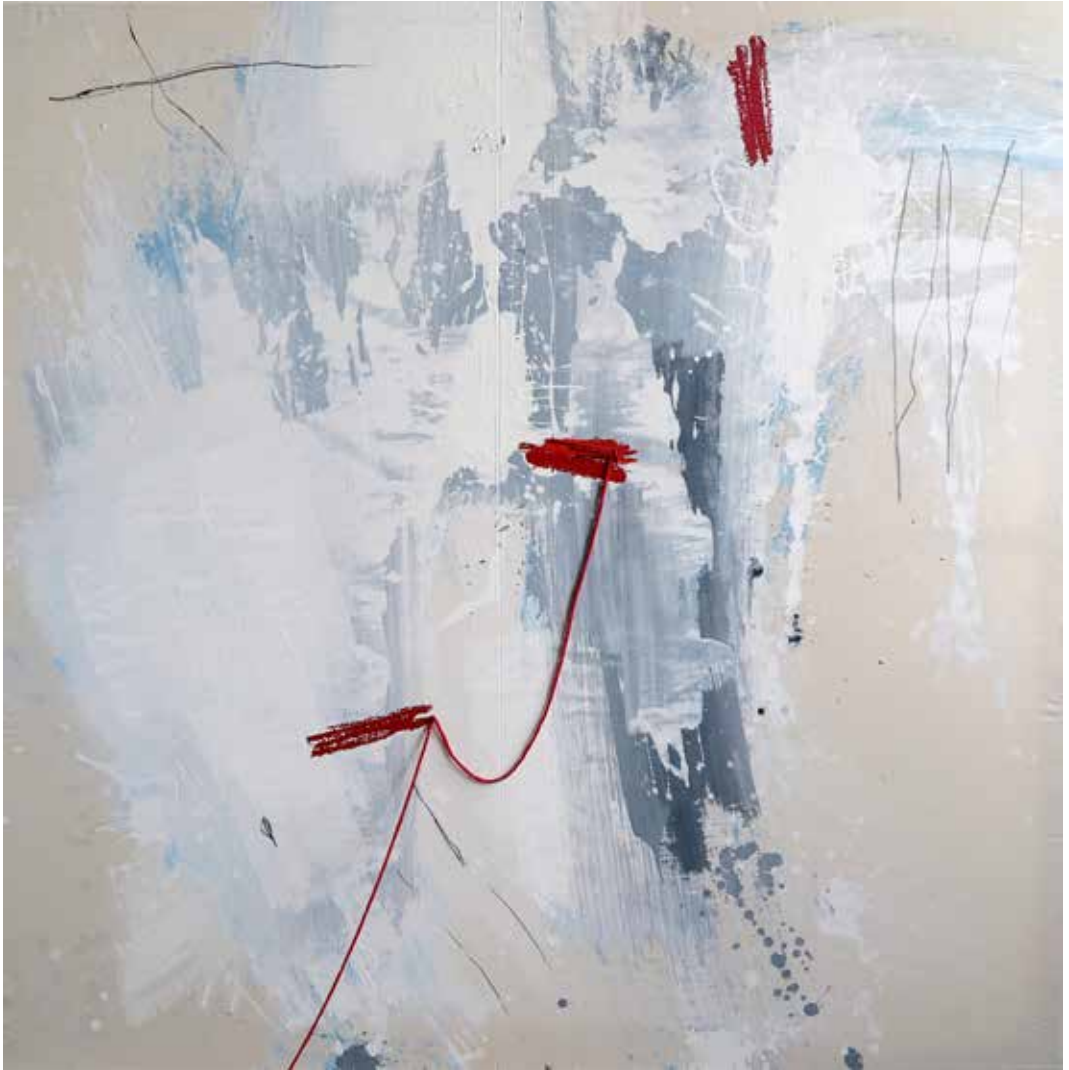
COSINT FERIDES I 2020 MIXTA SOBRE TELA 170 X 170 CM