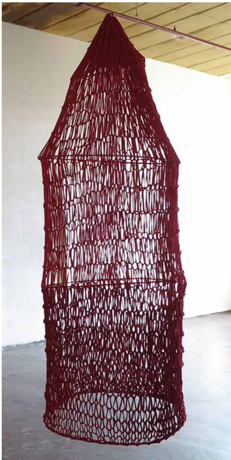
KOKON I 2020 ALGODÓN 200 X 70 CM