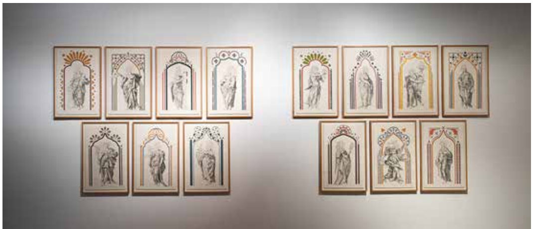
SERIE DE CONFLICTU 2019-2020 14 LINOGRABADOS EN HUECO, IMPRESIÓN GLICÉE Y TROQUELADO 80 X 50 CM C/U