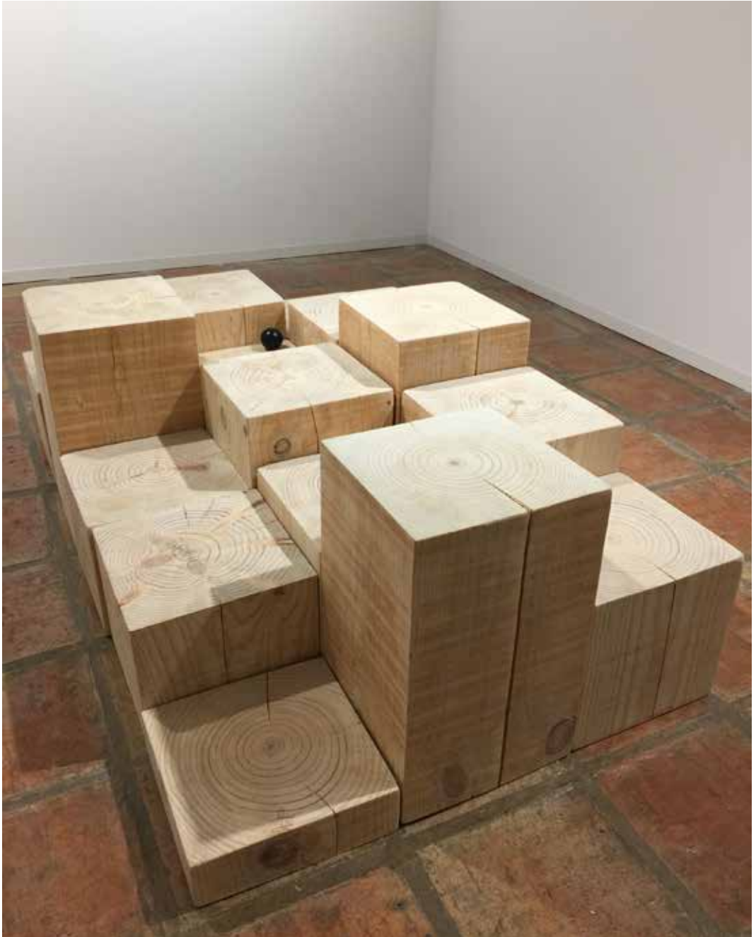
CONVERSACIÓN 1 2020 INSTALACIÓN. MADERA DE PINO 55 X 150 X 90 CM