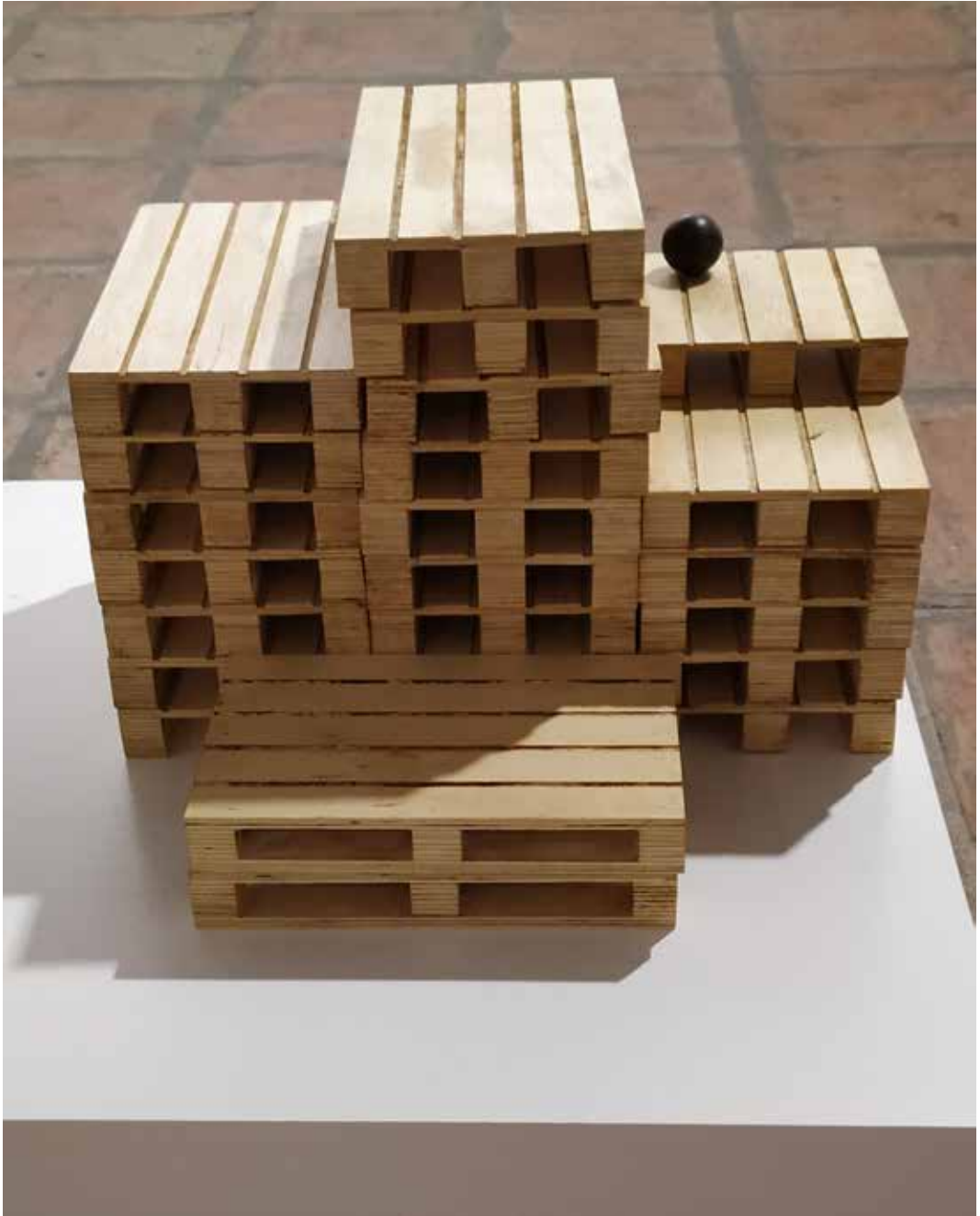
CONVERSACIÓN 3 2020 INSTALACIÓN. MADERA DE PINO 45 X 50 X 25 CM