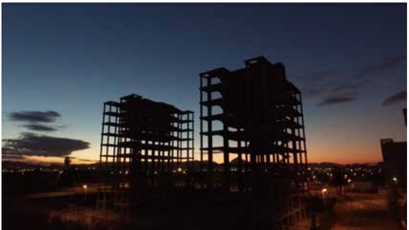
HUESO Y HORMIGÓN 2016 VIDEO HD MONOCANAL CON SONIDO ESTÉREO 9'20 MIN