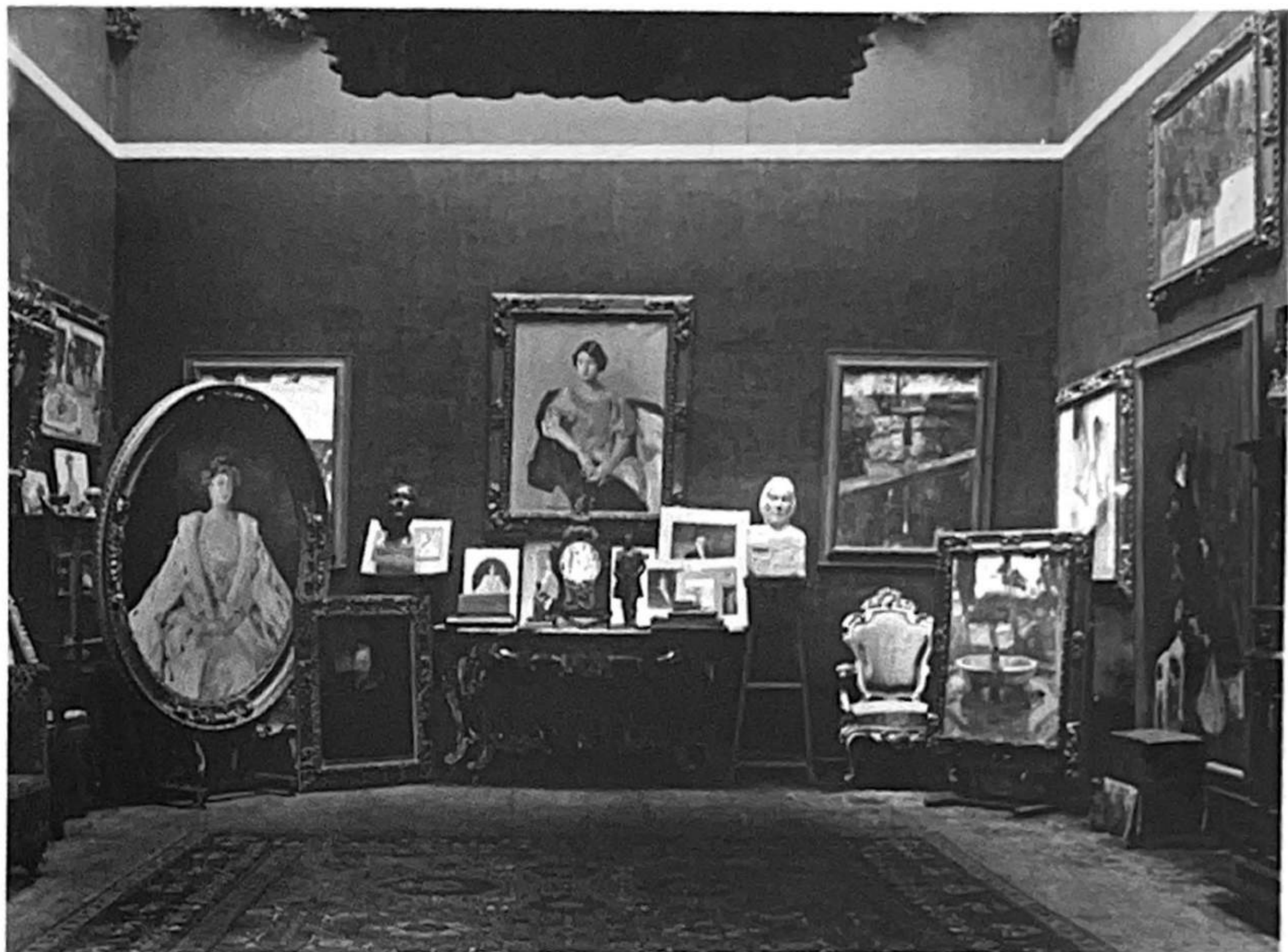
| 3 | Sala de visitas de la casa de Sorolla, 1917. AFMS, 81036.

turas. El catálogo de éstas comienza por piezas del siglo IV antes de Cristo y termina, como tantas cosas en esa casa, en la década de 1920. Probablemente el grupo más nutrido de esculturas ronda esa fecha, y muchas de ellas son obra de la hija menor del pintor, Helena Sorolla. No son las piezas más valiosas de la colección, pero tienen una calidad muy estimable, y la importancia histórica derivada de la condición de pionera de la escultora, mujer en una actividad tradicionalmente masculina. Además, resultan útiles para entender la importancia que el pintor dio a las artes en la educación de sus hijos, y especialmente de sus hijas; así como para comprobar la voluntad de Sorolla de que sus discípulos y admiradores siguieran su propia personalidad, sin imitarle a él. Quizá pueden servir para entender cuestiones concretas de las facetas clasicistas y modernistas de su pintura, dado que éstas aparecen también en la obra de su hija, y en distintos elementos de la casa. Probablemente haya muchos motivos que justifiquen la atención hacia el hogar de los