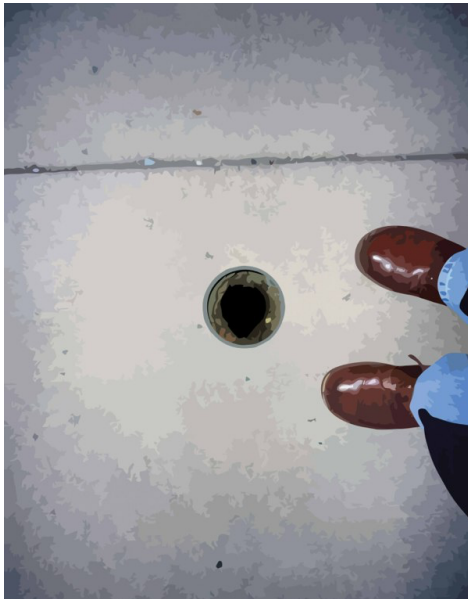
La naturaleza se abre camino. 2014

La naturaleza se abre camino (2014) , fue una pieza que combina la pintura con la