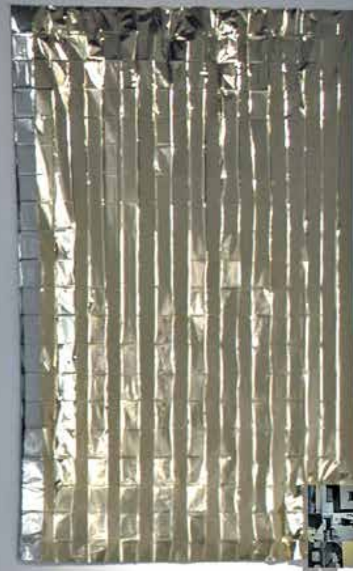
Emergencias cotidianas , (2018). Mantas isotérmicas, fotografías, cuerda, kit de supervivencia y vídeo monocanal 3'39".