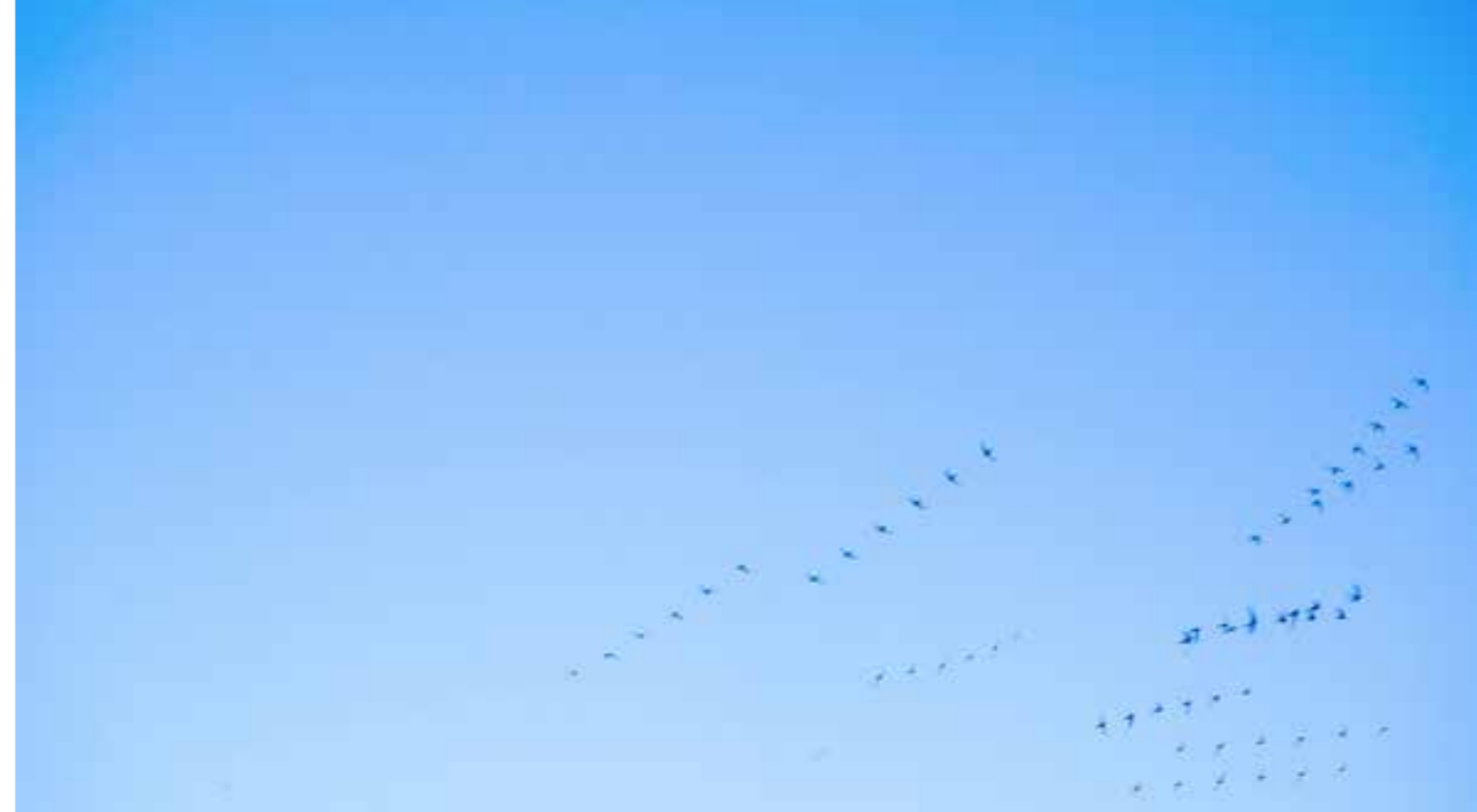
La senda es peligrosa. Vídeo monocal, 14' 08". 2018.

Existe la tendencia a evaluar los méritos de una obra dividiendo su valor por la cantidad de autores que han intervenido en ella, y esa devaluación es particularmente crítica en el ámbito de la investigación artística dependiente de las instituciones. Incluso entre los méritos concedidos a una obra artística colaborativa, la burocracia exige una ordenación jerárquica de los diversos autores que usa para repartir desigualmente las puntuaciones de cada uno. Esto desincentiva la investigación en régimen de cooperación con otros artistas, causando un desfase entre los paradigmas institucionales y los modos de hacer más contemporáneos.