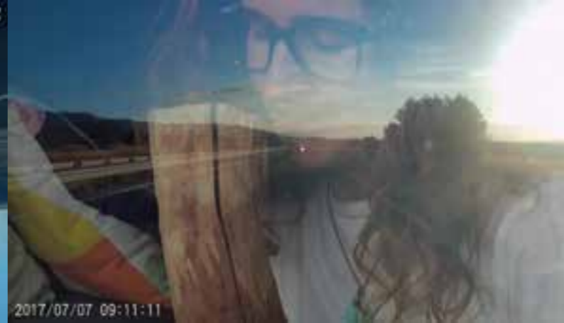
Trayectorias. Vídeo monocanal en bucle, 10' 39". 2018.