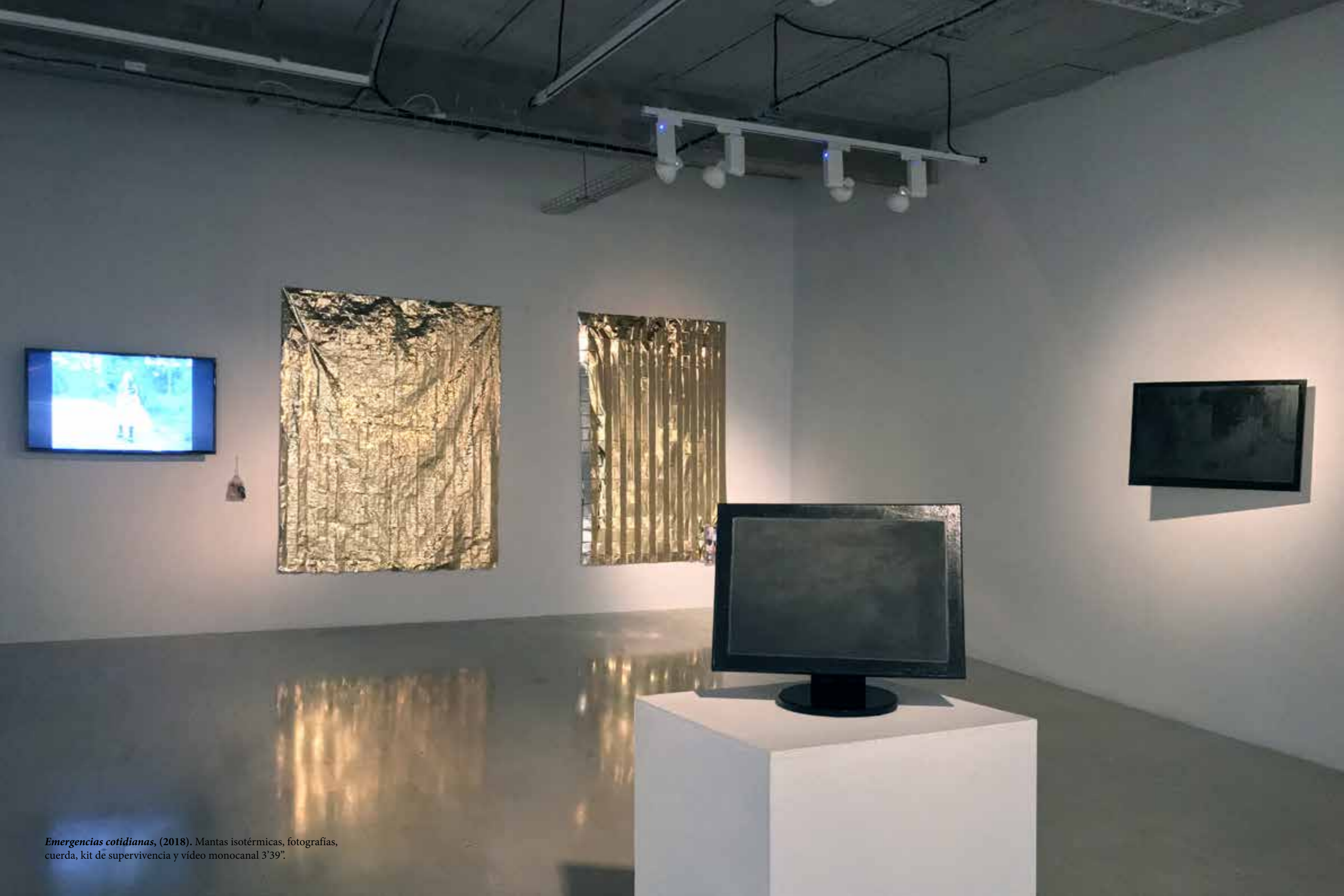
Emergencias cotidianas , (2018). Mantas isotérmicas, fotografías, cuerda, kit de supervivencia y vídeo monocal 3'39".