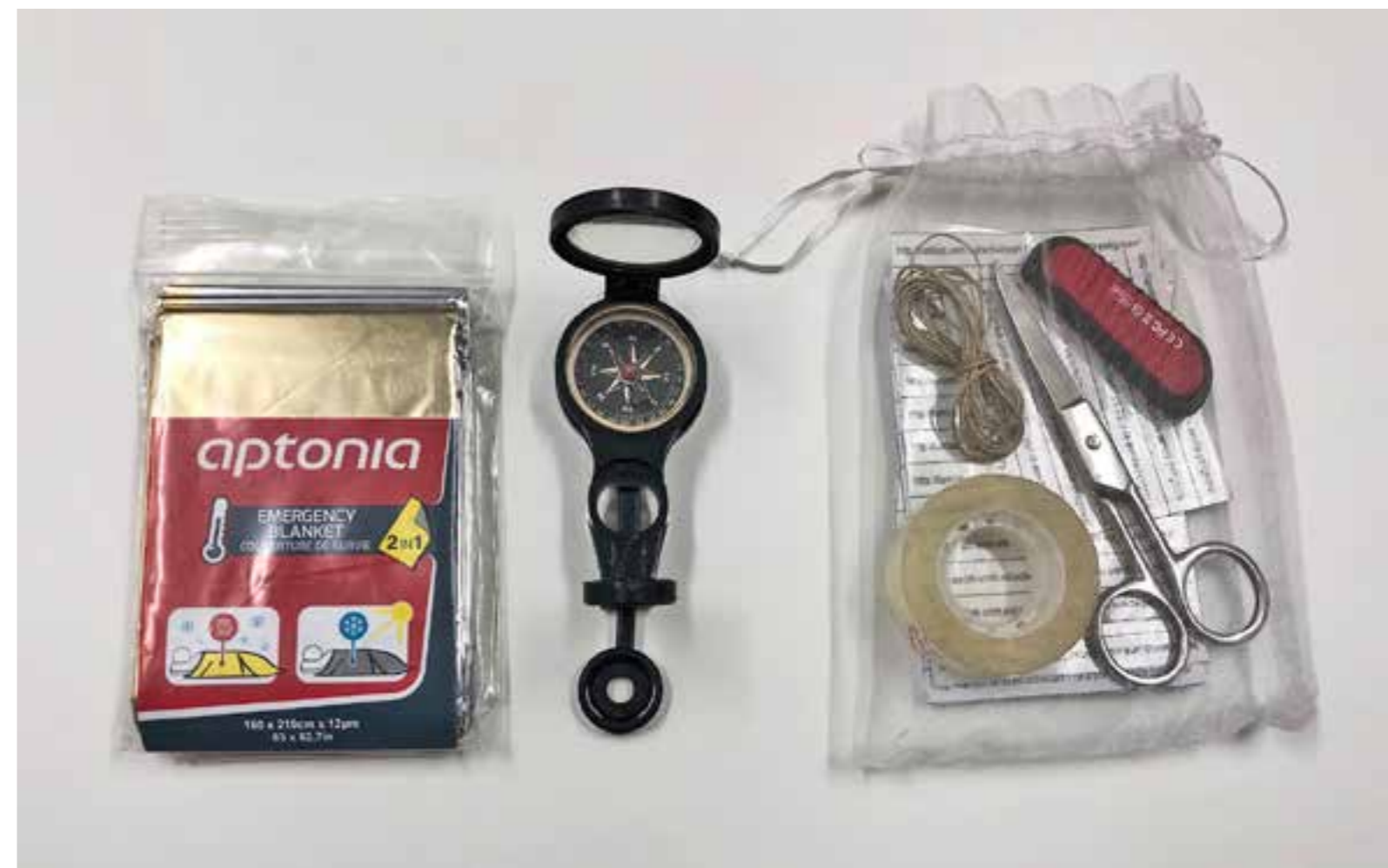
Kit de emergencia

Los objetos que enviamos habían vuelto transformados y cargados de nuevos estratos de sentido, nuevas potencialidades. Con las imágenes de los pedazos abandonados en el camino traté de recomponer la manta de supervivencia, que ahora hablaba de vivencias, encuentros, lugares ocasionales, lugares cualquiera y no-lugares. La manta todavía conservaba su apariencia original, con sus dobleces y su lisura casi especular. Quise mostrar la manta extendida, como una forma de potencialidad, disponible para