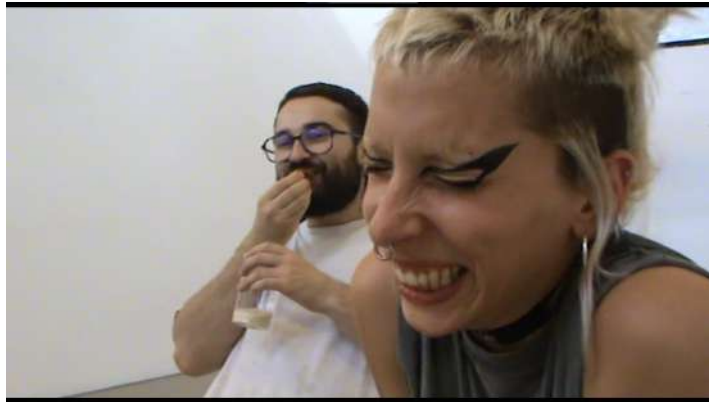
Fig. 12: Fotograma extret del videomuntatge

El conjunt de les tres obres aconsegueix transmetre el missatge.