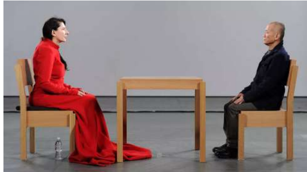
Fig. 04: Marina Abramovic - The Artist Is Present , 2010

Visualment, Abramovic a The Artist Is Present (Fig. 04) amb l'escena de reunió vora la taula, on encara que no interactuen més que en la mirada, ambdues persones generen un ambient en el qual s'inclouen i formen part de l'obra arribant a ser quasi com una escultura.