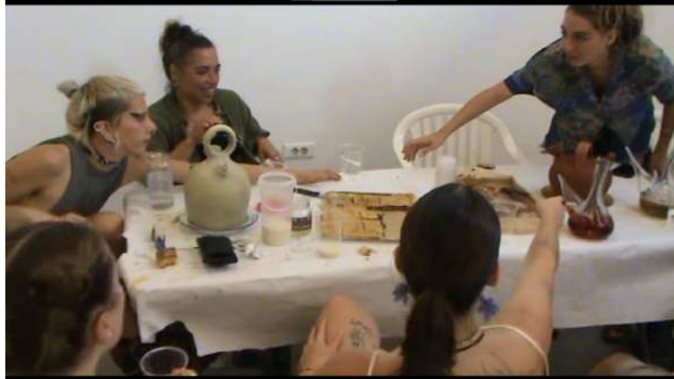
Fig. 14 Fotograma extret del videomuntatge

Amb el happening (Fig. 10,12 a 16), per una banda, els espectadors faran que la instal·lació cobre vida i, per altra banda, amb l'acció racional es captarà per complet l'essència de l'obra on per mitjà d'un menjar la gent assistent generarà un vincle i es farà germanor.