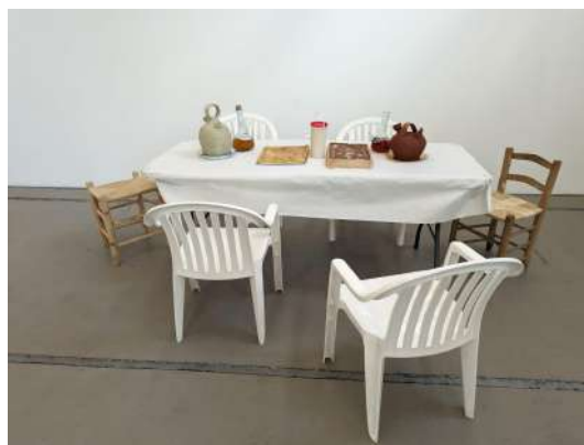
Fig. 09: Josep Oriol Gamir Ordaz - Menjar popular , 2024 Instal·lació artística. Dimensions variables.

Durant el procés, el tema del treball va canviar i això va fer que es deixés d'usar els exvots, però es van mantenir les cadires i la taula, variant el material, en comptes de fusta serien de plàstic, imitant les que es gasten als menjars populars al poble. També s'incorporaren elements com porrons o càntirs i menjar (Fig. 09).