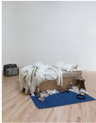
Fig. 02: Tracey Emin - My Bed , 1998 Instal·lació Artística.

L'obra d'Emin My Bed (Fig. 02) és un bon referent d'environment en el que es genera un ambient real en un context que no és l'habitual del qual apareix presentat com a obra, en el cas del referent, un museu en comptes de l'habitació a la residència de l'artista o en el cas del TFG, la universitat en comptes d'un recinte festiu el carrer o algun espai privat on celebrar el berenar.