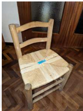
Fig. 08: Cadira de fusta cordada a mà

Amb les respostes rebudes, en format d'àudio, per una petita part de la població a les preguntes formulades per l'alumne en forma d'enquesta per mitjà de l'aplicació de "Whatsapp", es va fer una primera proposta d'instal·lació amb quatre cadires de fusta (Fig. 08) al voltant d'una taula també de fusta i exvots per parlar de les coses que els agradava o no a la gent del poble sobre el poble.