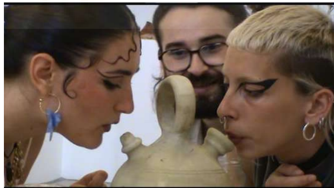
Fig. 13 Fotograma extret del videomuntatge

Parlant de la instal·lació (Fig. 09), transmet que allò que es veu, és l'escenari on se celebrarà un menjar popular, depenent de l'hora aquell que corresponga, però aquí es reunirà un grup de gent i van a "xalar", menjaran i gaudiran de la companyia d'aquell qui estiga a l'hora. I en cas que no hi haguera gent activant la peça, aquesta s'activaria per mitjà d'un "bando", avisant als futurs espectadors quan, on i com es realitzarà el happening. Mentrestant, la instal·lació es comprendria, d'igual forma que quan al restaurant està parada la taula i fica el cartell de reservat, se sap que algú hi va a menjar a eixa taula d'ací no molt.