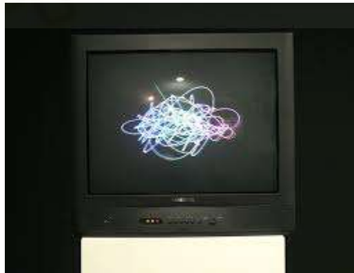
Fig. 05: Nam June Paik - Participation TV , 1963/1998

Amb Participation TV (Fig. 05) Nam June Paik fa a l'espectador interactuar amb la peça per tal d'activar-la i ho fa d'una manera entretinguda i divertida, l'espectador parlant, cantant, cridant o com vulga actuar amb els micros disposats, genera en la pantalla ones de colors això activa la pròpia creativitat de l'espectador i augmenta així l'interés d'aquest per l'obra.