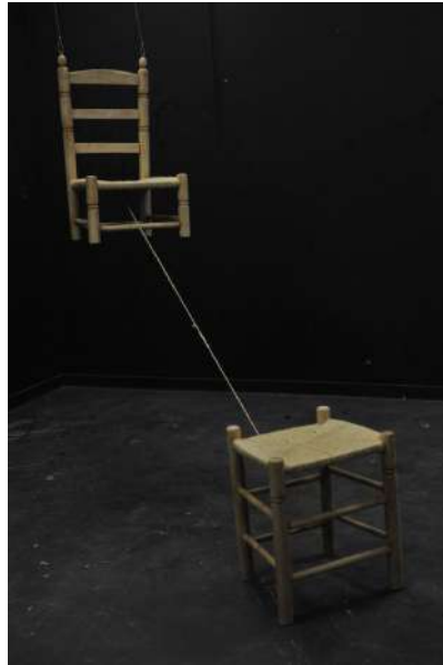
Fig. 06: Josep Oriol Gamir Ordaz, La familia penja d'un fil , 2018/2019 Instal·lació artística, Cadires de fusta, cordill d'aspart i fil de pescar Dimensions variables (escala real humana)

Però com volia parlar d'un dinar popular actual (inicis s.XXI), situat probablement al carrer o algun recinte, les cadires i les taules, primerament de fusta, quedaven fora de context i els exvots no treballaven bé amb el resta de la peça.