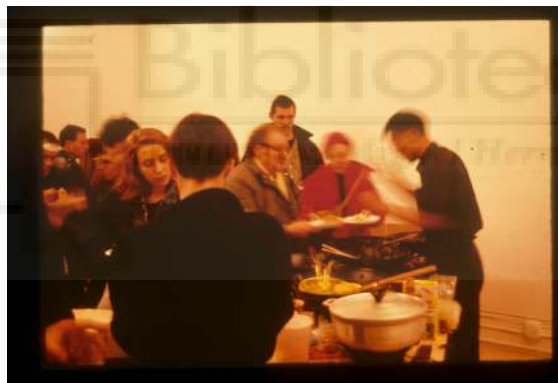
Fig. 01: Rirkrit Tiravanija - untitled 1990 (pad thai) . 1990.

Igual que a l'obra de Tiravanija (Fig 01), on per mitjà del menjar els espectadors passen a formar part de l'obra, aprofitant el dinar per a generar un obra d'eat art on els participants, tan coneguts com desconeguts, comparteixen en un acte relacional espai i taula.