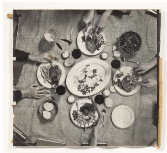
Fig. 03: Daniel Spoerri - Untitled , 1967 Gelatina de plata Moma, New York

Per altra banda, Spoerri sense ser contemporani de l'art relacional, va fer peces (Fig. 03) que captaven l'essència d'aquest corrent artístic, ja que immortalitzava l'escenari creat a la taula on dinava, sol o acompanyat generant així peces d'eat art i mostrant com a la fotografia l'acte de menjar en aquest cas acompanyat.