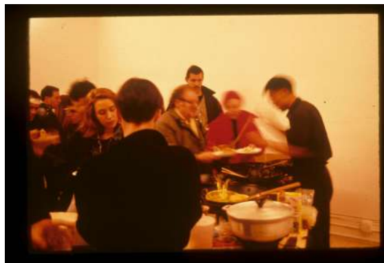
Fig. 01: Rirkrit Tiravanija - untitled 1990 (pad thai) . 1990.

Igual que a l'obra de Tiravanija (Fig 01), on per mitjà del menjar els espectadors passen a formar part de l'obra, aprofitant el dinar per a generar un obra d'eat art on els participants, tan coneguts com desconeguts, comparteixen en un acte relacional espai i taula.