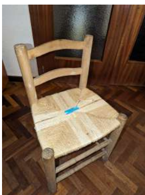
Fig. 08: Cadira de fusta cordada a mà

Amb les respostes rebudes, en format d'àudio, per una petita part de la població a les preguntes formulades per l'alumne en forma d'enquesta per mitjà de l'aplicació de "Whatsapp", es va fer una primera proposta d'instal·lació amb quatre cadires de fusta (Fig. 08) al voltant d'una taula també de fusta i exvots per parlar de les coses que els agradava o no a la gent del poble sobre el poble.