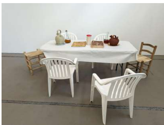
Fig. 09: Josep Oriol Gamir Ordaz - Menjar popular , 2024 Instal·lació artística. Dimensions variables.

Durant el procés, el tema del treball va canviar i això va fer que es deixés d'usar els exvots, però es van mantenir les cadires i la taula, variant el material, en comptes de fusta serien de plàstic, imitant les que es gasten als menjars populars al poble. També s'incorporaren elements com porrons o cànctirs i menjar (Fig. 09).