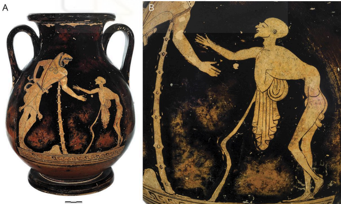
Figura 1. Ejemplo de las manifestaciones clínicas de la poliomielitis en un jarrón del antiguo Egipto. Se observa una marcada deformidad espinal y atrofia muscular en la extremidad izquierda.

Aunque esta enfermedad pandémica se documentó por primera vez en 1887 en Estocolmo (Suecia) (8) , hay controversia sobre la antigüedad de la PM. Las descripciones de sus efectos se remontan al antiguo Egipto, tal y como se evidencia en un jarrón de peliké ático del 480 a. C. (Figura 1A). La figura de Geras en este jarrón muestra una marcada atrofia muscular en las extremidades inferiores y una deformidad espinal cifoescoliótica acentuada (Figura 1B). Clínicamente, se plantea la hipótesis de que estas características anatómicas son compatibles con las de un superviviente de la poliomielitis (SuPM) (9) .