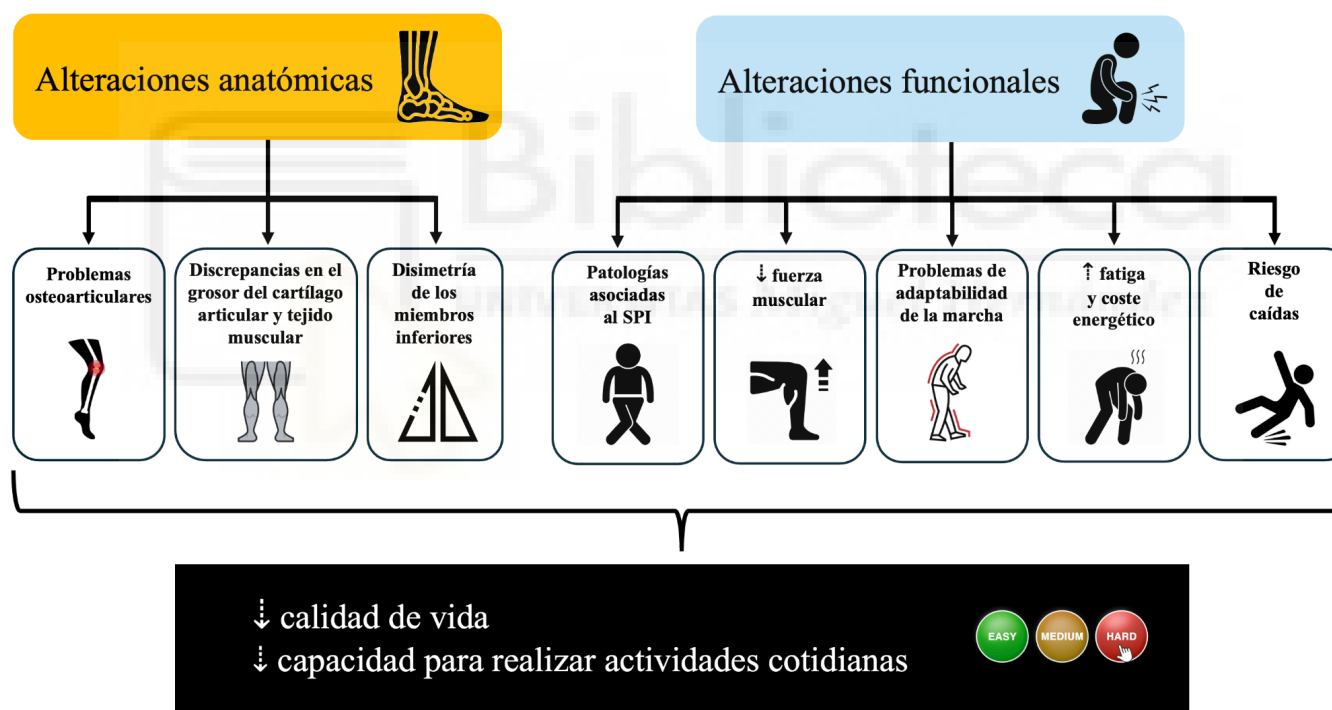
Figura 3. Organigrama de las consecuencias anatómicas y funcionales de la poliomielitis en los MMII, extraídas de los artículos incluidos en este trabajo.

A tenor de los datos recogidos en la tabla precedente, podemos aseverar que para comprender plenamente el impacto de la PM en los individuos afectados, es esencial analizar las diversas alteraciones anatómo-funcionales de la enfermedad. Por ello, en la Figura 3 se representan detalladamente las consecuencias más comunes que hemos extraído de los artículos seleccionados. Esta sinopsis no sólo ilustra las secuelas físicas de la polio, sino que también enfatiza la necesidad de un enfoque integral, holístico, especializado, personalizado y eficaz en la rehabilitación de los SuPM. Asimismo, resalta los aspectos críticos que requieren atención médica y apoyo continuo, los cuales hemos desarrollado en los distintos subapartados de la Discusión.