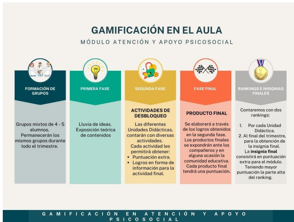
IMAGEN 2. Representación gráfica de la propuesta de intervención en el aula.

Cada unidad didáctica estará formada de las siguientes fases, para la ejecución de la metodología: