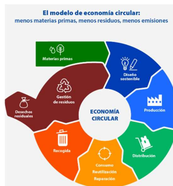
Imagen 1. El modelo de economía circular: menos materias primas, menos residuos, menos emisiones.