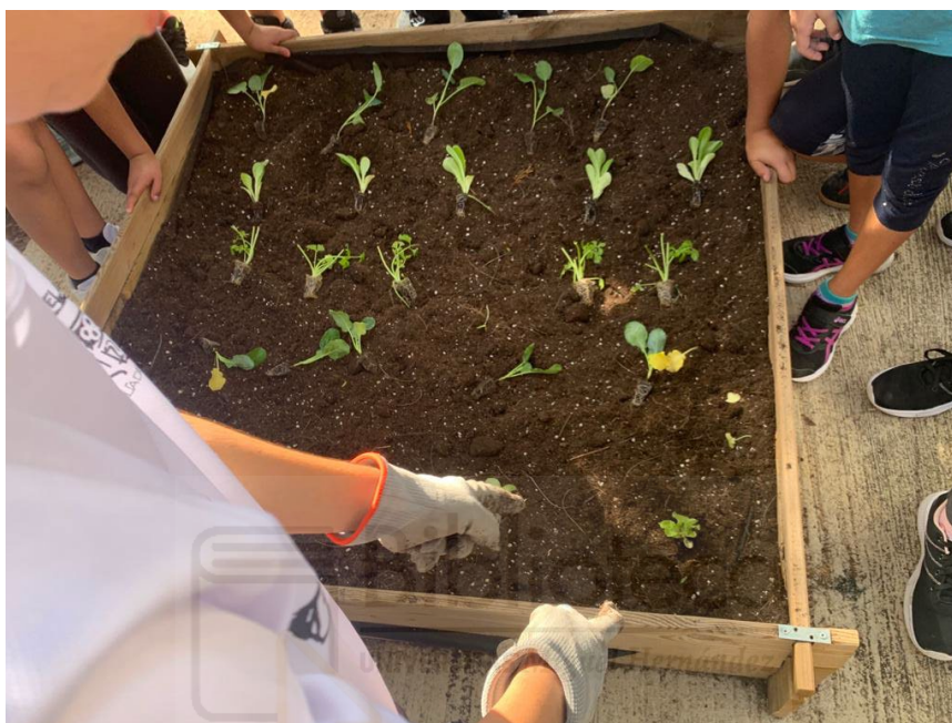
Figura 8. Preparación del suelo y marco de plantación para la siembra en el huerto escolar. UMH Campus de Desamparados EPSO (Orihuela)

De acuerdo con Egea-Fernández et al. (2016) y Melo (2019) se destaca la necesidad formativa respecto al suelo, por tanto, se prestará especial atención a la preparación del terreno en el punto de desarrollo del proyecto, aportando los sustratos, orgánicos e inorgánicos que sean necesarios, en línea con las plantaciones y variedades que vayan a desarrollarse en el HE.