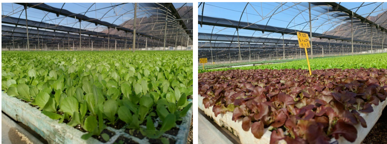
Figura 10. Semilleros con plántulas. UMH Campus de Desamparados EPSO (Orihuela)

En los HE, puede ser justificable cultivar durante épocas en las que la producción máxima no se alcance, pero las plantas crezcan adecuadamente y puedan ser cosechadas, aunque no logren todo su potencial. Además, en entornos urbanos donde se encuentran la mayoría de los centros escolares, las temperaturas tienden a ser menos frías que en áreas rurales o agrícolas, lo que permite cierta flexibilidad en el adelanto o retraso de algunos cultivos.