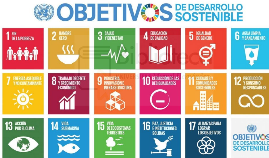
Figura 12. Objetivos de Desarrollo Sostenible ODS.

Los HE ofrecen un entorno privilegiado para explorar la relación entre el ser humano y el planeta en un espacio natural reducido que refleja la biodiversidad terrestre. Este reflejo de hábitos y medidas necesarias para alcanzar los Objetivos de Desarrollo Sostenible (ODS) nos brinda la oportunidad de adquirir estos conocimientos desde la infancia y trabajar hacia su consecución. Según afirman Barrón y Muñoz (2015) los HE comunitarios actúan como agentes de una educación comprometida con la sostenibilidad.