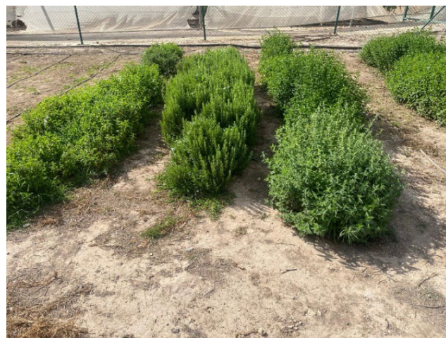
Figura 4. Zonas de verduras y plantas aromáticas. Huerto Escolar UMH. Campus de Desamparados EPSO (Orihuela)