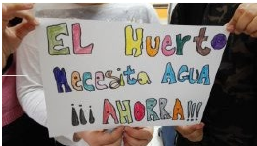
Figura 9. “El Huerto Necesita Agua ¡¡¡Ahora!!!”

abastecimiento hídrico a lo largo de diferentes períodos y estaciones del año, adaptándose a las necesidades del proyecto.