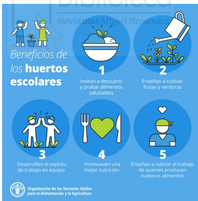
Figura 2. Beneficios de los huertos escolares.

En este apartado, abordaremos de manera concisa los aspectos esenciales que deben considerarse para el diseño y construcción de un HE desde la perspectiva de la planificación y organización del proyecto integral.