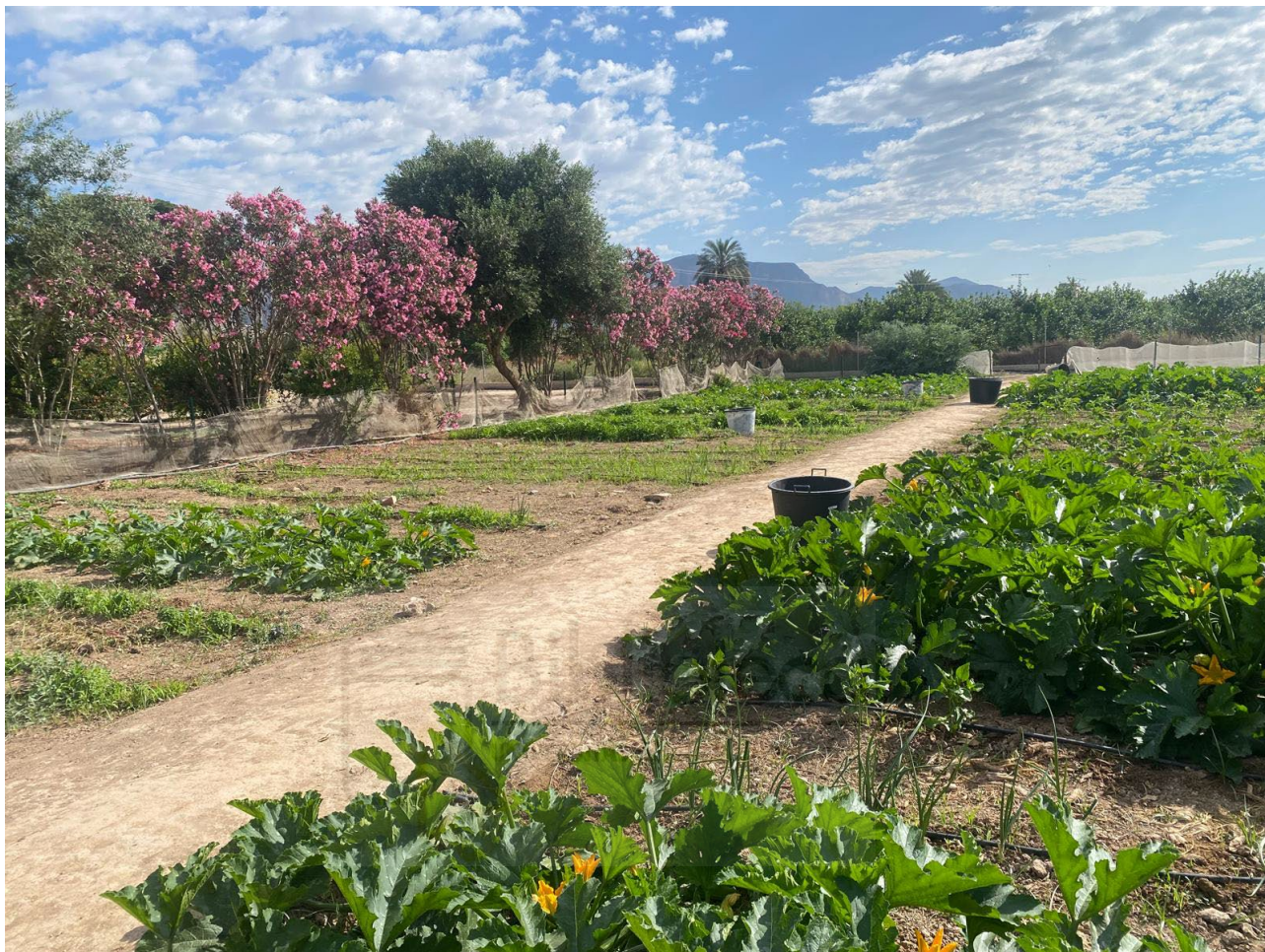
Figura 3. Huerto Escolar UMH. Campus de Desamparados. Escuela Politécnica Superior de Orihuela (EPSO)