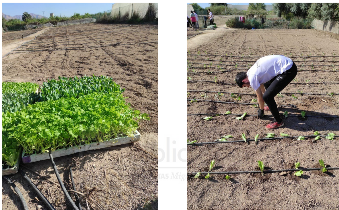
Figura 7. Bandeja de plántulas preparadas para el trasplante. Labores de trasplantado en el huerto escolar de la UMH. Campus de Desamparados EPSO (Orihuela)

En la zona geográfica del levante, con un clima que obedece a un patrón típicamente mediterráneo, la orientación Norte-Sur (N-S) es la que proporciona una radiación solar homogénea en períodos más fríos. Por otra parte, las plantaciones del HE recibirán de forma directa el mayor grado de radiación.