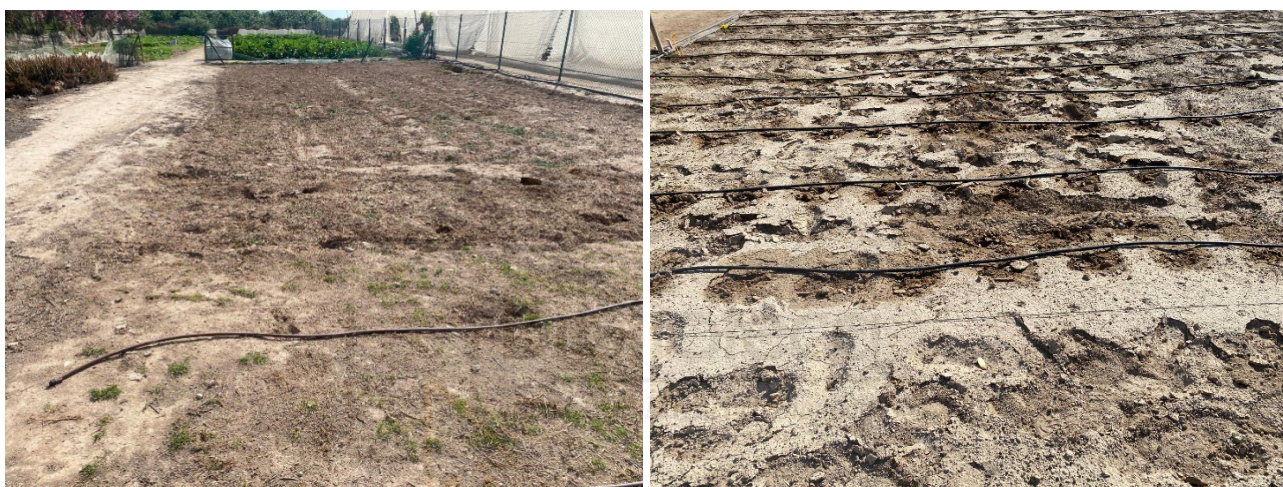
Figura 6. Preparación del terreno y riego por goteo. Huerto Escolar UMH. Campus de Desamparados EPSO (Orihuela)

La localización y construcción del HE es un paso fundamental, que va a influir de una manera determinante en su evolución y desarrollo. La elección del espacio adecuado implica considerar la disponibilidad de terreno y la posibilidad de adaptarlo para su uso como huerto. Se pueden acondicionar parcelas o instalar jardineras que permitan una rotación eficiente de cultivos, maximizando el espacio disponible y fomentando la biodiversidad. La distribución modular propuesta incluirá áreas dedicadas a cultivos de hortalizas, árboles frutales, plantas medicinales y flores polinizadoras. Además, se contemplará la integración de zonas de descanso y áreas para actividades al aire libre.