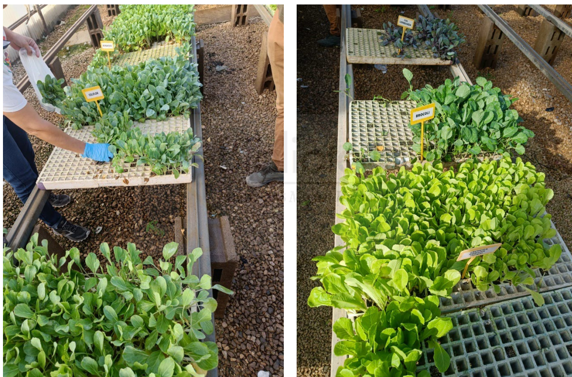
Figura 11. Adquisición de habilidades prácticas en el huerto escolar de la UMH. Campus de Desamparados EPSO (Orihuela)

Para el desarrollo de competencias, es esencial dinamizar actividades participativas que involucren activamente al alumnado, lo que implica planificar actividades rotativas en el HE durante cada sesión. Se sugiere distribuir al alumnado en grupos de trabajo diversos en edad, habilidades y conocimientos para fomentar la interacción y el aprendizaje entre pares.