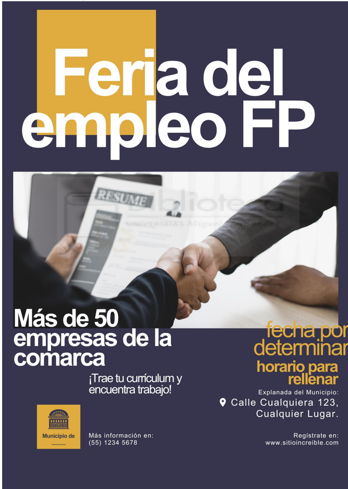
Cartel feria de empleo