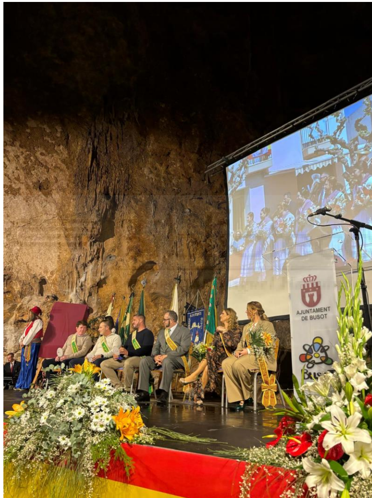
Presentación de capitanías 2024 en las Cuevas del Canelobre