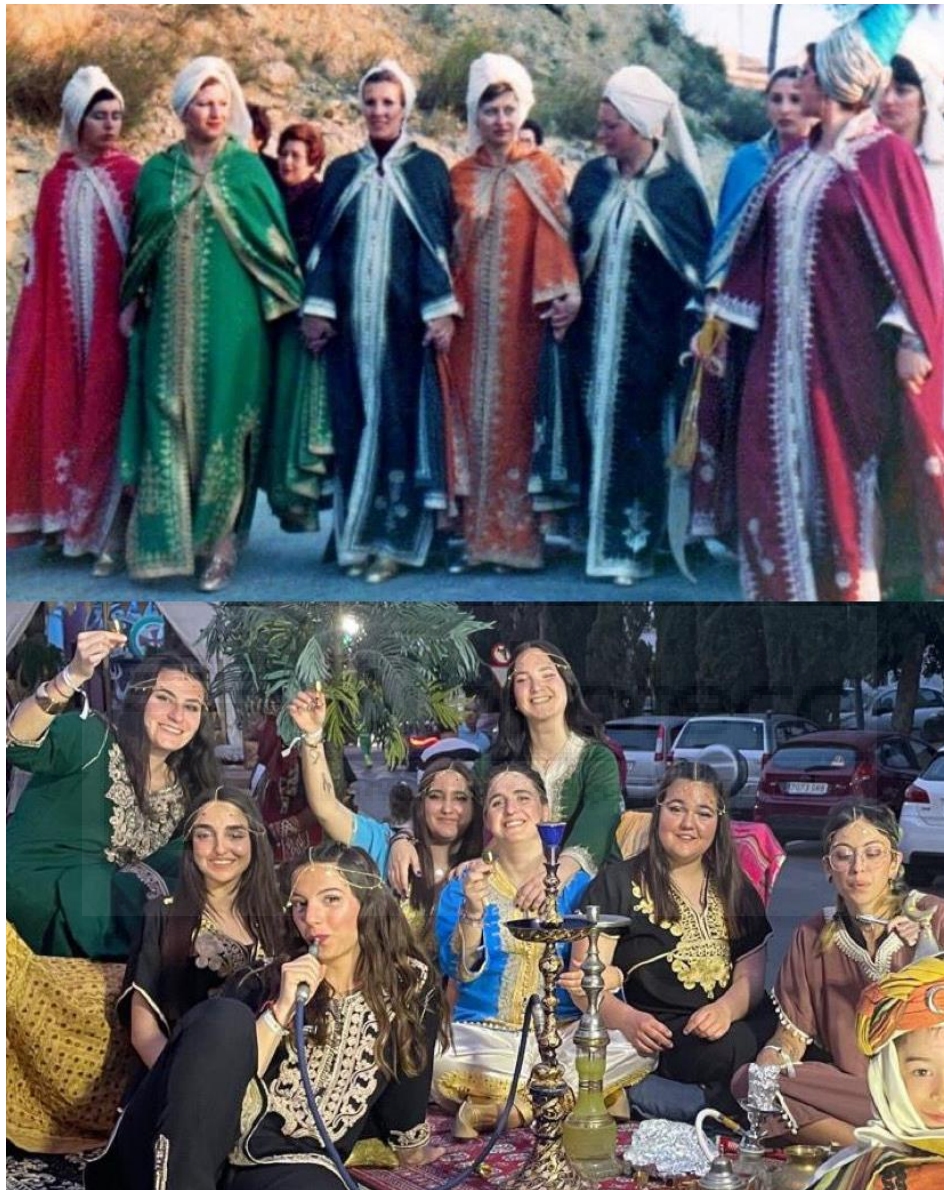
Arriba, escuadra de mujeres festeras en 1985. Abajo, sus nietas con las mismas xilabas en 2024 | Vanessa Giner

ayudando a garantizar que las tradiciones sigan siendo relevantes y significativas para las generaciones futuras.