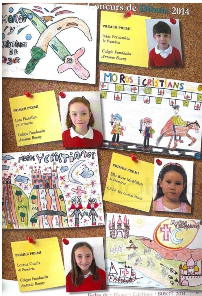
Extracto del llibret de festes de Busot de 2014

Otro ejemplo de actividad que incluye a los niños en las fiestas es el concurso de dibujos. Los más pequeños pueden enviar su dibujo a la Comisión, relacionado con las fiestas de Moros y Cristianos. Los ganadores son publicados en el llibret de festes .