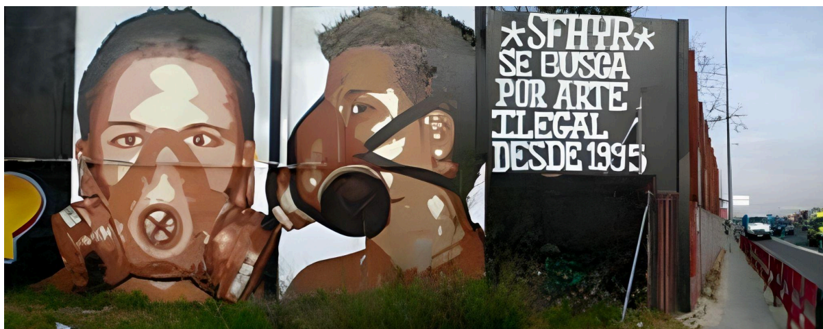
Fig.3. Sin título. Sfhir. 1995. Autorretrato del autor con mensaje irónico y reivindicativo.

Aunque los beneficios del arte urbano en la educación son numerosos, su integración en el currículo presenta varios desafíos. Entre ellos se encuentran la percepción negativa del graffiti como vandalismo y la falta de recursos y formación para los docentes. Es crucial abordar estos desafíos mediante la sensibilización y la formación adecuada de los educadores (Luis_GRAFF_expresiones, 2015).