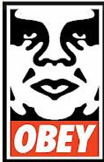
Fig.1. OBEY. Shepard Fairey. 2023 (Plantilla para usar con aerosol)

En la actualidad, el arte del stencil, impulsado en particular por la gran popularidad y visibilidad de Banksy, es una de las formas que mejor representa el concepto de street art, aunque se trate de una técnica que en origen se utilizaba para fines distintos de los artísticos. (Ayuntamiento de Fuendetodos, 2022)