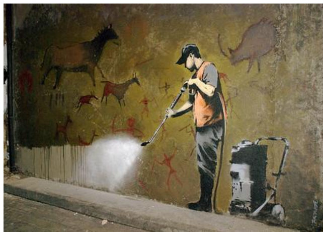
Fig.5. Cave Painting Removal. Banksy. 2008. (Graffiti que muestra a un trabajador público limpiando el propio graffiti)

Sin embargo, también existen reticencias debido a la asociación del graffiti con el vandalismo. Luis_GRAFF_expresiones, (2015) menciona que algunos educadores y equipos de dirección dudan en adoptar el graffiti debido a preocupaciones sobre el control y la legalidad. Superar estas reticencias requiere esfuerzos de sensibilización y formación para educadores sobre los beneficios y métodos adecuados de implementación del arte urbano en la educación.