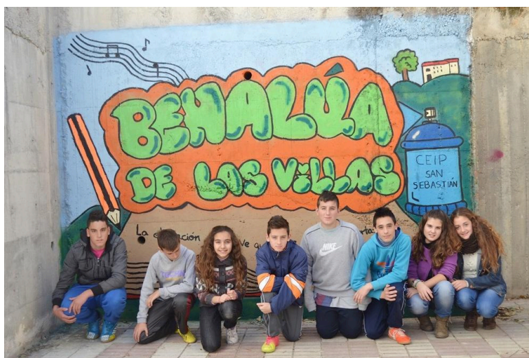
Fig.2. Alumnos del CEIP San Sebastián con el mural estilo graffiti creado por ellos. 2018