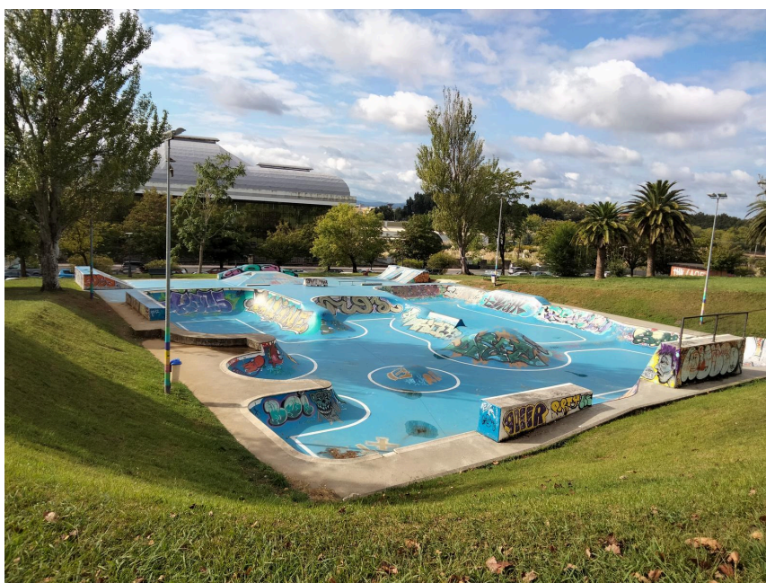
Fig.1. Skatepark Parque de la Vaca, Santander