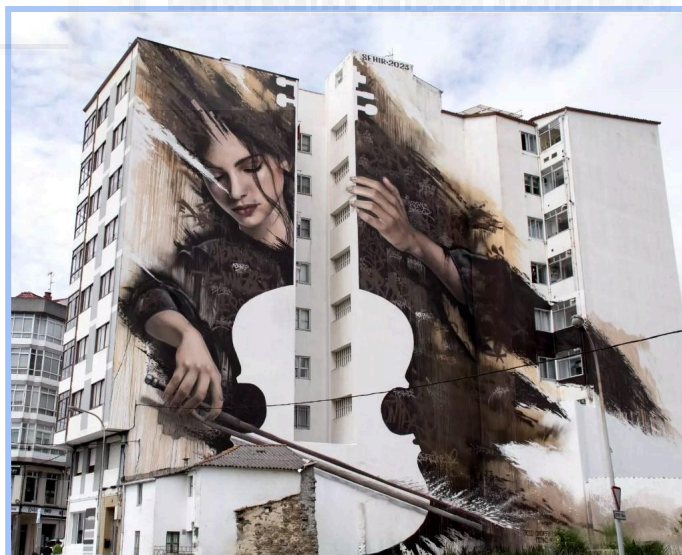
Fig.1. La violonchelista. Sfir. 2023 (Mejor graffiti del mundo 2023)

En España, entre otros grandes grafiteros, tenemos a Sfir. Ostenta título de mejor graffiti del mundo en 2023 con su obra La Violonchelista, ubicada en la localidad de Fene, Galicia.