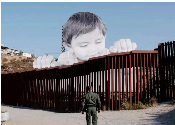
Fig.1. Kikito. JR. 2017. (Fotografía de un niño asomándose a territorio de EEUU desde México)

JR, un fotógrafo y artista francés, es conocido por sus gigantescos retratos en blanco y negro que adornan edificios y estructuras urbanas alrededor del mundo.