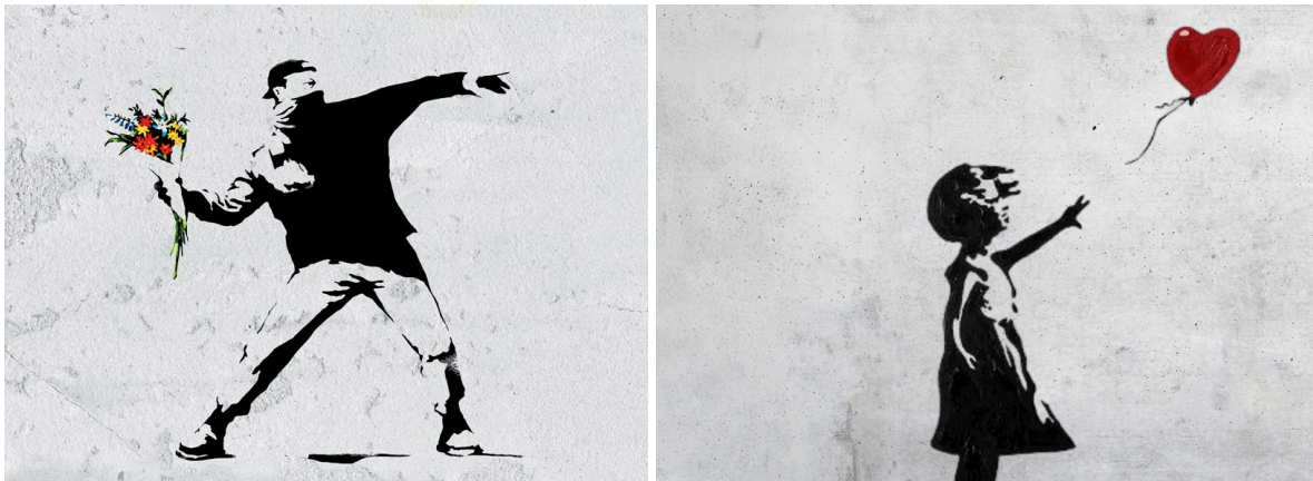
Fig. 2.(Izquierda) Flower thrower. Banksy. (s.f.) Fig.3.(Derecha) Girl with Balloon. 2002. Banksy. (ambas con técnica de plantilla)

Uno de los artistas más conocidos en el arte urbano es Banksy. Conocido por sus stencils cargados de mensajes políticos y sociales que desafían las convenciones.