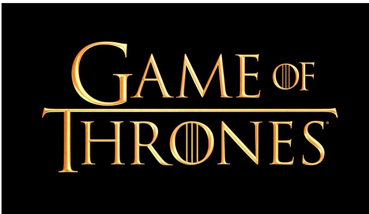
Figura 5: Logo oficial de la serie Juego de Tronos.

Juego de Tronos es la serie con más éxito, no solo de la plataforma, si no de todas las series originales creadas por una plataforma streaming .