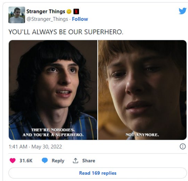
Figura 3: Captura del tuit de la cuenta @Stranger_Things.

ellos familia, sobre todo entre personas que no han tenido lazos familiares anteriores o una relación negativa con su familia de sangre.