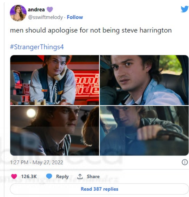
Figura 4: Captura del tuit de la cuenta @sswiftmelody.

Con respecto a los protagonistas masculinos, también encontramos a unos personajes que han evolucionado mucho desde ese personaje clásico al que solo se le permite ser fuerte y no mostrar sus emociones. Vemos a unos personajes con más profundidad emocional a los cuales se les permite mostrar sus sentimientos y ser vulnerables, pero que no dejan de ser fuertes. Esto también ha tenido un impacto muy positivo en las audiencias, sobre todo en las más jóvenes.