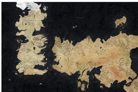
Figura 6: Mapa de Poniente y Essos de la serie Juego de Tronos.

Uno de los aspectos que más caracteriza y atrae a los espectadores es la complejidad del mundo creado por George RR Martin. Martin comenzó a desarrollar el mundo de Juego de Tronos en 1991, y durante cinco años perfiló el mapa que conforma el mundo de Poniente, los Siete Reinos, el Muro, Essos, las tierras Dothraki, etc.