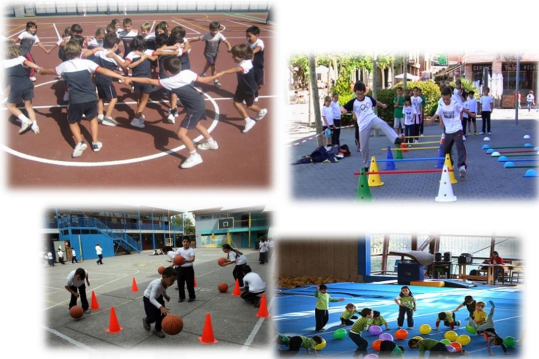
Figura 2. Imágenes representativas de la Educación Física actual

Es bajo esta contextualización del nuevo sistema educativo, bajo la que el juego debe tener un peso importante como herramienta para fomentar una educación en valores que ya la derogada LOGSE propugnaba (educación ambiental, educación para la salud, para el consumidor, para la igualdad de sexos, para la paz, las nuevas tecnologías y el civismo) y que el resto de leyes educativas han seguido incentivando mediante el desarrollo competencial (LOE) y los elementos transversales (LOMCE), tales como: la comprensión lectora, la expresión oral y escrita, la comunicación audiovisual, las Tecnologías de la Información y la Comunicación, el emprendimiento y la educación cívica y constitucional, la igualdad efectiva entre hombres y mujeres, la actividad física y la dieta equilibrada y la educación en seguridad vial. Este tratamiento competencial y transversal va a propiciar el trabajo interdisciplinar, aspecto por el que las dos leyes vigentes en nuestro país en el presente curso lectivo abogan mediante la realización y puesta en práctica de proyectos interdisciplinares .