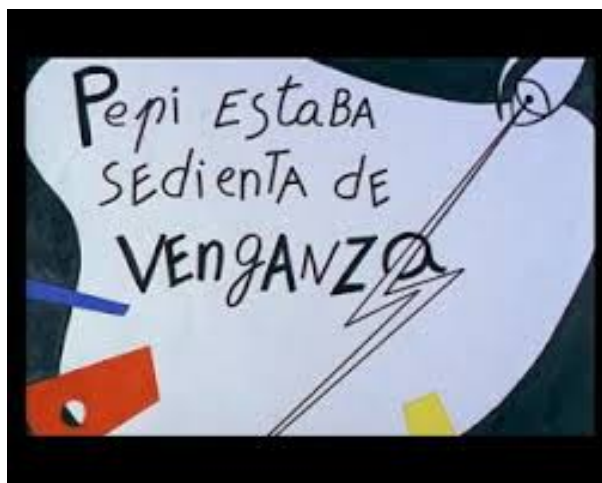
Figura 5. Créditos de Pepi, Luci, Bom y otras chicas del montón 1980

En el ámbito estético, el Pop-Art y Kitsch son las referencias artísticas que predominan en la obra de Pedro Almodóvar características propias de La Movida. Como el mismo director dijo para la revista El Cultural, su primera influencia fue Andy Warhol.