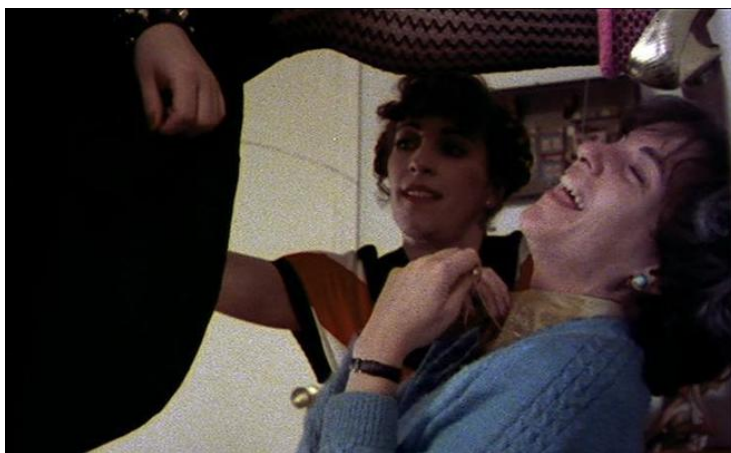
Figura 1. Imagen extraída de Pepi, Luci, Bom y otras chicas del montón 1980

uno de los temas que Almodóvar rescata de la censura y al que recurre en muchas ocasiones. Estas imágenes con intención de provocar al público con temas tan novedosos tratados de forma que puede parecer grotesca, sirven para manifestar una libertad que parecía perdida.