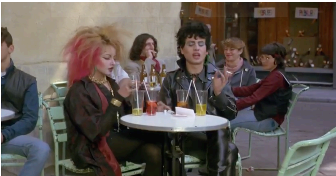
Figura 10. Imagen extraída de la película Laberinto de pasiones 1982

En cuanto al vestuario de los personajes varía dependiendo de la escena que se nos presenta. Predomina el estilo rockero con cazadoras de cuero, colores llamativos, cabellos cardados y teñidos con diferentes tonos y pendientes de plástico. Por otra parte, aparecen por primera vez personajes masculinos maquillados. Los diseñadores más destacados de la película son Carlos García Berlanga (Madrid, 1959 - 2002) y Ouka Leele (Madrid, 1957).