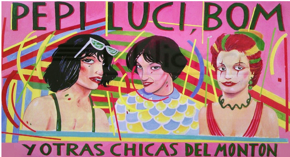
Figura 4. Créditos Pepi, Luci, Bom y otras chicas del montón 1980