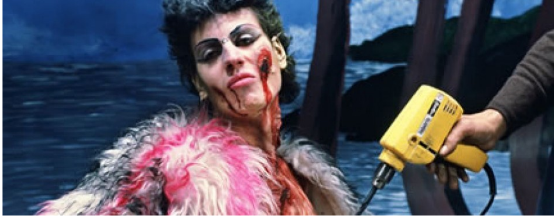
Figura 11. Imagen extraída de la película Laberinto de pasiones 1982

El lenguaje utilizado en esta segunda obra, comparte la misma filosofía underground que hemos visto en Pepi, Luci, Bom y otras chicas del montón y que integra en sus obras. Dependiendo del contexto en el que se encuentre la escena el lenguaje cambia pero siguiendo una línea “de la calle”. Aun así el lenguaje de esta nueva película es mucho más cuidado en comparación con la primera.