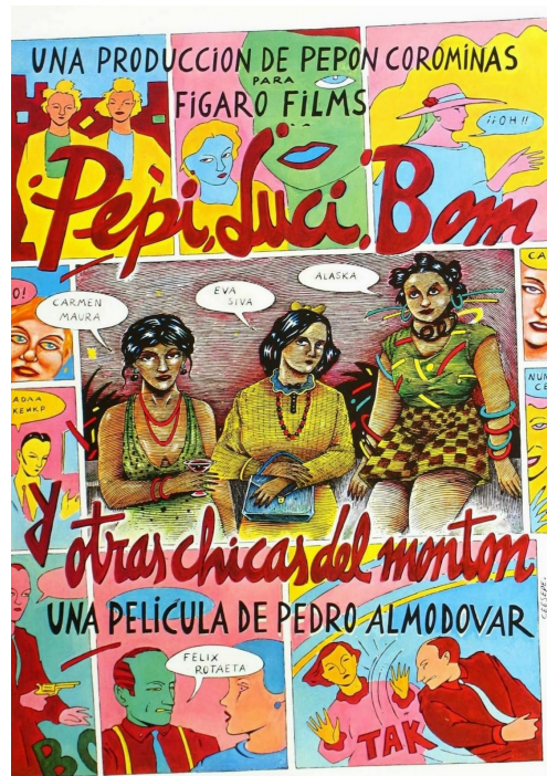
Figura 6. Cartel de Pepi, Luci, Bom y otras chicas del montón 1980

En el vestuario podemos ver una clara relación directa entre La Movida Madrileña y las tres protagonistas de la película. Bom, personaje que representa la ideología punk del movimiento, viste con una estética muy punk rockera, usa chaquetas de cuero, lentejuelas, y estampados animal print con colores chirriantes (rojos y verdes), muy frecuentes del estilismo juvenil del momento. Además también llevan muchos accesorios de plástico de colores múltiples como collares, pulseras y pendientes. En contraposición tenemos a Luci que lleva un look más conservador común de la dictadura. En el caso de Pepi, eligió y compró a su gusto para la película un vestido del diseñador Francis Montesinos (Valencia, 1950) que vio en una tienda muy famosa en aquel momento en Madrid. Tanto en la película como en la vida real, el vestuario sirvió para expresar la libertad del momento.