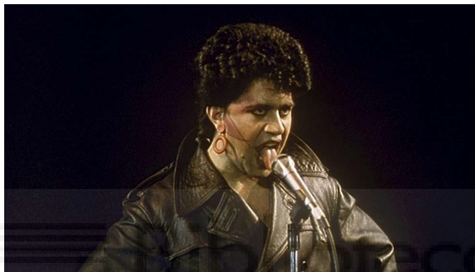
Figura 8. Imagen extraída de la película Laberinto de Pasiones 1982

Otra vez Almodóvar nos presenta unos personajes extremos y alocados pero desde un punto de vista cotidiano. Además, vuelve a darle más importancia a los personajes femeninos siendo los personajes mejor definidos. En cuanto a los personajes encontramos una mejora en comparación con su película precedente. Presentan una psicología mucho más profunda, conseguimos saber más de ellos. Lo cual hace del filme una película con mejor contenido. Todos los actores que intervienen en el rodaje son personas jóvenes con todo un futuro por delante y que reflejan perfectamente lo que sucedía en Madrid en esos años.