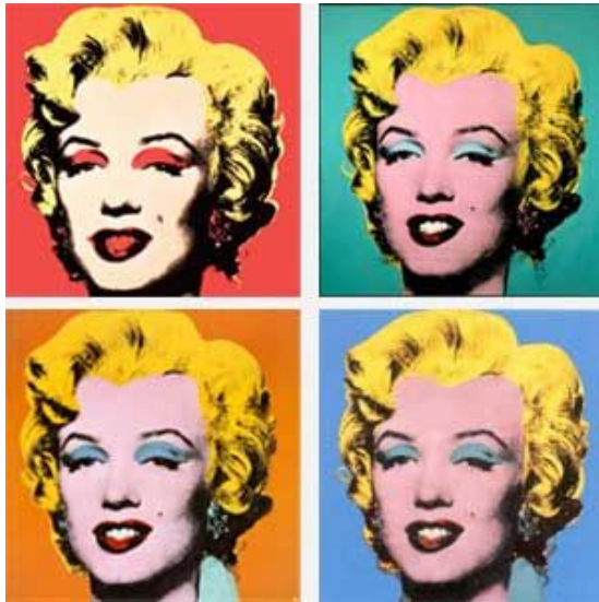
Figura 3. Shot Marilyns de Andy Warhol 1964