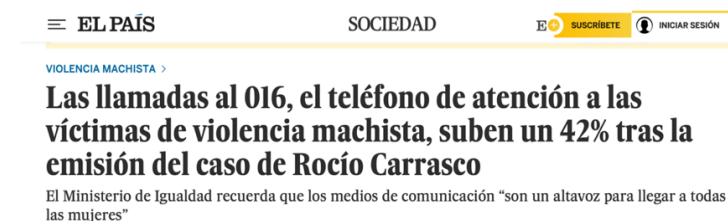
El País, marzo 2021

Estos datos muestran una situación real además de demostrar la influencia que tienen los medios de comunicación. El discurso de los medios y sus representaciones