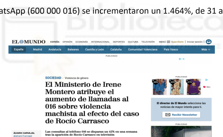
El Mundo, marzo 2021

El caso Rocío Carrasco se estrenó públicamente el día 21 de marzo de 2021. A fecha 28 de marzo de 2021, en la semana del 22 al 28 de marzo, semana que se estrenó el documental, según el Ministerio de Igualdad, las consultas al 016 subieron un 41,9% con respecto a la semana anterior, pasando de 1.458 a 2.069. Además, las consultas al correo electrónico 0016-online@igualdad.gob.es aumentaron un 384%, de 19 a 92. A través del WhatsApp (600 000 016) se incrementaron un 1.464%, de 31 a 485.