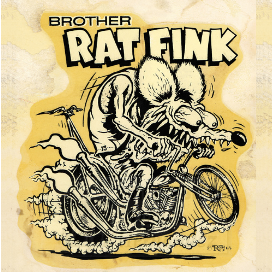
Ilustración de Ed Roth para posibles estampas.