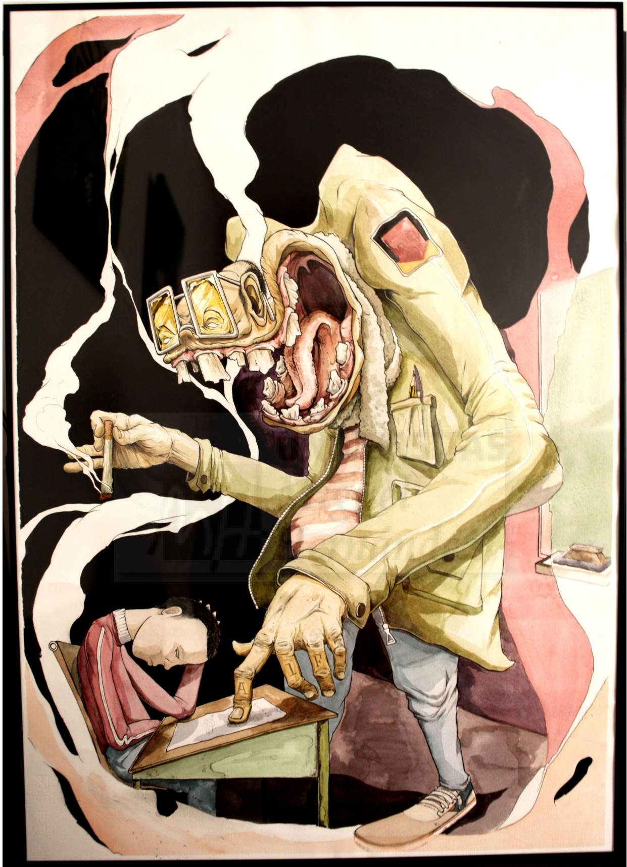
Educación. Acuarela sobre papel Ingres. 100 x 70cm.