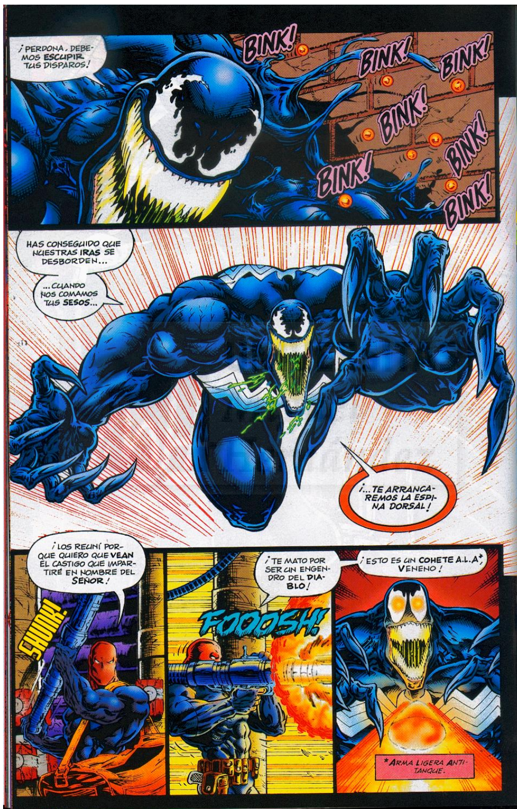
Fragmento de un cómic de Venom.