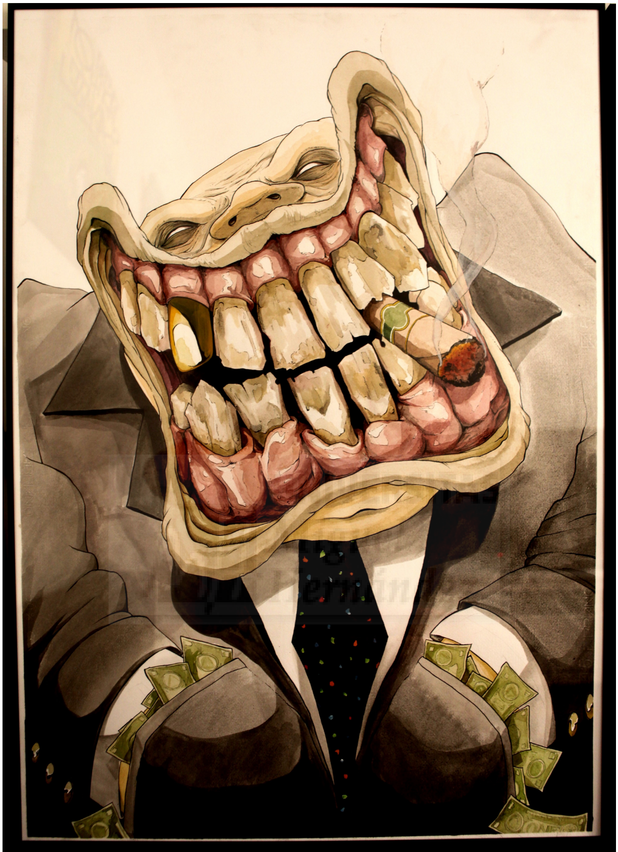
Política. Acuarela sobre papel Ingres. 100 x 70cm