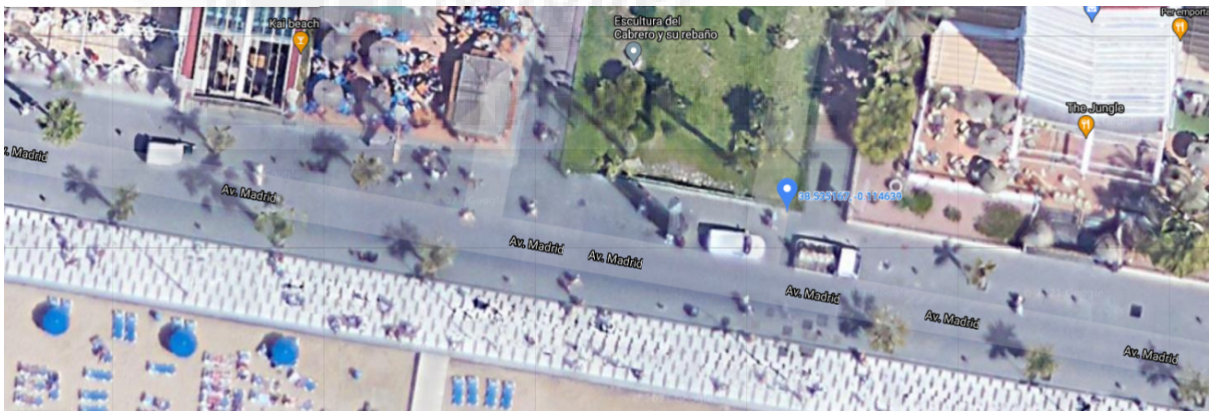
Figura 12. Localización del cartel elegido.