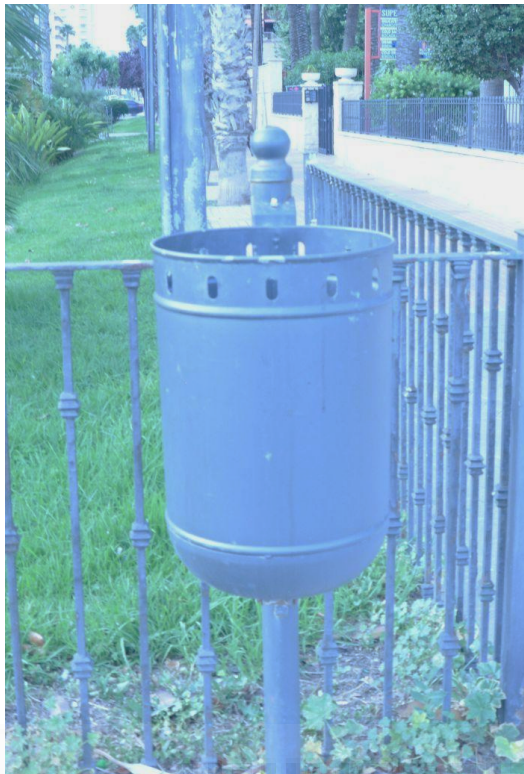
Figura 11. Semanas después de la colocación de los carteles.