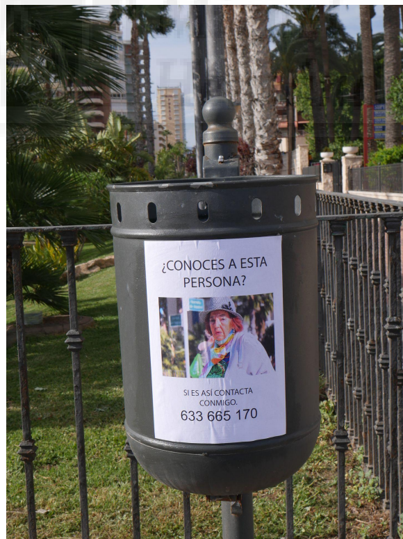
Figura 10. Día de la colocación de los carteles.