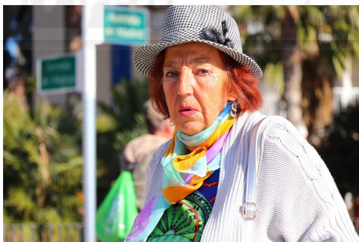
Figura 8. Fotografía realizada en el 2018.

Es posible una trayectoria en el tiempo de esta línea de investigación conceptualmente, siendo la parte procedimental la cambiante.