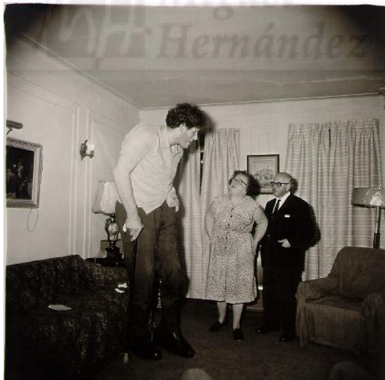
Figura 3. Diane Arbus. Jewish Giant at Home with His Parents in The Bronx, NY (1970).

Destacamos el trabajo de la fotógrafa estadounidense Diane Arbus (1923-1971) por su trabajo dedicado a los freaks (Figura 3), una serie de fotografías en blanco y negro con una mirada directa y dando un giro de roles donde lo “normal” pasa a ser algo monstruoso y viceversa; de manera que combina y auna tensión y fuerza en una misma imagen.