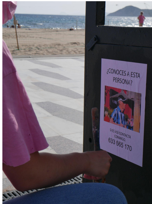
Figura 6. Carteles en papeleras.