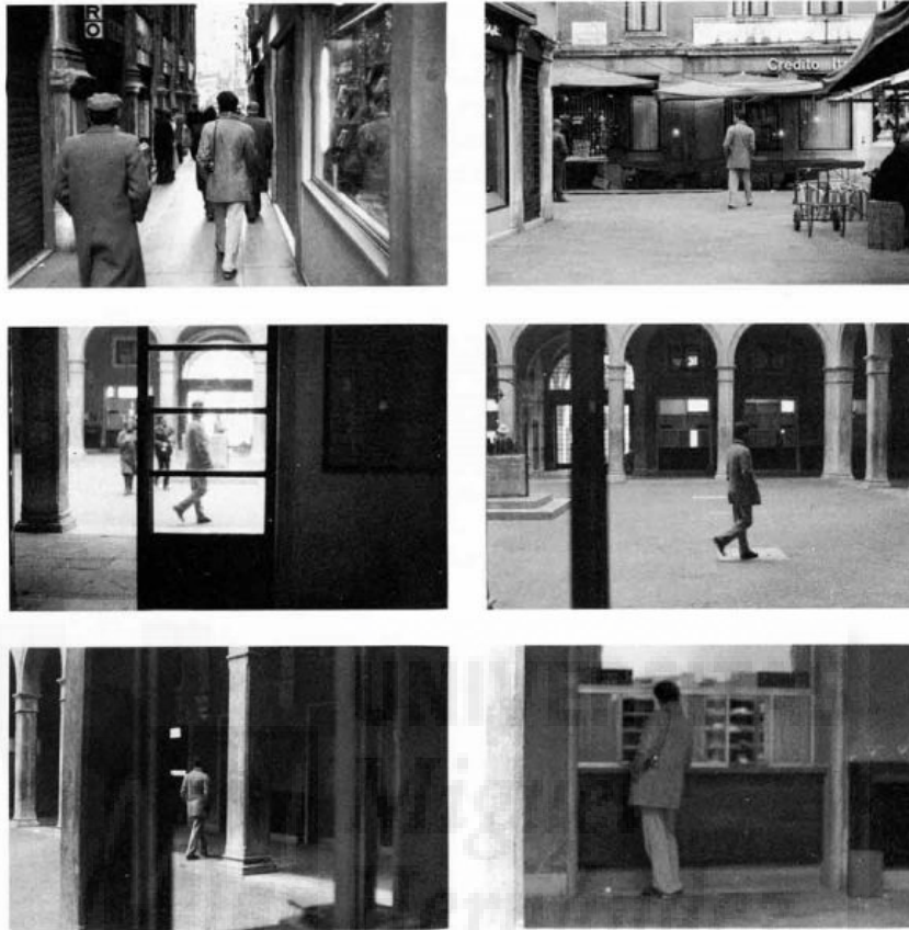
Figura 4. Sophie Calle. Suite vénitienne , 1981.

Como cuarta y última referencia hemos escogido la obra titulada Suite vénitienne (Figura 4) de la artista parisina Sophie Calle (1953); este trabajo se basa en una serie de fotografías robadas que realiza a un desconocido siguiéndolo desde París hasta Venecia, visitando los mismos lugares que este y tomando las mismas fotografías que él.