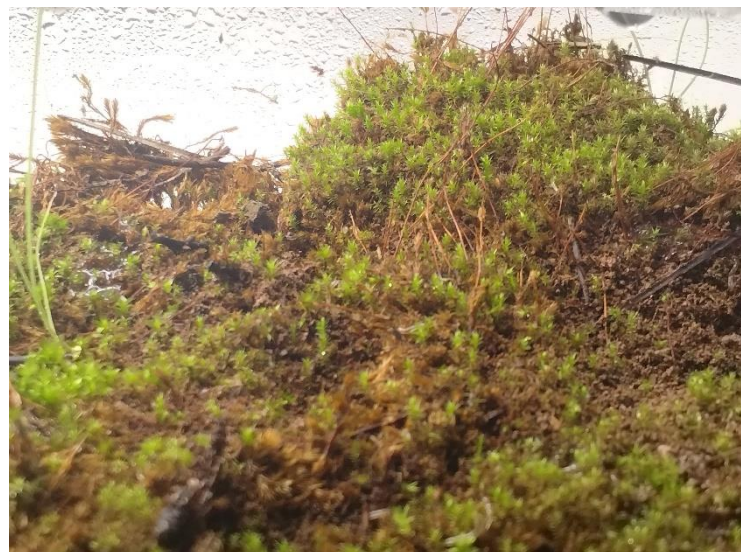
Figura 7. día treinta