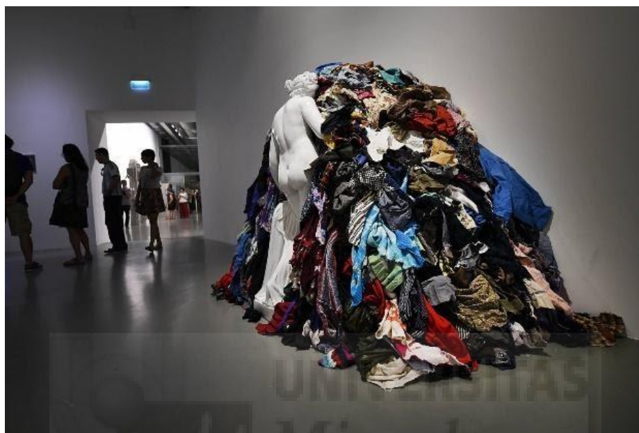
figura 3. ``Venus of the rags`` Michaelangelo Pistoletto (1967) Marmol y textiles (212cm x 340cm x 110cm)

De la obra ``Venus of the rags`` de Pistoletto (figura 3), cabe destacar el hecho de la yuxtaposición de los ``trapos`` frente a la venus como obra pico de la cultura clásica en lo que a belleza se refiere; de esta obra extraigo en parte mi interés por integrar visualmente la basura y el musgo en una sola instalación, para la cual me apoyo en la estructura visual.