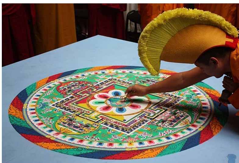
Figura 4. Detalle del proceso de un Mandala tibetano (2010 circa) Pigmento en polvo (100cm x 100cm) circa

En un mandala prima siempre la parte procesual como vehículo de la experiencia meditativa sobre el resultado o la durabilidad del propio mandala (Figura 4) ya que los cuales se destruyen al acabar despues del pertinente ritual, me inspiro en la ligereza con la que se destruyen y la falta de apego a la obra como forma de dar importancia al proceso y disfrutarlo como un ejercicio de crecimiento personal.