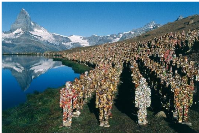
Figura 2. "The trash army" H.A.Schult. (Los Alpes, 2003) Instalación, técnica mixta, medidas variables

Otro es "Trash Army" de H.A.Schult (figura 2), en el cual el artista opta por dar forma humana a un ejército de basura para poner en evidencia la cultura enferma de la sociedad del desecho, visualiza este problema haciendo viajar al ejército de esculturas por todo el mundo como una amenaza visual al medio en el que las instala.