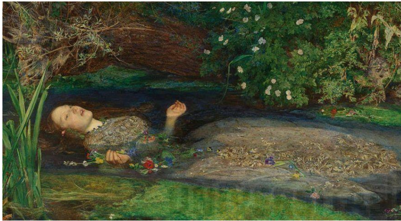
Figura 1. "Ophelia" John Everett Millais (1851/52, Detalle) Óleo sobre lienzo (76.2cm x 111.8cm)

La obra se inspira en una serie de referentes visuales. La pintura "Ophelia" de John Everett Millais (figura 1), guía los primeros bocetos de mi obra, en el cual se aprecia a una joven Ofelia inmersa en la naturaleza acuática, ya en las primeras fases me decanté por integrar la figura humana en el verdor de la vegetación, como a través de las valoraciones tonales consigue John Everett en éste cuadro.