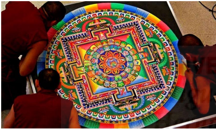
Figura 5. Detalle del proceso de un Mandala tibetano

Cosmos que percibe uno mismo al pasear descalzo por el monte; ambas experiencias son también algo efímero que deja de existir una vez se acaba, pero no por ello carentes de sentido. Por esta razón, decido inspirarme en la estructura visual del mandala aun simplificándola.