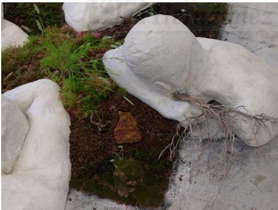
figura 19. "ReVertido", Aarón Martínez (2021), Yeso, basura y musgo, (Medidas variables)