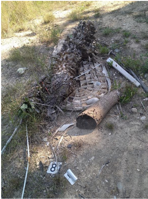
Figura 8. basura dispersa en medio del monte.

Tras empezar a reproducir el musgo se hicieron las primeras intervenciones para la recolección de basura en las inmediaciones de Altea, estas se hicieron en la medida de lo posible a pie, las cuales concluyeron el conteo con aproximadamente cincuenta kilogramos de basura recolectada, documentación gráfica abajo.