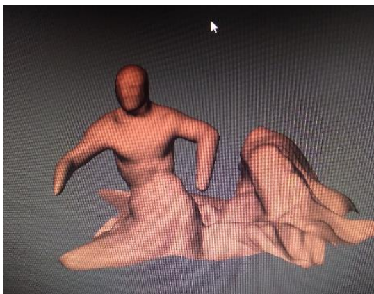
figura 9, Boceto realizado en 3d digital (2021)

Tras las intervenciones se seleccionaron desechos en base al color e índole y los elementos descartados fueron dispuestos para su reciclado en los pertinentes contenedores, ya con el periodo de intervenciones finalizado se procedió a la realización de bocetos para la instalación, en muy diferentes formatos.