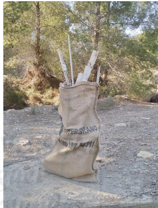
Figura 9. aquí uno de los sacos de yute ya llenos.

Tras las intervenciones se seleccionaron desechos en base al color e índole y los elementos descartados fueron dispuestos para su reciclado en los pertinentes contenedores, ya con el periodo de intervenciones finalizado se procedió a la realización de bocetos para la instalación, en muy diferentes formatos.