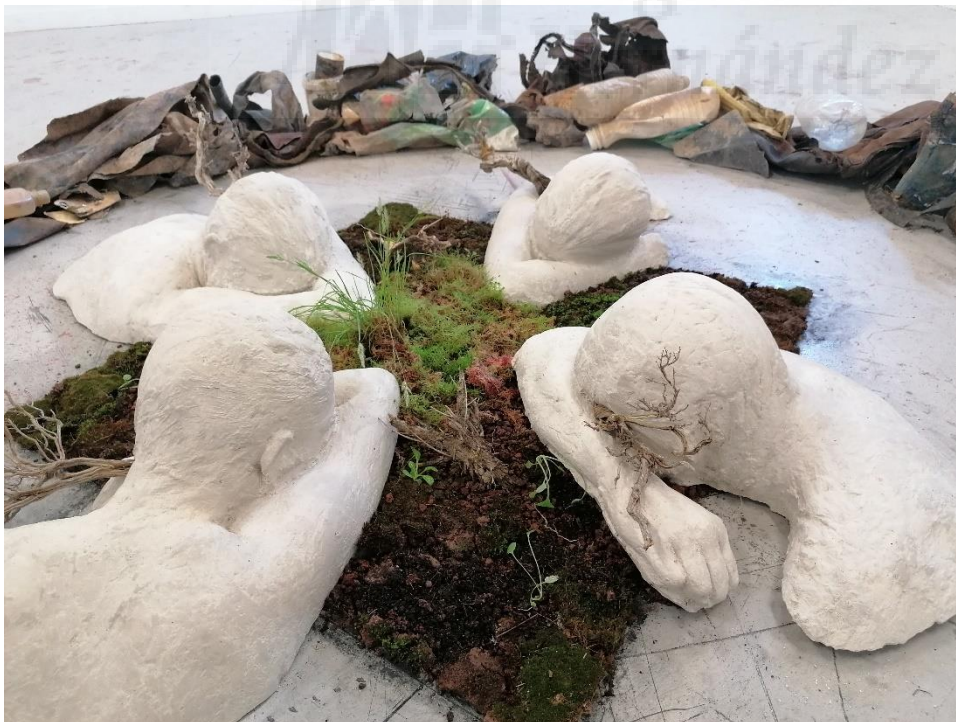
figura 17. ``ReVertido'', Aarón Martínez (2021), Yeso, basura y musgo, (Medidas variables)

Aquí muestro el resultado de la instalación final en imágenes: