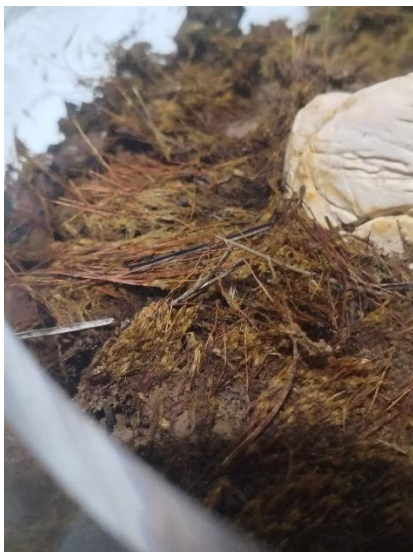
Figura 6. día uno