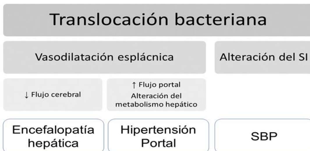
Figura 2. Complicaciones clínicas derivadas de la translocación bacteriana. SBP= spontaneous bacterial peritonitis; SI= Sistema inmunitario