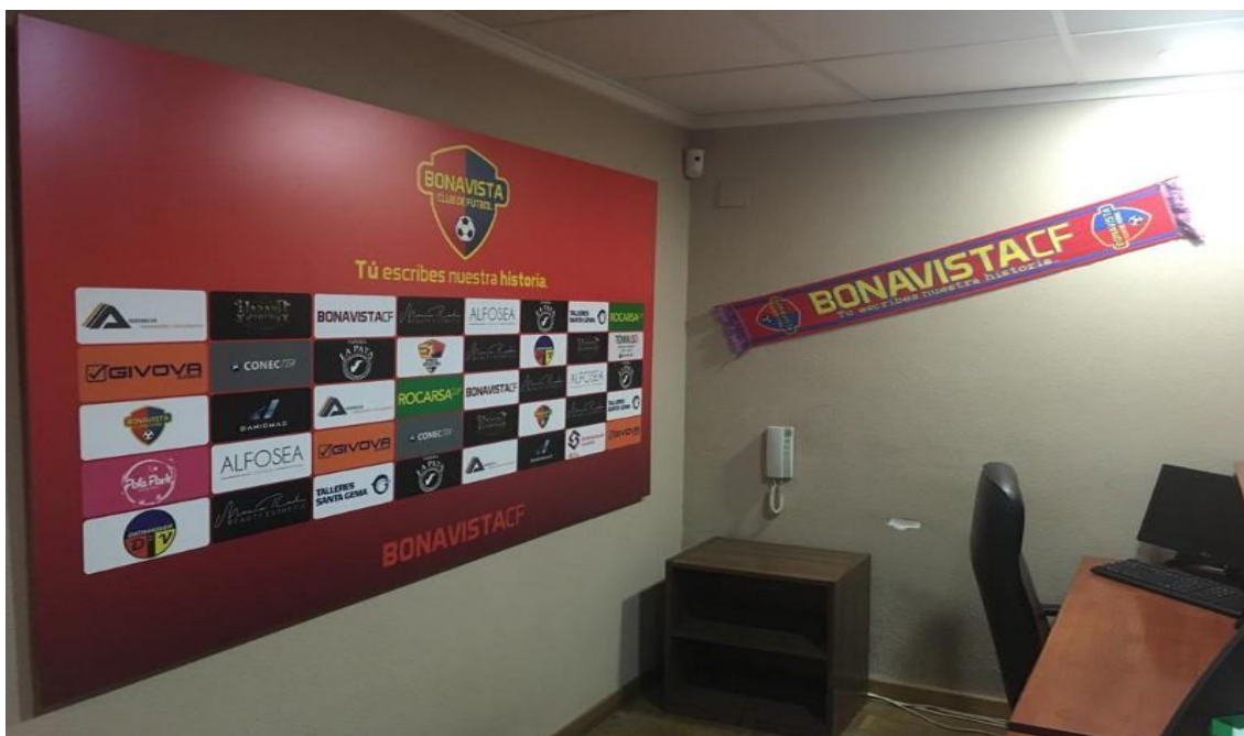
Bonavista C.F sabe de la importancia de los patrocinadores para crecer | Alejandro Cano