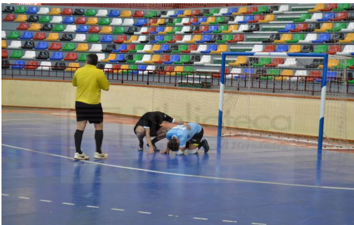
Un deporte con mucho potencial que se encuentra mermado en Elche | Alejandro Cano

La falta de visibilidad por parte de los medios de comunicación y una cuestionada organización del Ayuntamiento hacen que esta modalidad deportiva no alcance su máximo nivel en la ciudad