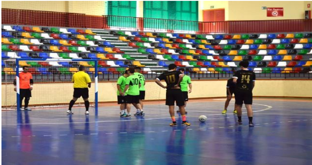
La Liga Local atrae cada temporada a 700 deportistas en Elche