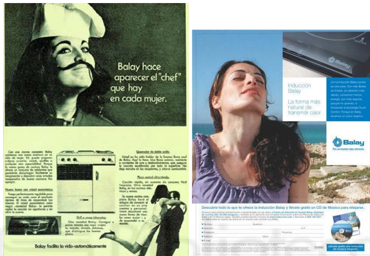
Figura 2. Mujeres en anuncios cotidianos II

Fuente: Fernández, Fernández y Mesa (2008)