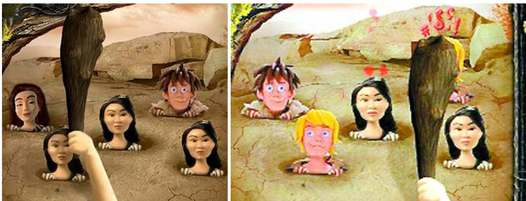
Figura 6. Mujeres y hombres en anuncios