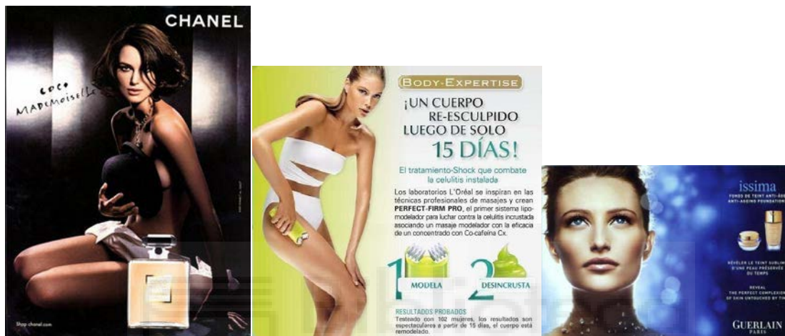
Figura 5. Mujeres en anuncios de cuidado personal