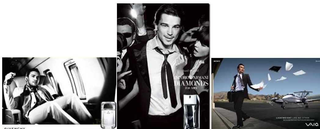
Figura 8. Hombres en anuncios