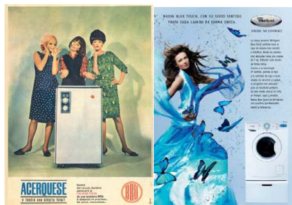
Figura 1. Mujeres en anuncios cotidianos I