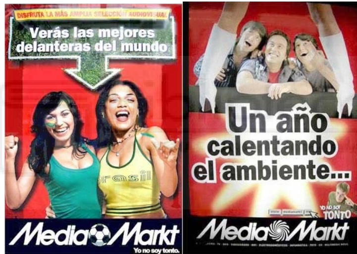
Figura 4. Mujeres en anuncios

Otros roles desempeñados por la mujer en publicidad son el de reclamo erótico-sexual a la hora de vender productos, como en los siguientes ejemplos: