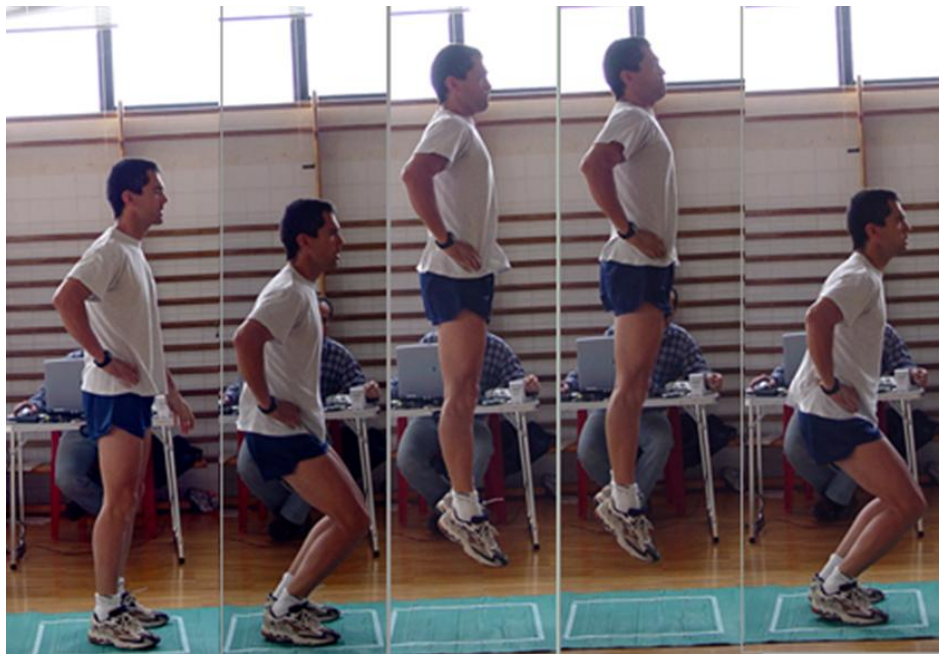
FIGURA 1: CMJ.

El salto CMJ se realiza partiendo el sujeto desde una posición erguida y con las manos en las caderas. A continuación se realiza un salto hacia arriba por medio de una flexión seguida lo más rápidamente de una extensión de piernas. La flexión de las rodillas debe llegar hasta un ángulo de 90 grados y hay que evitar que el tronco efectúe una flexión con el fin de eliminar cualquier influencia positiva al salto que no provenga de las extremidades inferiores. Las piernas durante la fase de vuelo deben estar extendidas y los pies en el momento de contacto con la plataforma se debe apoyar en primer lugar la zona del metatarso y posteriormente la parte posterior del pie. (Bosco, 1983)