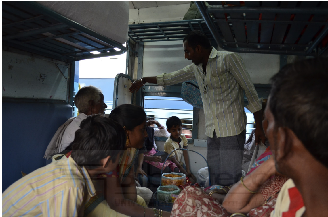
Un vendedor ambulante ofreciendo su mercancía a los pasajeros del tren.

vendiendo calcetines a pesar de que los pasajeros del abarrotado vagón vestían con chanclas o incluso iban descalzos por lo que no debía ser aquel un negocio muy fructífero.