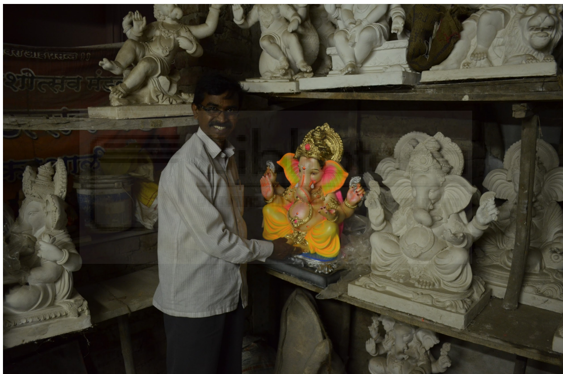
El cuidador del templo Sanjag mostrándome una de sus esculturas.

estrecha. Por la tarde paseamos por el pueblo hasta llegar a un templo hindú y entramos a tirar unas fotos. De repente entró un hombre haciendo grandes aspavientos con las manos y gritando nos dijo que saliéramos de allí que no nos habíamos descalzado. Le pedimos disculpas alejándonos, pero el hombre insistió en que entráramos en una especie de estructura de ladrillo y cemento situada al lado del templo que les daba cobijo y en la que tenía montado un taller de escultura.