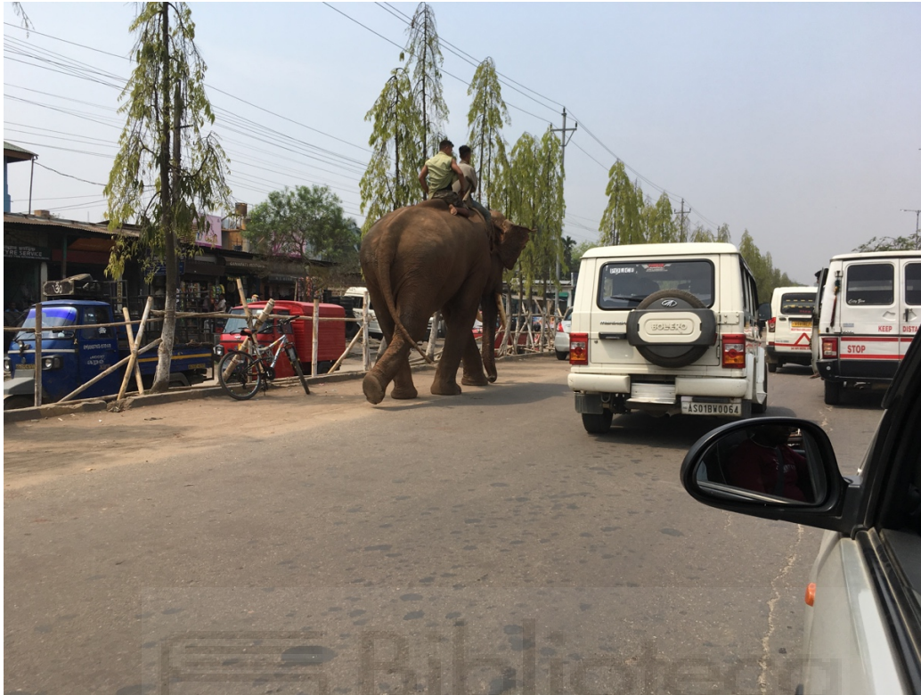
Los elefantes circulan por la carretera como si de otro vehículo se tratara.

Ya en las afueras de la ciudad detuvo el coche y al bajarse me preguntó por mi pequeña mochila donde guardaba la riñonera con la documentación y el dinero, además de la cámara fotográfica, el pc y el resto del equipo. A gritos le dije que se volviera a montar, que la mochila se había quedado en un sofá de la recepción del hotel. Eran las siete de la mañana y yo ya estaba sudando a chorro al borde de un ataque de pánico.