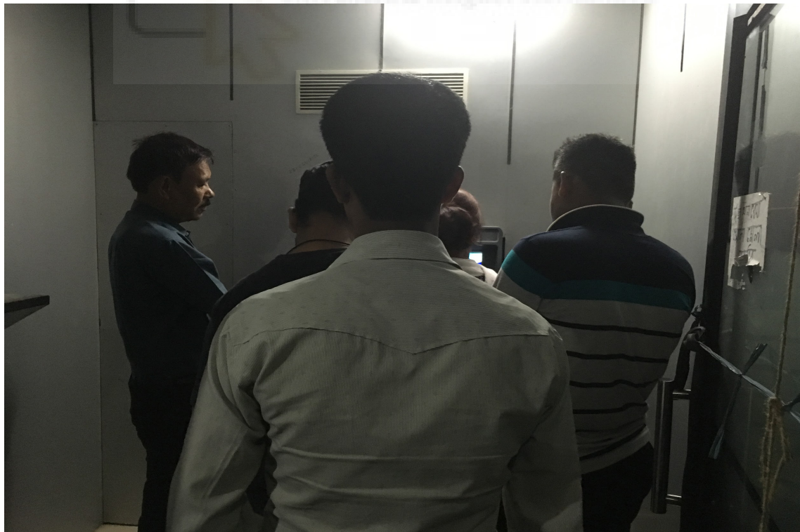
Cajero automático ETM.

Habíamos llegado a Bhubaneswar a mediodía y después de registrarnos en el hotel nos fuimos a dar una vuelta. Un auto rickshaw nos llevó hasta lo que nosotros pensábamos que era el centro, pero fuimos a caer en lo que debía ser una especie de parada de bus, con una docena de hindús que intentaban por todos los medios meternos en uno de ellos con dirección a la ciudad de Puri. No esperéis buenos modales por parte de estos captadores de clientes, no es que no los tengan, es que no son como los que nosotros conocemos.