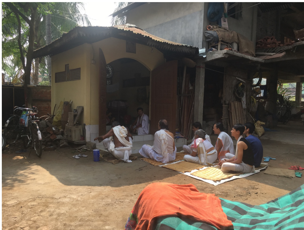
Ceremonia de purificación en el pequeño templo de la familia Baraly.