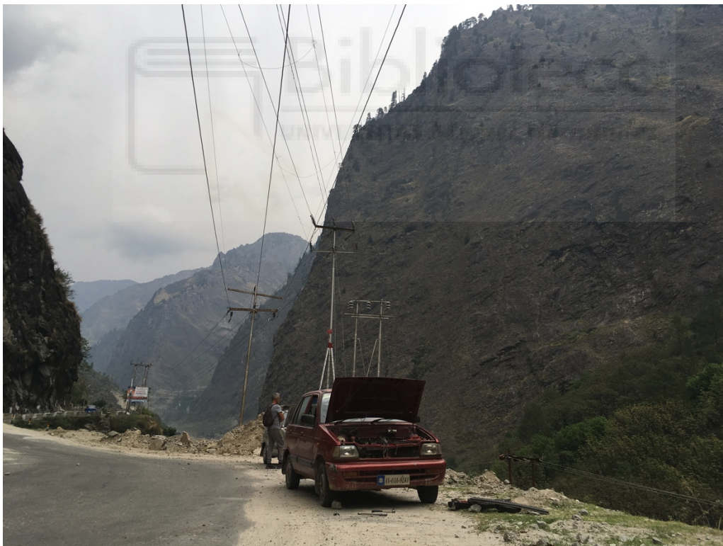
Las malas carreteras y las rampas casi acaban con el Maruti.

Trazamos rutas diarias de no más de 150 kilómetros y con numerosas paradas para que el coche no se calentara demasiado. Aun así, el coche se rompió cuatro veces más y en cada una de ellas encontramos a una figura que lo conseguía arrancar.