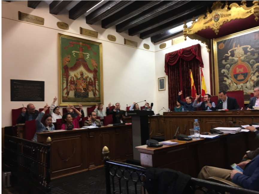
Los concejales del Ayuntamiento, durante una votación