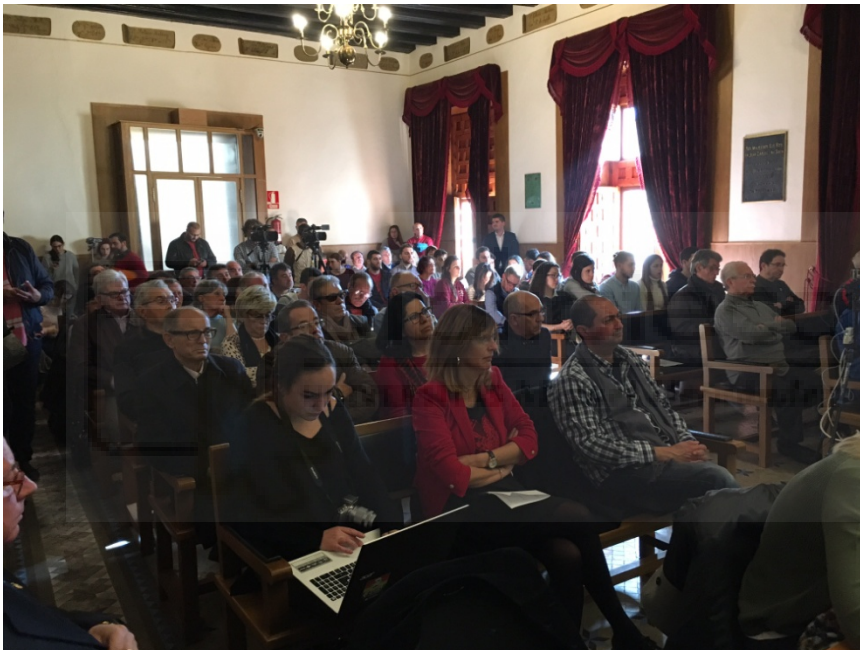
Público y prensa durante un acto en el Ayuntamiento de Elche