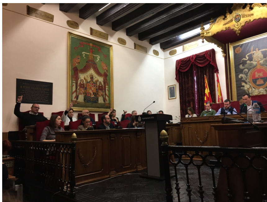
Concejales, durante una votación