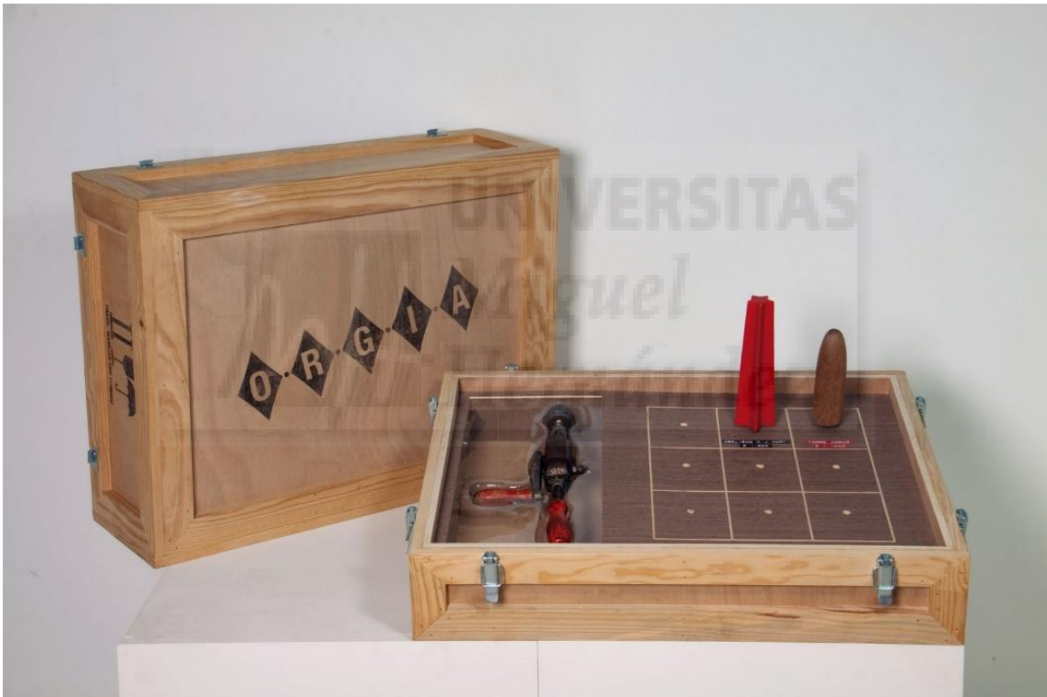
(Fig. 5) O.R.G.I.A: Follarse a la Ciudad (2009-...) Art project/ Técnica mixta, 34x67'5x51'5 cm.