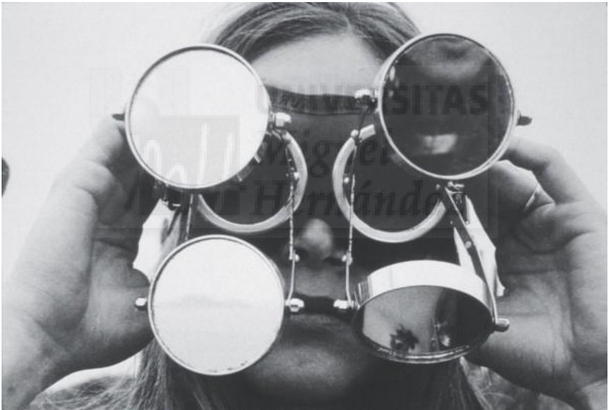
(Fig. 2) Lygia Clark: Óculos (1968) Alumini, cristal i cautxú industrial, 11x7x2 cm.

Seguidament s'encontra Lygia Clark, l'artista brasilera que mostra mitjançant estructures geomètriques i complements tèxtils, la seua visió de com modificar la realitat. Té un gran interès en la relació que es crea entre l'objecte artístic i el cos humà. Com també s'observa en aquest projecte que s'està realitzant, l'artista fa que l'espectador qüestione els codis vigents, fent partícips de les obres en primera persona, utilitzant així els objectes artístics com eines per a les experiències col·lectives i aportant immersió auto-analítica i d'estructuració del jo. Treballa també la idea de la transformació del marc, donant infinites solucions al problema que es planteja. L'obra que es destacaria per semblança al projecte seria óculos 1968 (fig. 2) on l'artista ens ofereix poder mirar altres realitats mitjançant espills. Ja que a l'obra fraccionament de la realitat s'intenta modificar la realitat present del espectador/a.