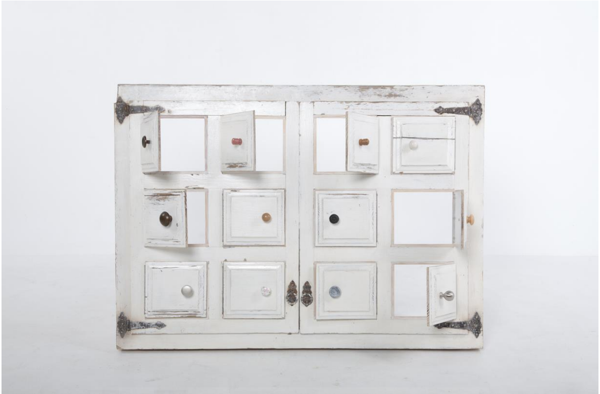
Fraccionament de la realitat (2018), Escultura/ Técnica mixta/ Fusta, ferro i alumini, 80x7x110cm.