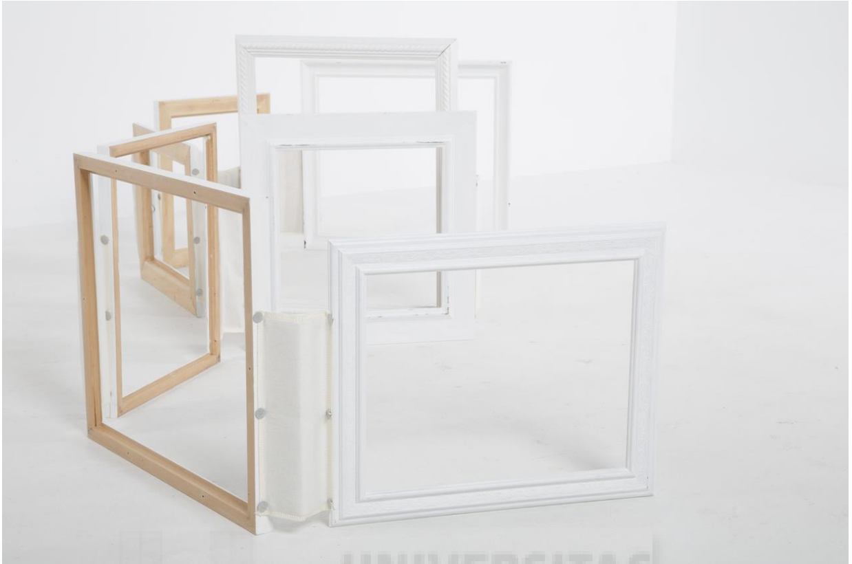
Límits marcats (2018), Escultura/ Técnica mixta/ Fusta, cartró, tela, alumini, mesures variables