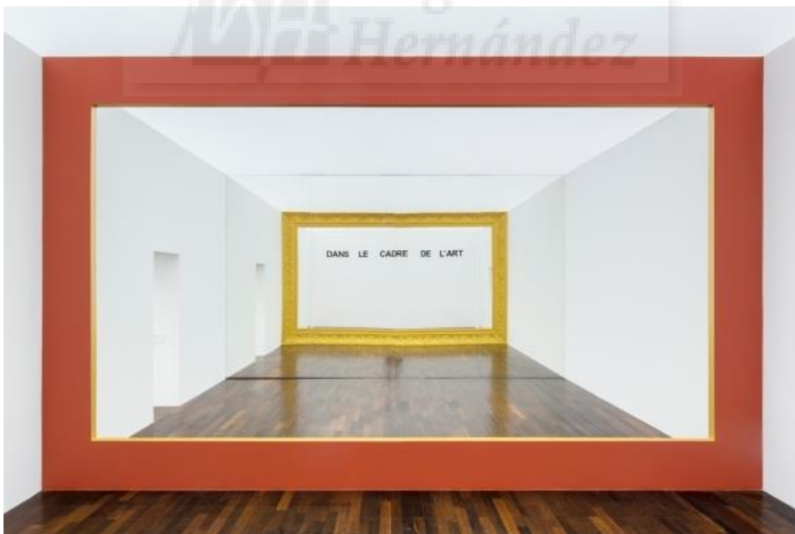
(Fig. 1) Esther Ferrer: En el marco del arte (1999-2014), Instal·lació/ Técnica mixta, 1500x1500x1500 m.

En primer lloc es destaca l'obra d'Esther Ferrer. En general amb la seua trajectòria es pot veure com utilitza objectes quotidians per a resimbolitzar-los. També es recolza molt amb les figures geomètriques i la repetició per a potenciar l'obra, a més a més es pot observar en aquest projecte de 'mirades, accions i pensaments construïts'. Hi ha una obra que es pot destacar per la semblança a Límits marcats , per la utilització del marc. L'utilitza per capturar un espai/temps i donar a entendre que tot allò que estiga reflexat al espill amb el marc formarà part del marc de l'art. (Fig. 1)