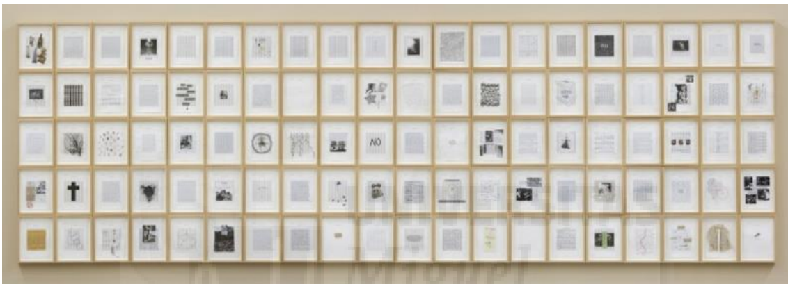
(Fig. 4) Elena del Rivero: Conversacions (1994), Instalació/ 100 dibuixos sobre paper, 18x23 cm. c/u

Seguiment es troba Elena del Rivero, artista valenciana que agafa la quotidianitat com un espai que per a ella, compta amb diverses dimensions simbòliques. Explora la repetició i la manipulació dels objectes del espai privat, per a donar major expressivitat, i utilitza com a material principal el paper . En afinitat al projecte que s'està duent a terme, es pot destacar l'ànim per mostrar les diferents versions partint d'un mateix objecte, la utilització de materials ordinaris per a expressar-se i la perspectiva feminista que es troba a les seues entrevistes. En especial es destaca l'obra anomenada Conversacions (fig.4) on trobem diferents visions a partir d'un concepte. Es podria dir que a l'obra Límits marcats es mostra de manera semblant al que del Rivero fa, encara que ella no canvia marc, les dos creadores ofereixen moltes possibilitats dins d'ells.