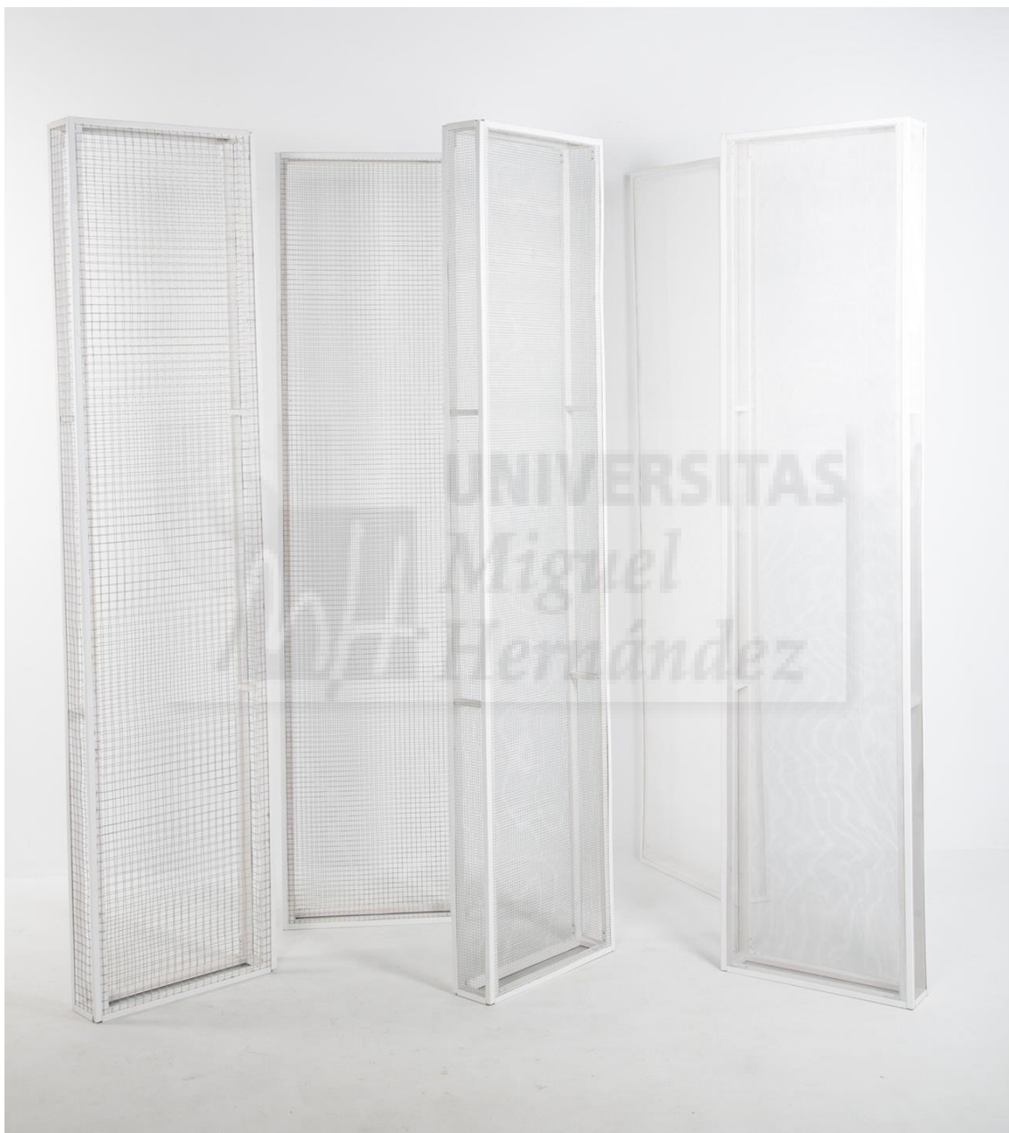
Dipòsits epistemològics (2018), Escultura /Técnica mixta/Fusta, ferro i plàstic, 60x200x10 cm

En conclusió, aquest projecte forma part d'un tot inacabat que anirà creixent i evolucionant per la voluntat i el compromís que tinc amb aquest tema. És una pedreta més al camí, per a continuar caminant endavant.