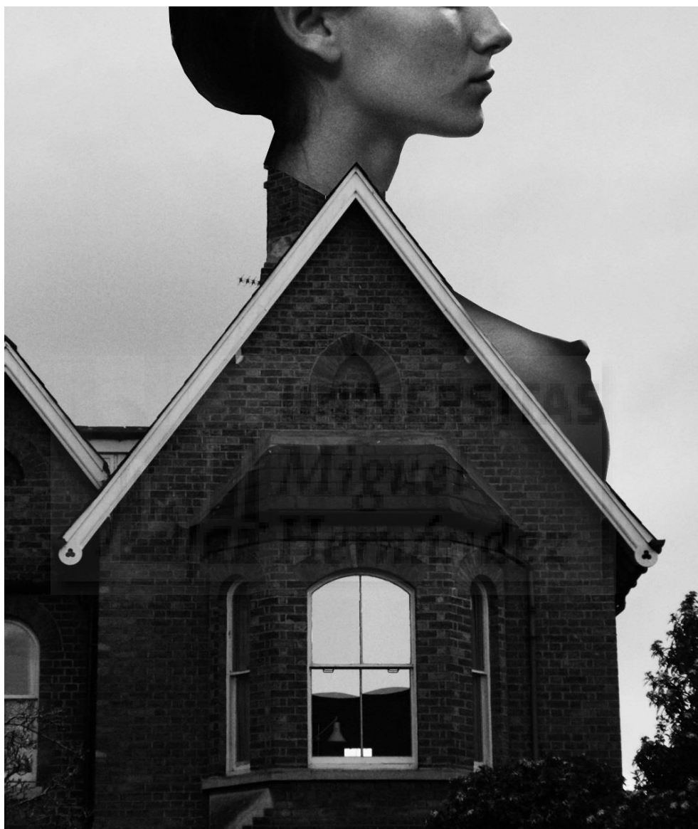
House Structure (2017), foto collage digital blanco y negro realizado con Photoshop (Fig. 3)

Descubro a la artista Penny Slinger y su serie de fotocollages An Exorcism cuyo escenario enigmático es una casa. Empiezo a experimentar con fotocollages digitales de inspiración surrealista combinando partes de mi cuerpo y arquitectura doméstica. Progresivamente, empiezo a tener la confianza de usar partes de mi cuerpo más íntimas como los pechos (Fig. 3, 4 y 5).