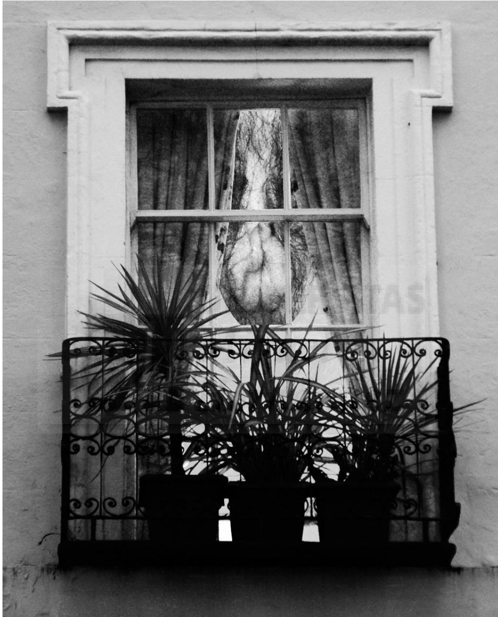
Balcón (2018), Foto collage digital blanco y negro realizado con Photoshop (Fig. 6)

Me enfrasco en el concepto de liminalidad y empiezo a investigarlo, por lo tanto, me centro en los orificios de mi cuerpo y en los espacios liminales de la arquitectura doméstica (Fig. 6). Lo que supone un reto para mí ya que muestro la parte más íntima de mi cuerpo al exterior.