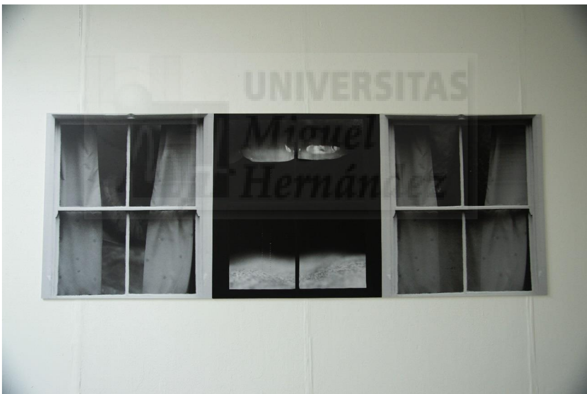
Woman triptych (2018), Tres foto collages digitales blanco y negro realizados con Photoshop, expuestos a modo de tríptico. Impresión Giclee sobre soporte de espuma (Foamex board) de 5mm de grosor con un sellado protector. Dimensiones: 94.50 cm x 258 cm (Fig. 13)

Obviamente, todavía me encuentro en un espacio liminal, todavía estoy aprendiendo de mí misma y del exterior. Somos individuos en constante aprendizaje y modelaje. Proseguiré investigando, ya que la autoexploración no debe acabar, debo seguir superando mis límites.