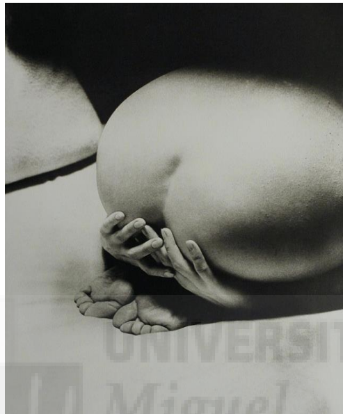
Man Ray, The Prayer , negativo 1930, impresión 1960, copia a la gelatina de plata, 24 x 18.1 cm.

Mis primeros collages y fotomontajes estuvieron fuertemente influenciados por la estética surrealista de la década de 1920 del siglo XX, siendo el artista americano Man Ray (1890- 1976), maestro de la fotografía experimental, uno de mis mayores referentes. Sus composiciones son toda una influencia estilística para mí. Sus imágenes elegantes, enigmáticas y llenas de contenido me fascinan. Su trabajo es provocador, atractivo y desafiante. En su trabajo, pretende estimular diferentes formas de ver lejos de la percepción convencional de la realidad.