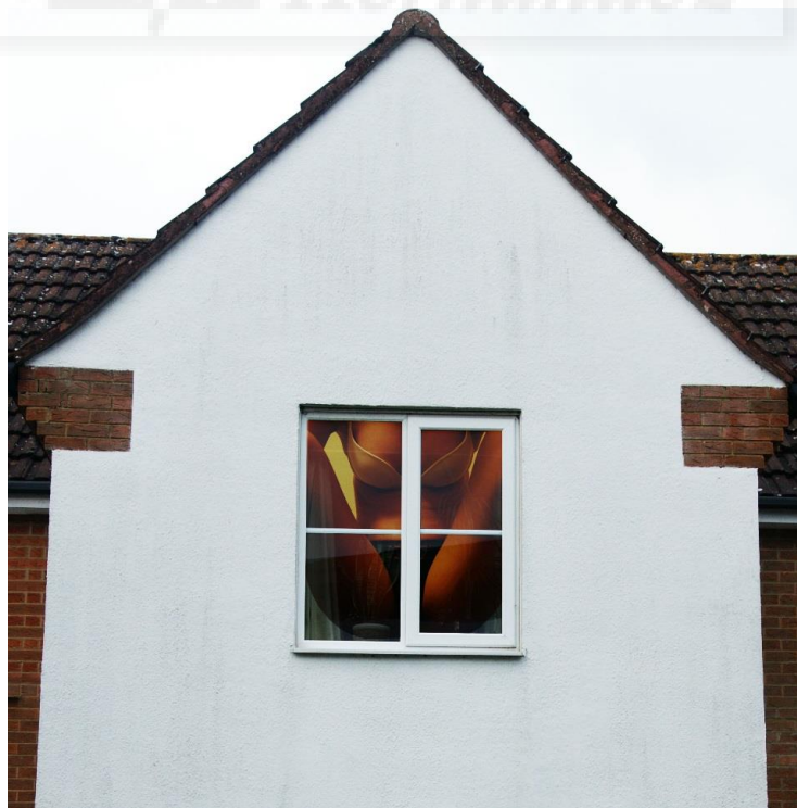
Mujer en la ventana (2017), Foto collage digital realizado con Photoshop (Fig. 5)