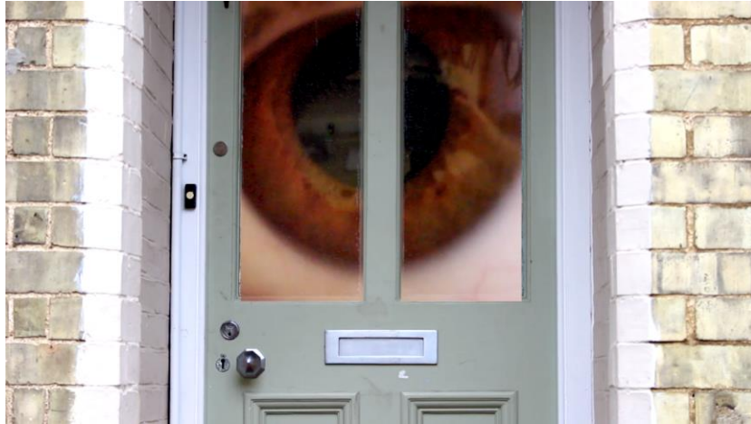
Eye (2018), video collage realizado con Adobe Premiere. Vídeo primero en la caja (izquierda). Duración: 10min en loop. (Fig.16)