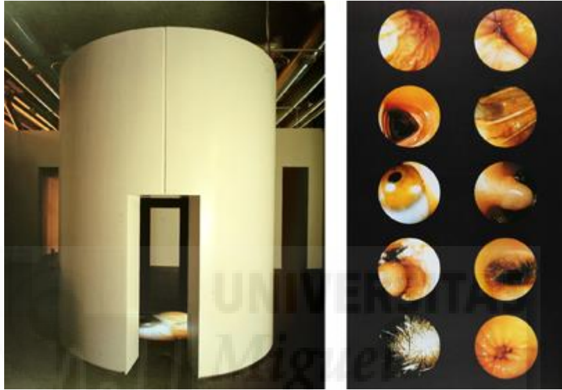
Mona Hatoum, Corps Étranger , 1994, videoinstalación con estructura cilíndrica de madera, proyector de vídeo, amplificador. Altavoces, 350 x 300 x 350 cm.

Interior Scroll (1975) de Carolee Schneemann (1939) me interesa especialmente por cómo lleva a cabo la exploración feminista de su propio cuerpo y de su intimidad en relación con el espectador. Por otro lado, Corps étranger (1994) de Mona Hatoum (1952) donde una cámara endoscópica explora el interior de su cuerpo introduciéndose por cada uno de sus orificios.