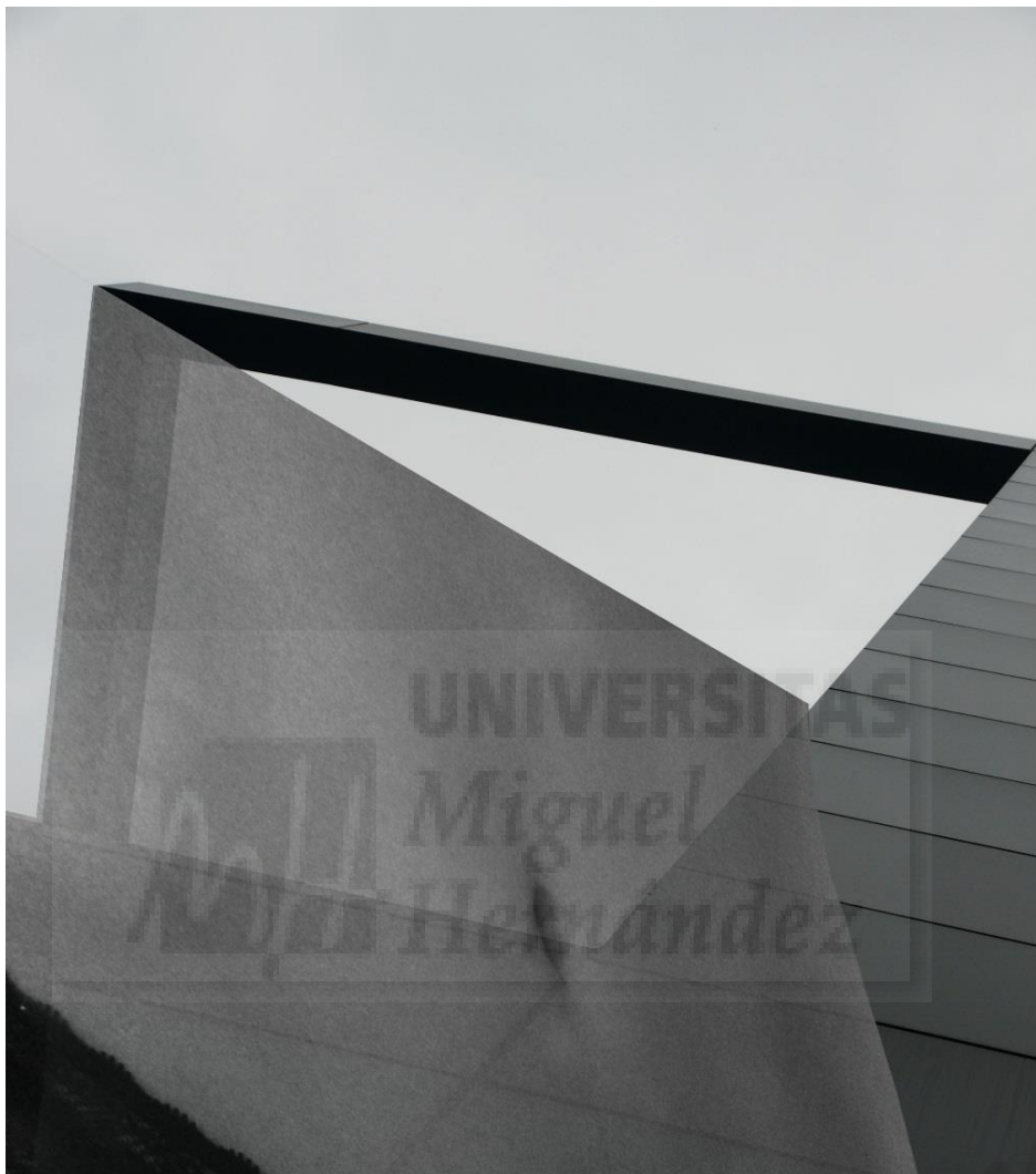
Body and Building (2017), foto collage digital blanco y negro realizado con Photoshop (Fig. 2)

Después, empiezo a experimentar con los collages digitales con Photoshop. Mis collages empiezan a ser más erotizados o sexualizados, es un erotismo sofisticado y sutil (Fig. 2).