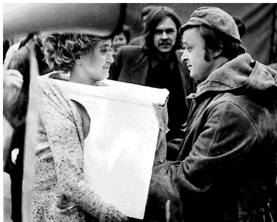
Valie Export, Tap and Touch Cinema , 1968, performance.

Valie Export (1940) explora los diversos aspectos que dificultan a la mujer recuperar su conciencia de sujeto y liberarse de la dominación masculina. En Tap and Touch Cinema (1968) la artista invita a los transeúntes a palpar sus pechos desnudos, que permanecen cubiertos por una caja con dos aberturas y cortinas que impiden ver más allá de la tela. Sustituyendo la imagen de la pantalla por su propio cuerpo expone al público la realidad del voyeur que habitualmente permanece protegido por la oscuridad de las salas de cine. La idea de que utilice su propio cuerpo para explorar las reacciones del espectador y así retarlo es uno de los objetivos que intento activar a través de mi segunda obra videoinstalación (Fig. 15).