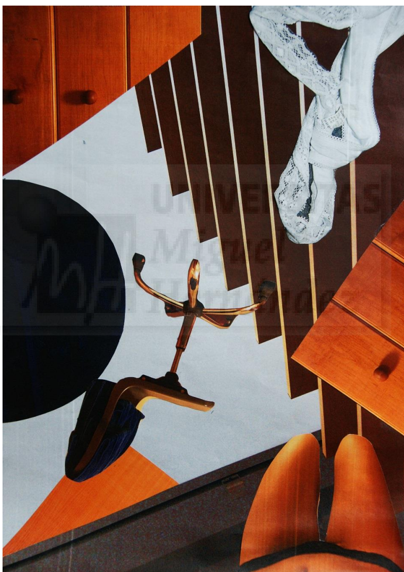
Experimentación I (2017), Collage con recortes pegados sobre fotografía, tamaño A3 (Fig. 1)

A continuación, me fotografío y filmo a mí misma en mi espacio íntimo, en mi actividad cotidiana. Con todo, hago collages de inspiración surrealista, combinando la pureza de las líneas de la arquitectura moderna con lo orgánico de mi cuerpo y mis objetos cotidianos e íntimos (Fig.1).