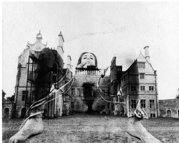
Penny Slinger, The Abysmal o A Difficult Position (An Exorcism) , 1975, foto collage sobre cartulina.

Además, Penny Slinger afirma estar interesada en cruzar las fronteras y límites establecidos por la sociedad o la cultura. Se trata de cruzar umbrales, y no estancarse en la realidad mundana, como defiende la tradición surrealista.