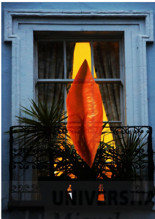
Lips (2017), Foto collage digital realizado con Photoshop (Fig.4)