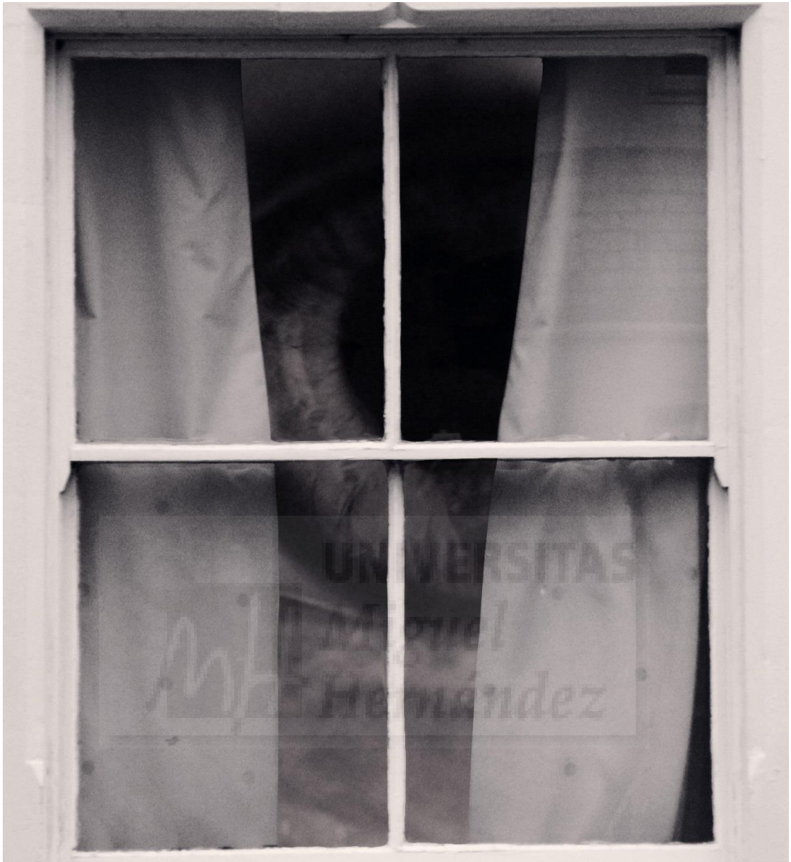
Eye (2018), Foto collage digital blanco y negro realizado con Photoshop. Impresión Giclee sobre soporte de espuma (Foamex board) de 5mm de grosor con un sellado protector. 94.50 cm x 86 cm (Fig. 10)