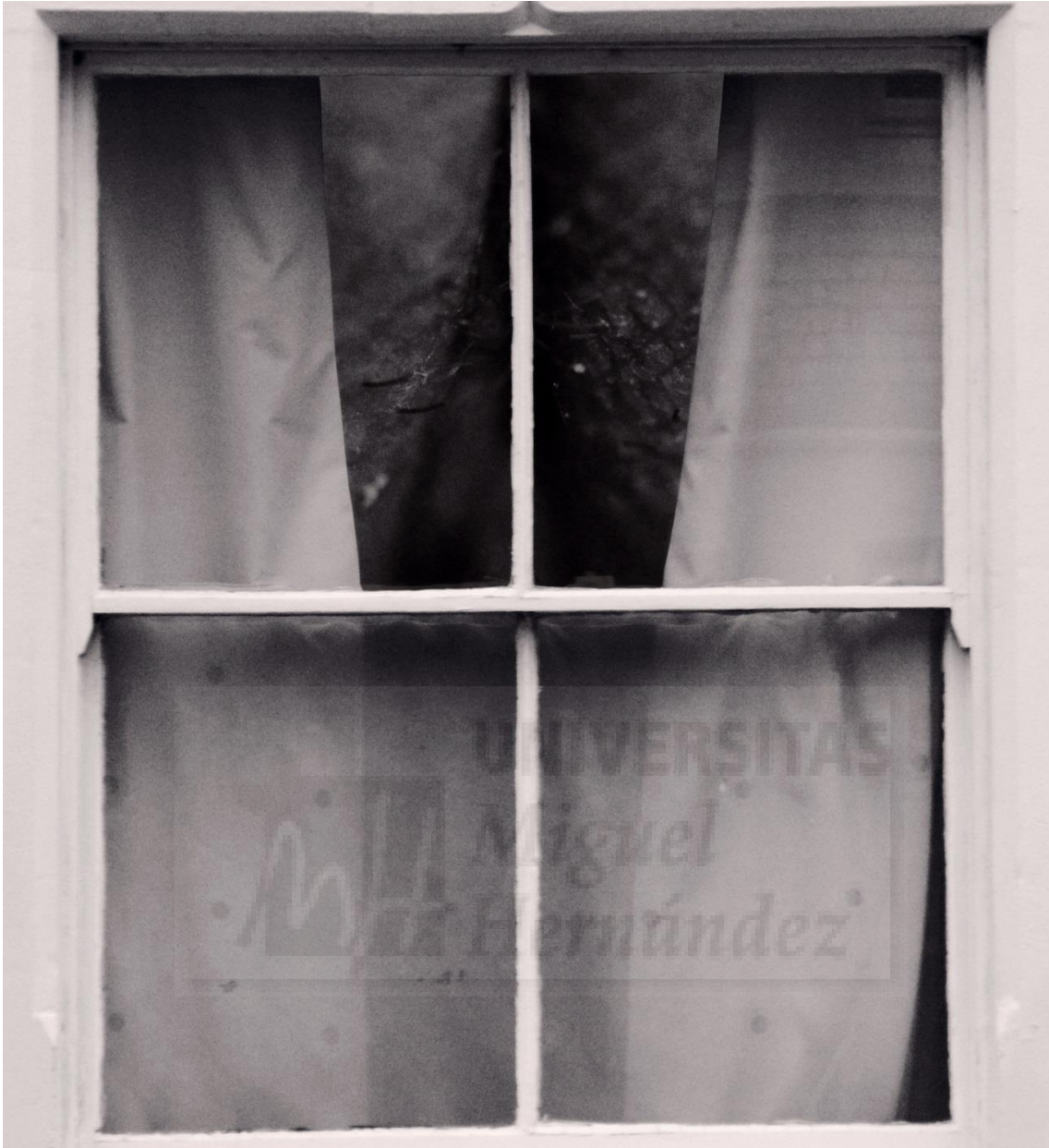
Genital (2018), Foto collage digital blanco y negro realizado con Photoshop. Impresión Giclee sobre soporte de espuma (Foamex board) de 5mm de grosor con un sellado protector. 94.50 cm x 86 cm (Fig. 12)