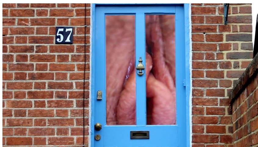
Genital (2018), video collage realizado con Adobe Premiere. Vídeo tercero y último de la caja. Duración: 10min en loop. (Fig.18)