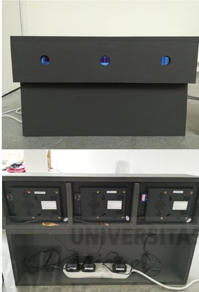
Untitled video triptych (2018), Videoinstalación. Video collages en construcción de madera, 38 x 54,5 x 15 cm. Duración de los vídeos 10min, proyección en loop. (Fig. 8 y 9)

En la exposición Hoi Polloi de Oxford Brookes University, esta pieza tuvo polémica por el contenido de uno de los videos, que mostraba explícitamente mi vagina a color y en un movimiento constante de abrir y cerrar. Distintas opiniones se formaron por parte de los profesores. Unos estaban a favor, otros no tanto ya que querían protegerme y proteger mi privacidad. Finalmente, decidimos poner un “Warning” al lado de la pieza avisando del contenido explícito de la pieza (Fig.14).