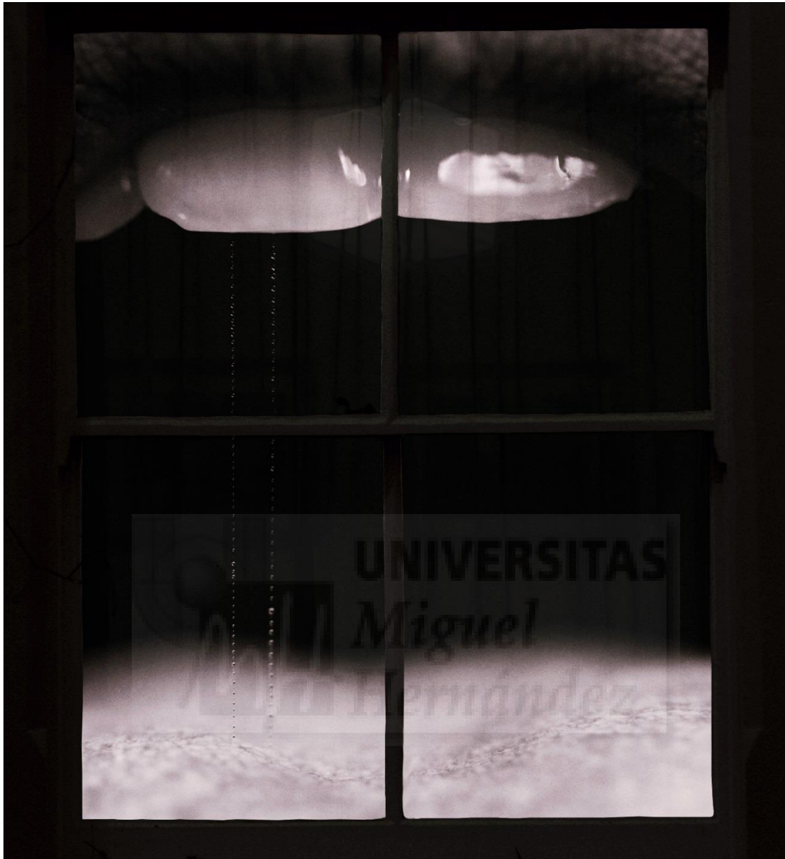
Mouth (2018), Foto collage digital blanco y negro realizado con Photoshop. Impresión Giclee sobre soporte de espuma (Foamex board) de 5mm de grosor con un sellado protector. 94.50 cm x 86 cm (Fig. 11)