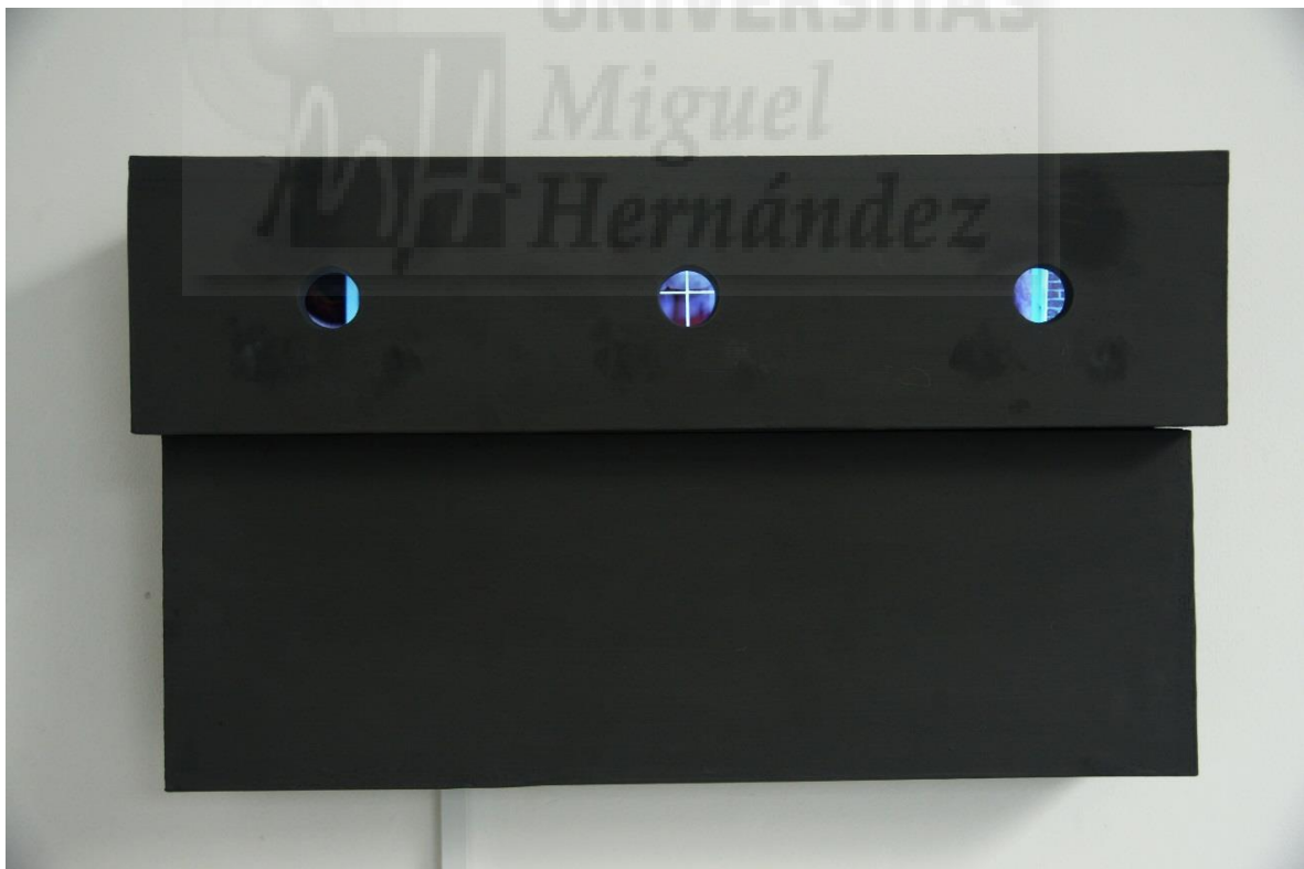
Untitled video triptych (2018), Videoinstalación. Video collages en construcción de madera, 38 x 54,5 x 15 cm. Duración de los vídeos 10min, proyección en loop. (Fig. 14 y 15)