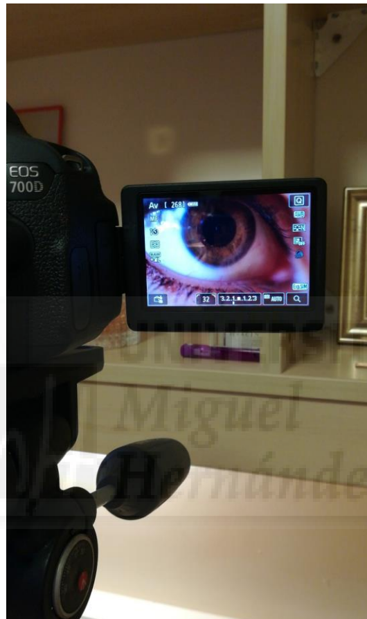
Proceso de auto fotografiarme con la cámara Canon EOS 700D y el macro lente (Fig. 7)

Finalmente, utilizando la cámara Canon EOS 700D con macro lentes y un mando de control remoto, me autofotografié cada orificio de mi cuerpo. Hice varias pruebas pero finalmente decidí centrarme en el ojo, la boca y la vagina. Cuando realicé las tres composiciones que serían las utilizadas para la pieza final (Fig. 10, 11 y 12), las retoqué numerosas veces con Photoshop hasta que estuvieran listas para ser impresas en gran tamaño: 94.50 cm x 86 cm (tamaño similar al de una ventana real para mayor impacto).