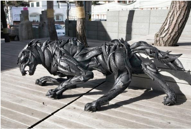
Figura 3. Yong Ho Ji: Lobo (2006), escultura

Los neumáticos despertaron en este artista el sentido de la responsabilidad ecológica. Y por ello sus piezas representan el importante vínculo entre la industrialización y la degradación ambiental. El neumático es una metáfora de cómo manipulamos la naturaleza a nuestro antojo, ya que el caucho sale de la naturaleza y nosotros lo convertimos en algo oscuro, en un producto que asusta.