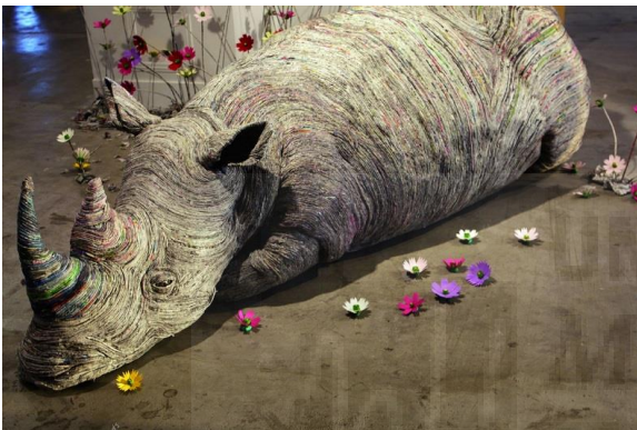
Figura 1. Chie Hitotsuyama: Todavía estás gritando al grito de tu corazón (2011), escultura

Esta artista y sus esculturas hiperrealistas nos trasladan a un mundo donde el papel da lugar a exóticos animales. A través de sus esculturas nos muestra que los animales son muy similares a los seres humanos, ambos tienen su propia vida y se irán algún día. Sus piezas son ecológicas, ya que las crea a partir de un elemento desechado, el papel de periódico. Su técnica se basa en la utilización de tiras de periódicos mojados.