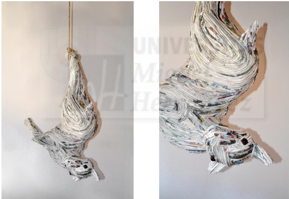
Figura 6. Realidad escondida (2017), escultura, papel de periódico, 72 x 72 x 21 cm

El proyecto escultórico realizado ha sido el resultado de la investigación de todos los daños que el ser humano causa al animal, y presenta una imagen directa al público, intentando concienciar sobre los problemas tratados en el desarrollo del tema.