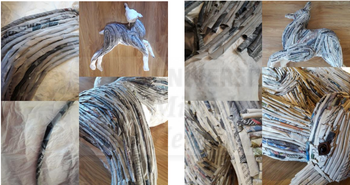
Figuras 4 y 5. Realidad escondida (2017), escultura

Se convierte entonces en una escultura ecológica, al darle un uso al papel desechado, creando algo nuevo a partir de lo que ya era.