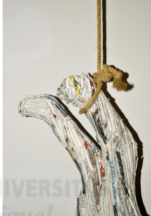
Figura 8. Realidad escondida (2017), escultura, papel de periódico, 72 x 72 x 21 cm