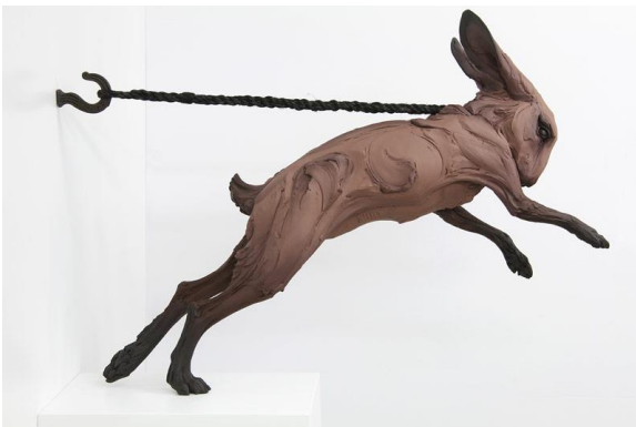
Figura 2. Beth Cavener: Mantenido (2015), escultura

Esta artista crea animales a tamaño real, y sus expresiones representan emociones humanas combinadas con un comportamiento animal, ya que tanto en la comunicación humana como en los animales hay patrones de comportamiento.