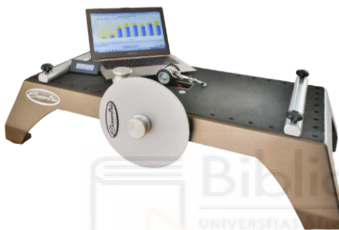
Figura 2.- Dispositivo flywheel y encoder

concéntrica lo más rápido posible y retrasar la acción de frenado hasta el último tercio de la fase excéntrica. Los datos registrados fueron la potencia pico concéntrico (PpCON), la potencia pico excéntrico (PpEXC) y el ratio excéntrico/concéntrico, se utilizó un codificador compatible con el dispositivo isoinercial flywheel (SmartCoach Power Encoder, SmartCoach Europe AB, Estocolmo, Suecia) con el software asociado (v 3.1.3.0).