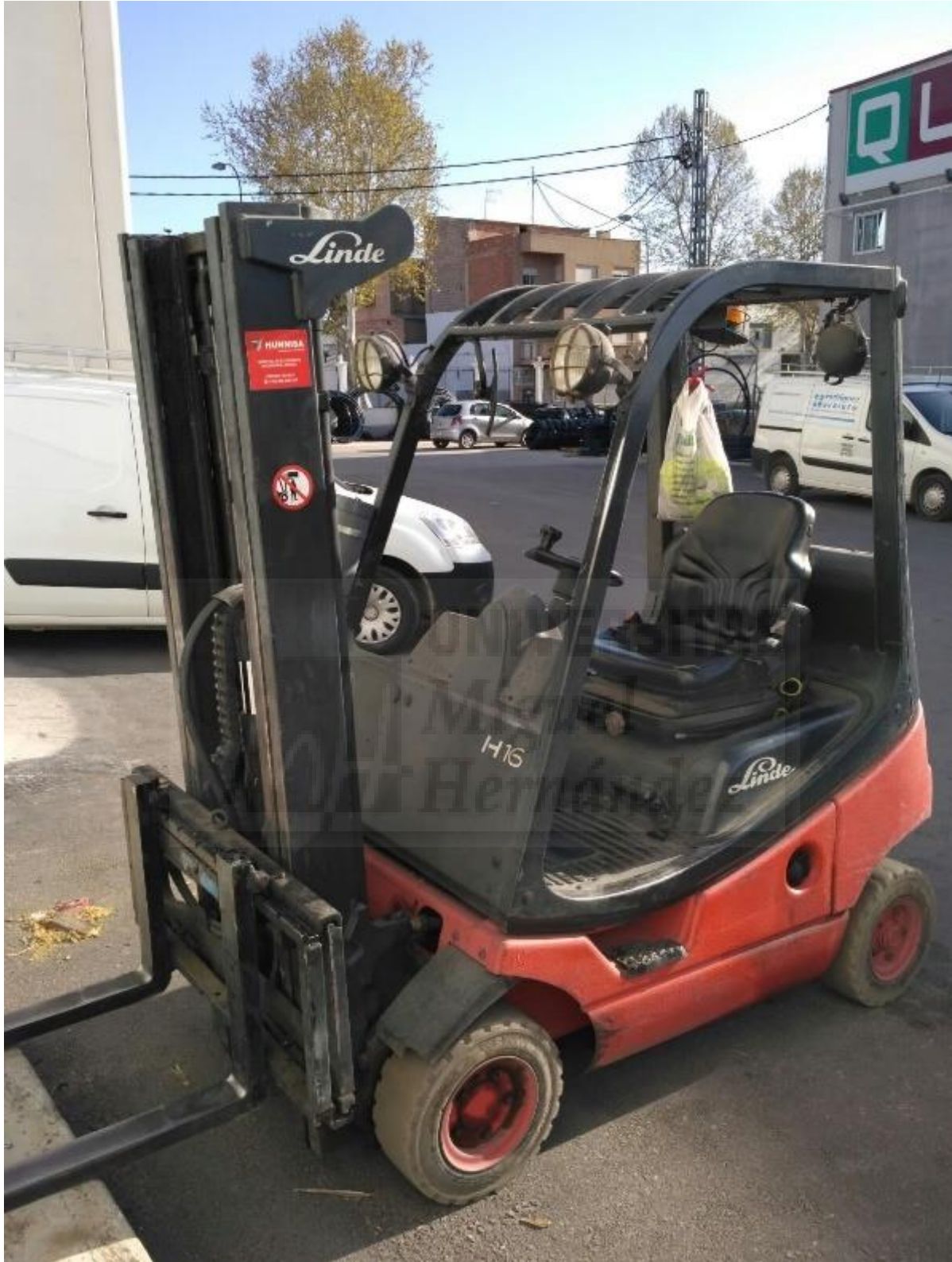
Fotografía 3. Carretilla elevadora nueva, frontal