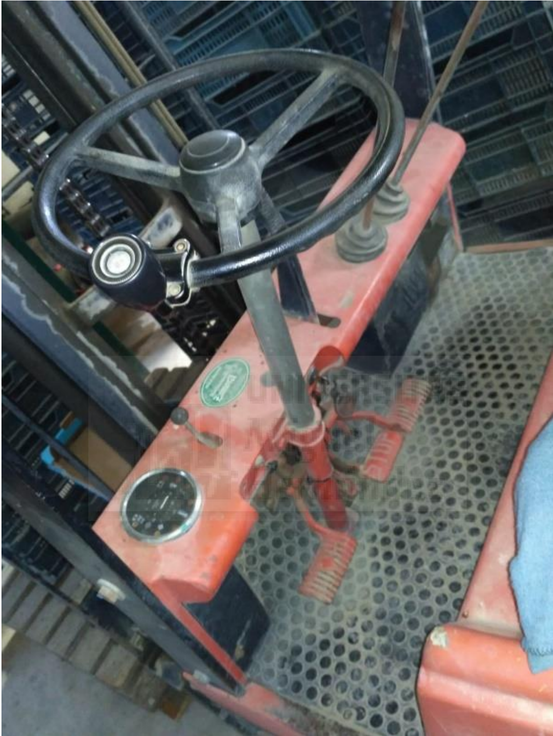
Fotografía 5. Carretilla elevadora antigua, interior