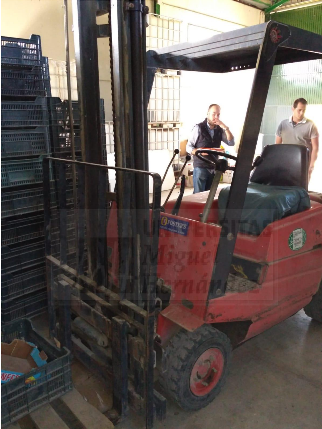
Fotografía 6. Carretilla elevadora antigua, frontal