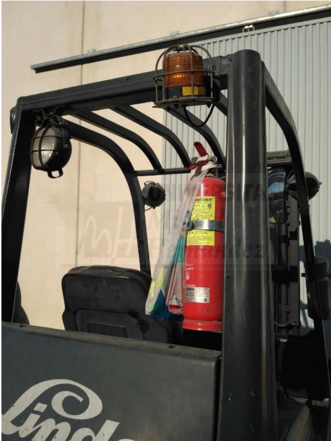
Fotografía 1. Carretilla elevadora nueva, parte trasera

En este apartado se muestran las fotografías realizadas al equipo de trabajo: