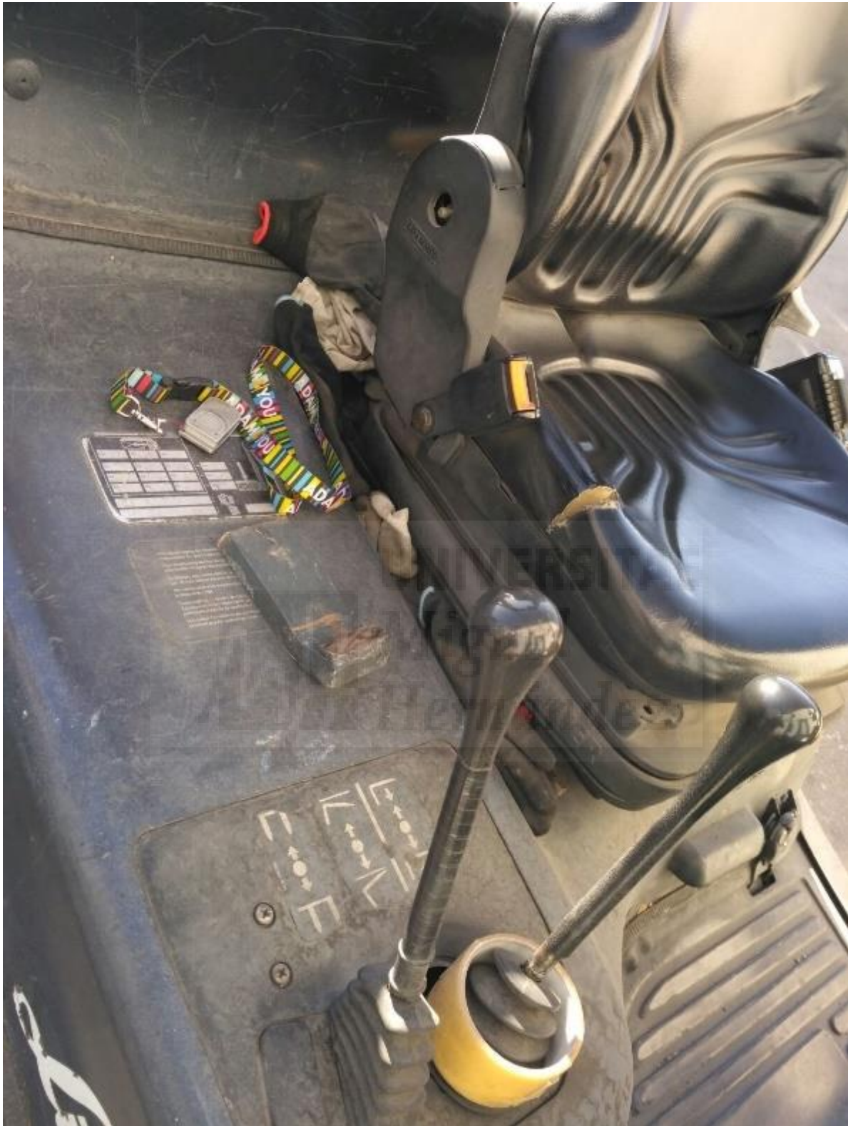
Fotografía 2. Carretilla elevadora nueva, interior