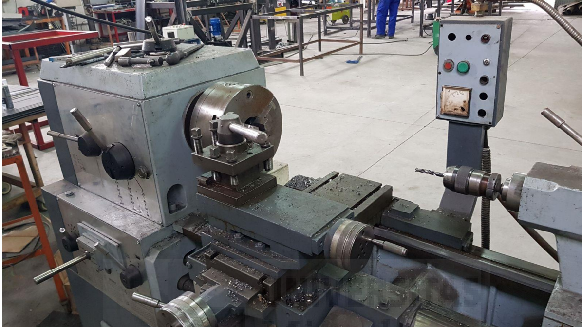
Fotografía 9. Torno, zona delantera

En este apartado se muestran las fotografías realizadas al equipo de trabajo: