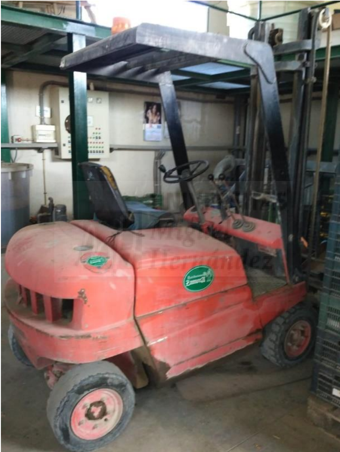
Fotografía 4. Carretilla elevadora antigua, parte trasera

En este apartado se muestran las fotografías realizadas al equipo de trabajo: