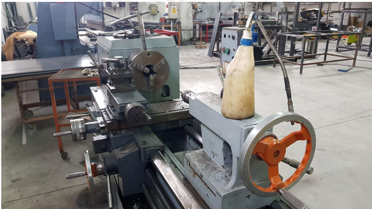
Fotografía 10. Torno, zona frontal