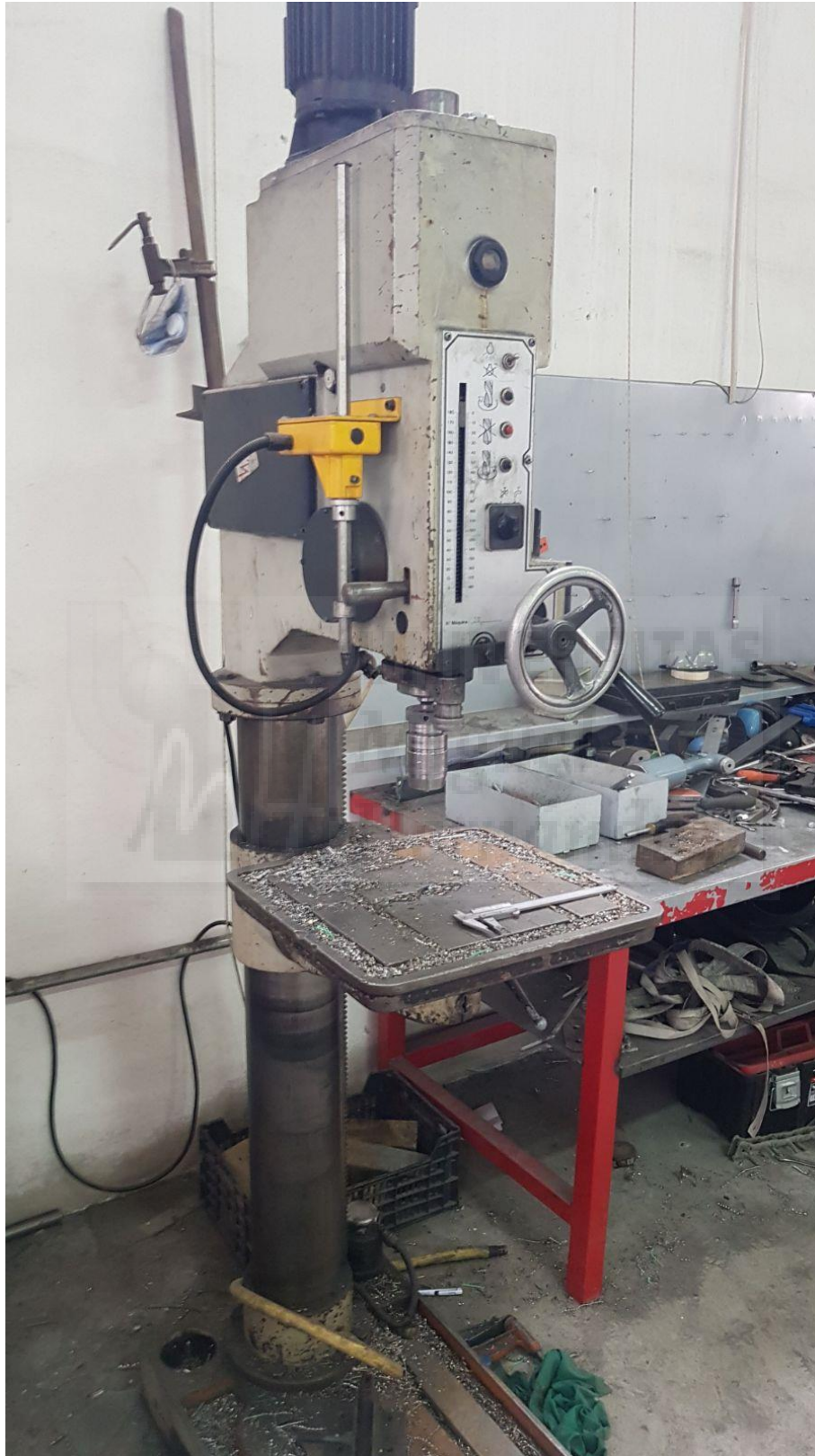
Fotografía 8. Taladro de columna, lateral derecho