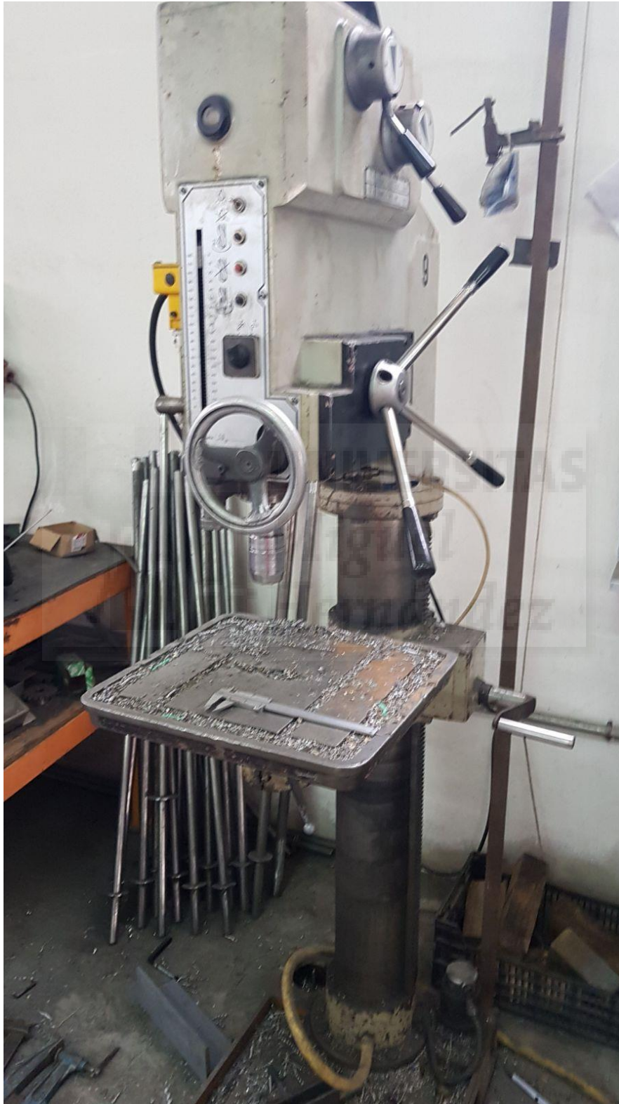
Fotografía 7. Taladro de columna, lateral izquierdo

En este apartado se muestran las fotografías realizadas al equipo de trabajo: