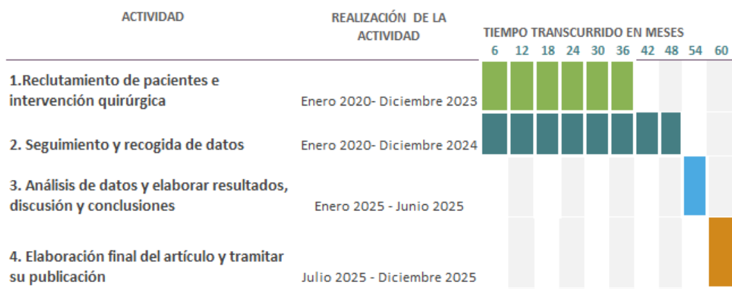
Figura 4: Cronograma de actuación general