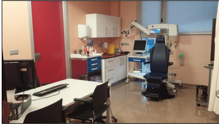
Figura 2: Consulta de otorrinolaringología del Hospital Universitario Santa Lucía.

En la primera consulta se realizará una historia clínica completa en la que se recogerá la edad del paciente, motivo de consulta, la historia actual, el origen de la perforación, intervenciones quirúrgicas previas y otra serie de datos rutinarios como son alergias medicamentosas, tratamiento crónico, etc. Para poder ser sometido a la intervención quirúrgica, el paciente deberá presentar el oído seco, por lo que en caso de estar con otorrea en ese momento o de haberla tenido recientemente se le explicarán las medidas que debe seguir para conseguir mantenerlo seco y se le dará revisión en 6 meses. Una vez que se tenga la seguridad de tener el oído seco y tras haber aplicado los criterios de inclusión y exclusión, se le comunicará la posibilidad de participar en el ensayo clínico con utilización de membrana amniótica para la miringoplastia, explicándole que, si acepta, podrá ser asignado aleatoriamente al grupo de la membrana amniótica o bien al grupo tradicional con pericondrio, y que únicamente se le comunicará a que grupo ha pertenecido una vez transcurrido un año desde la cirugía.