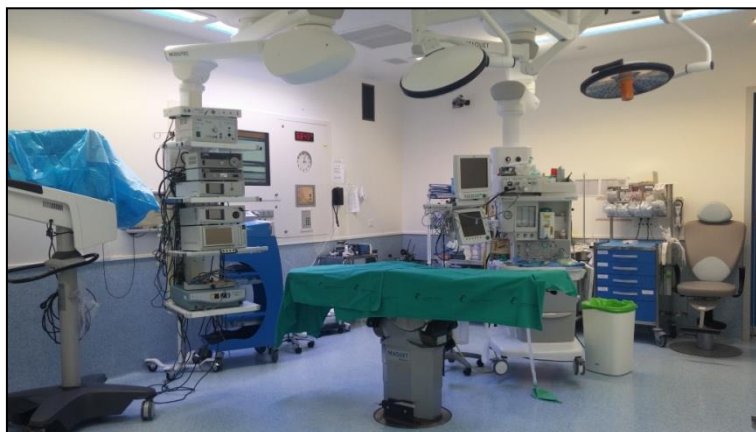
Figura 3: Quirófano de otorrinolaringología del Hospital Universitario Santa Lucía.

Esta fase tendrá lugar en el quirófano de otorrinolaringología de cada uno de los hospitales (Figura 3) y será llevada cabo por los mismos otorrinolaringólogos que en la fase anterior con la colaboración de una enfermera instrumentista (una por cada hospital), siendo siempre los mismos para todos los pacientes. El resto de personal del quirófano (anestesta, enfermera circulante y auxiliares) podrá variar en función del día.