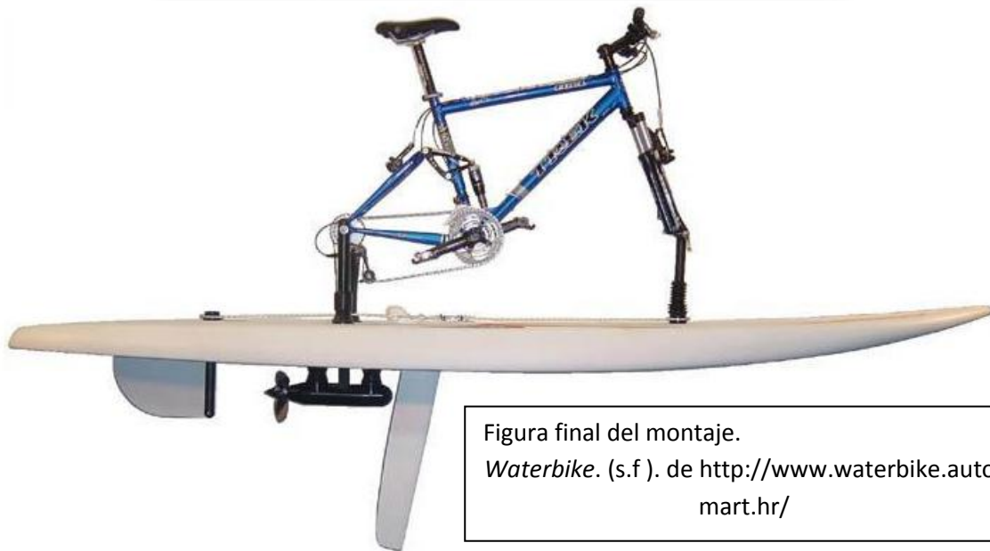
Figura final del montaje.

Para que sea transportable lo ideal es desmontarla en dos piezas, una la tabla de windsurf con la hélice y la aleta, y la otra parte la bicicleta.