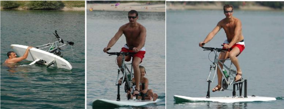
Waterbike. (s.f). de http://www.waterbike.auto-mart.hr/