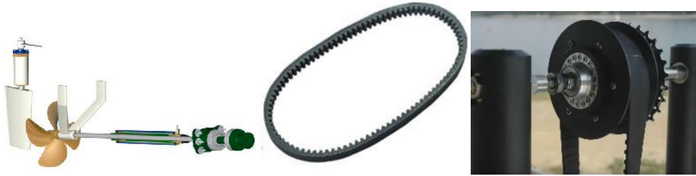
Rueda dentada en el buje

Todas las piezas buscadas son de acero inoxidable o plástico para evitar que se oxiden con el agua.