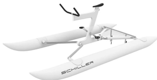
2 Modelo de Schiller