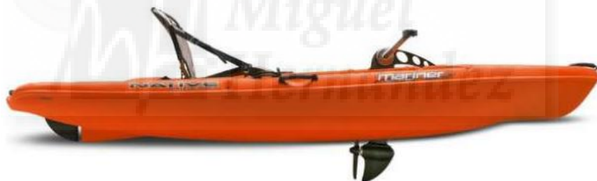
native watercraft . Recuperado de http://nativewatercraft.com/product/slayer-propel-13/

Continuando en esta línea de deporte acuático he pensado en la posibilidad de que fuera en una posición más cómoda, hidrodinámica y por qué no, más rápida. Este pensamiento me ha dirigido hacia la forma de un kayak. Es decir, coger un kayak e instalarle el sistema de pedaleo, de dirección y de velocidad. Buscando sobre este tema, también he encontrado que ya hay patentes y que se puede comprar. Estas patentes sobre los kayaks disponen de pedales, timón de dirección, velocidad y un asiento para estar más cómodos. A priori podríamos pensar que es perfecto y que ya he llegado al fin de la búsqueda, pero no, al igual que la patente de Schiller su precio inicial es bastante elevado. Su precio a la venta está en unos 2.800 euros el más barato e incluso mirando en tiendas de segunda mano nos saldría por más de 1.000 euros. Este es otro instrumento que se aleja de la posibilidad de que cualquier persona pueda disponer de él.