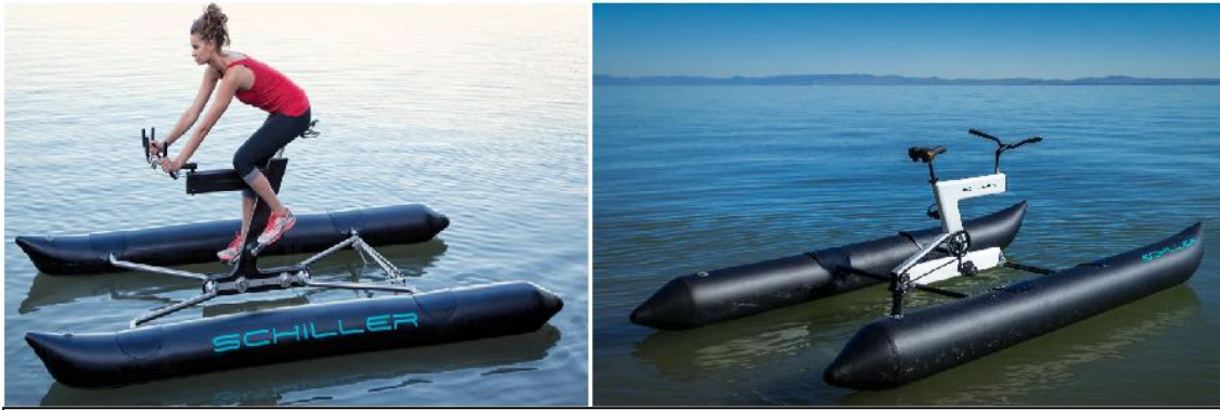
Schiller, J. (2014, agosto 14). Schiller sports - x1 water bike on lake tahoe, california [Archivo de video]. Recuperado de https://www.youtube.com/watch?v=VtZVWpuTWws

Continuando en esta línea de deporte acuático he pensado en la posibilidad de que fuera en una posición más cómoda, hidrodinámica y por qué no, más rápida. Este pensamiento me ha dirigido hacia la forma de un kayak. Es decir, coger un kayak e instalarle el sistema de pedaleo, de dirección y de velocidad. Buscando sobre este tema, también he encontrado que ya hay patentes y que se puede comprar. Estas patentes sobre los kayaks disponen de pedales, timón de dirección, velocidad y un asiento para estar más cómodos. A priori podríamos pensar que es perfecto y que ya he llegado al fin de la búsqueda, pero no, al igual que la patente de Schiller su precio inicial es bastante elevado. Su precio a la venta está en unos 2.800 euros el más barato e incluso mirando en tiendas de segunda mano nos saldría por más de 1.000 euros. Este es otro instrumento que se aleja de la posibilidad de que cualquier persona pueda disponer de él.