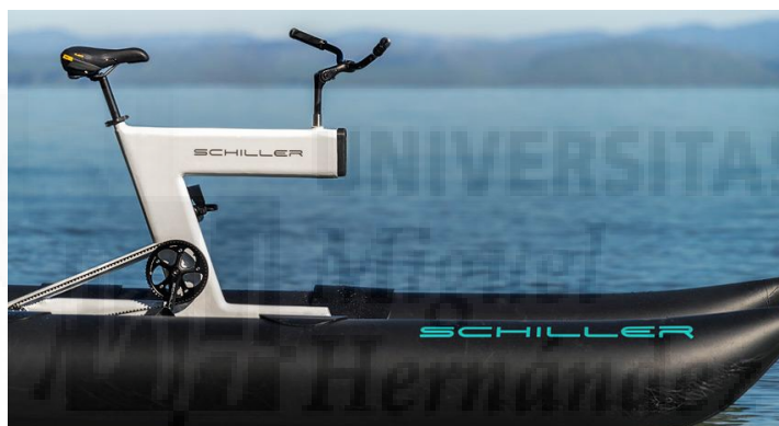
3 Modelo Schiller último con cuadro X1

Schiller, J. (16 de Febreo de 2017). Unike . de http://www.uniquemeetings.com/2017/02/16/waterbiking-exclusividad/