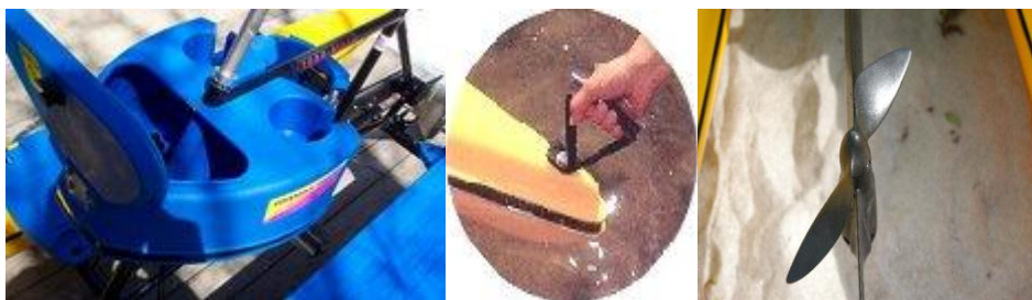
Hydrobike. (s.f de s.f de s.f). de http://hydrobikes.com/water-bike/hydrobike/hydro-bike-products