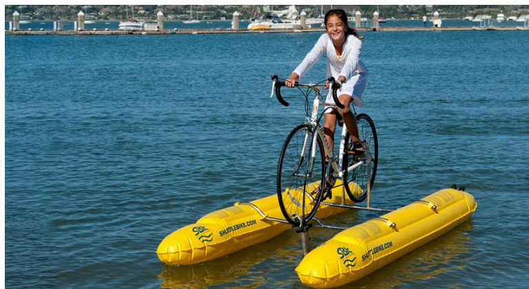
1 Modelo de Schiller

Hay tres tipos de bicicletas, la primera foto es la primera bicicleta que montaron y la tercera es la que actualmente utilizan. Han ido cambiando y modificando el material. En la segunda foto o segundo diseño las mejoras que realiza Schiller, es sobre todo a material inoxidable y un material más ligero para tener mejor flotación. Ya en el diseño más nuevo y hasta el momento el último creado por Schiller, recibe el nombre de Schiller Sport X1.