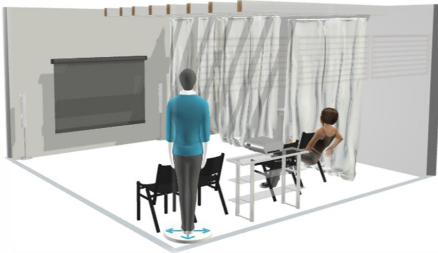
Fig. 11. Representación virtual de la instalación.