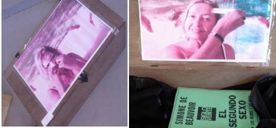
Fig. 7: Conocimiento. Instalación.

Baúl cerrado que oculta en su interior una flor y un libro de Simone de Beauvoir: El segundo sexo .