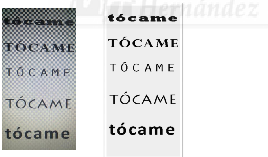
Fig. 12. Fotolitos para los telones pares.

Nos hemos planteado desarrollar el proyecto de manera sutil, con una representación formal estético-plástica. Nos interesa sobre todo el mensaje, y la Instalación Audiovisual nos parece determinante porque es un medio que llega a mucha más gente y permite su difusión tanto en salas, museos y galerías de arte como en espacios no convencionales.