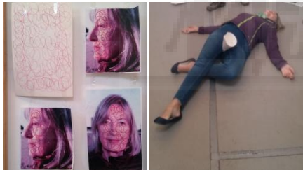
Fig. 8. Performance.

Una acción de tres minutos en la que la performer rellena con un rotulador rojo una hoja de papel y después prosigue esa acción en su cara. La idea es que el rostro ayuda a unas personas para la conexión sexual pero a otras no. Después la performer se irá acercando a cada uno de los espectadores para mirarles fijamente. Terminara en el suelo haciendo un cono con la hoja de papel y colocándolo en su sexo. Las mujeres debemos seguir profundizando en nuestra propia identidad. El mundo del arte se ha basado en la figura femenina pero lo ha hecho sin ella.