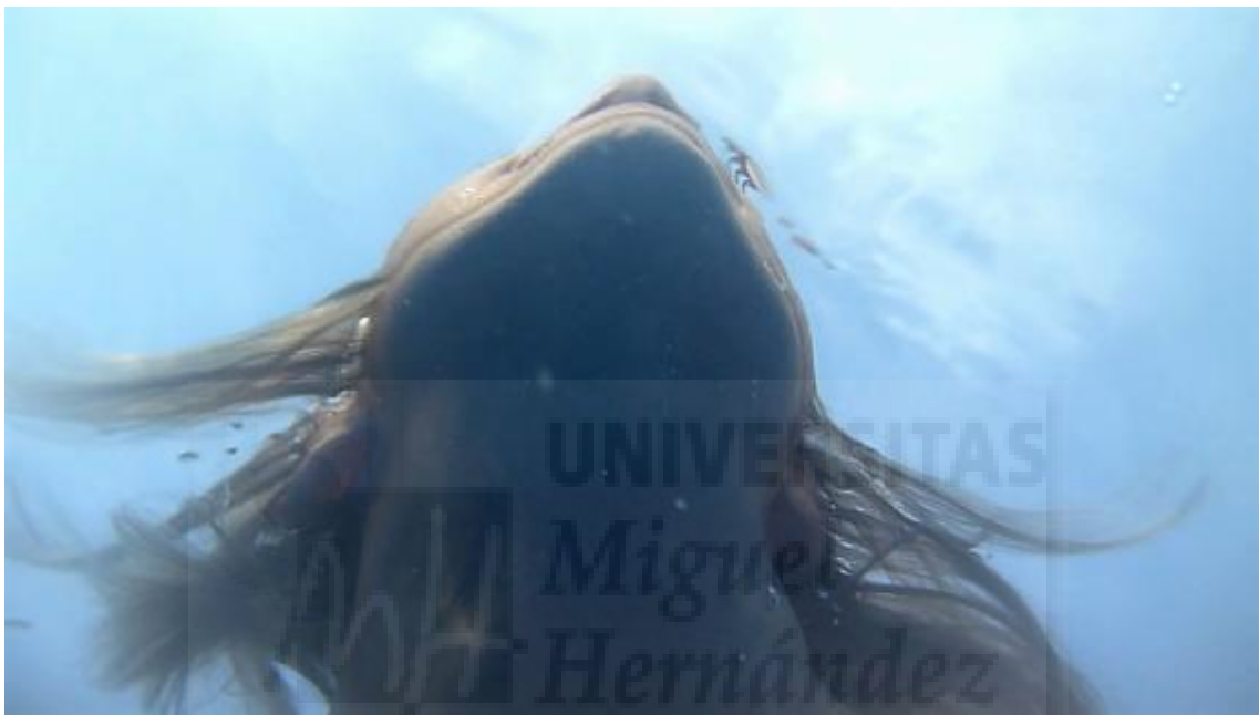
Fig. 15. A ciegas . Audiovisual. HD- 1920x1080. Fotograma 00.03'69''10'''

Queremos que el observador se conecte de una manera natural y que sea cual sea su interpretación dicho video logre impactar y despertar un sentimiento de emoción que invite a pensar e indagar qué es lo que quiere transmitir.