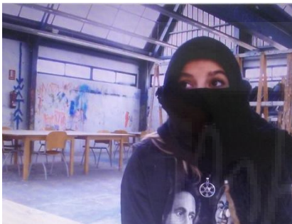
Fig. 5: Sexualidad femenina . 23/4/2016. Audiovisual. Video Documental. HD- 1920x1080. Duración 5'00".

A continuación entrevistamos a una veintena de jóvenes, menores de veinticinco años, mujeres y hombres, heterosexuales y homosexuales, que contaron su experiencia. Hablaron de que la mayoría de las mujeres no alcanzaban el clímax en el coito, y que esto no lo hablaban con nadie, algunas ni siquiera con su pareja. Obviamente en estas entrevistas la mujer transmite la expresión de su intimidad, y el hombre transmite la expresión de su opinión. El resultado de esta investigación fue la edición del video-documental “ Sexualidad femenina ”. 5