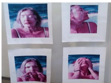
Fig. 6: La vida en el rostro. Video 3 '00''

El video graba la escena en primer plano de un rostro cubierto de nombres escritos en tiras adhesivas que significan las huellas de los amores mostrados (novios, maridos), y ocultos (los amantes). Cada tira desprendida genera una emoción, un recuerdo. La secuencia transcurre mientras se van desprendiendo uno a uno cada uno de los nombres.