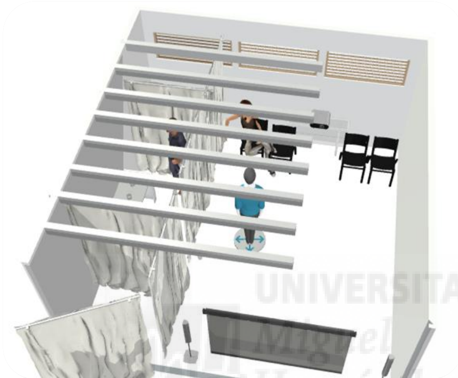
Fig. 10. Representación virtual de la instalación.

Entraremos en la sala blanca entre los telones de plástico serigrafiado. A un lado de la sala, en una peana de 80 x 80 x 120 cm estará colocado el juego. Para llegar a él se tienen que ir apartando los telones. En la misma sala estará colocada la pantalla donde se proyecta el video.