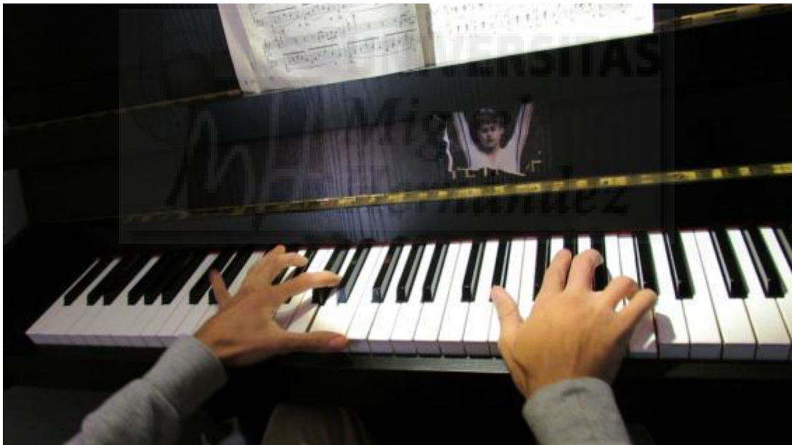
Fig. 14: A ciegas . Audiovisual. HD- 1920x1080. Fotograma 00.00'51''19'''

En nuestro video aparece un hombre tocando el piano mientras la cámara se acerca a sus manos. Toca la Balada n°1, opus 23 de F. Chopin. Desde las expertas manos la cámara se dirige hacia la partitura; no hay obra sin partitura; no hay obra perfecta sin conocimiento. En un zoom rápido la partitura se diluye y aparece una toma de travelling en paralelo de un campo de piedras blancas. La música se distorsiona, el conocimiento exige esfuerzo. Aparecen imágenes intercalándose y difuminándose del agua, un cuerpo de mujer, y las manos del pianista. La piel como símbolo del elemento sensual del placer y el agua, que es flujo.