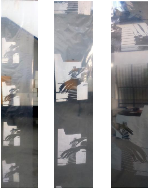
Fig. 13. Telones impares.