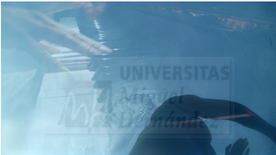
Fig. 9. A ciegas , Video. HD- 1920x1080. Fotograma 2'37''11''' Duración 3'51''.

Para el juego y los telones se utilizan bolsas de capsulas de café recicladas y rollo de plástico transparente de 50 metros respectivamente.