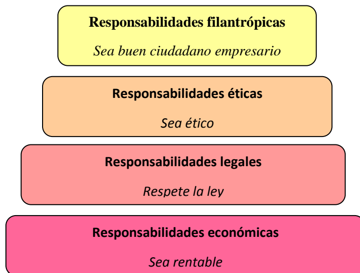
Pirámide de RSE, Archie Carroll (1991)

Lograr un compromiso con la Responsabilidad Social supone considerar a todos los grupos de interés.