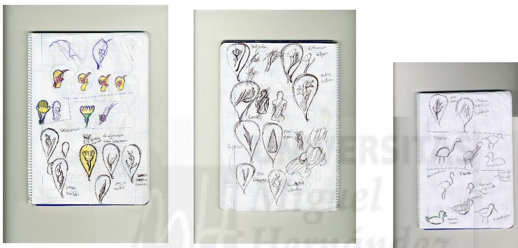
Fig.2: Bocetos del proceso.