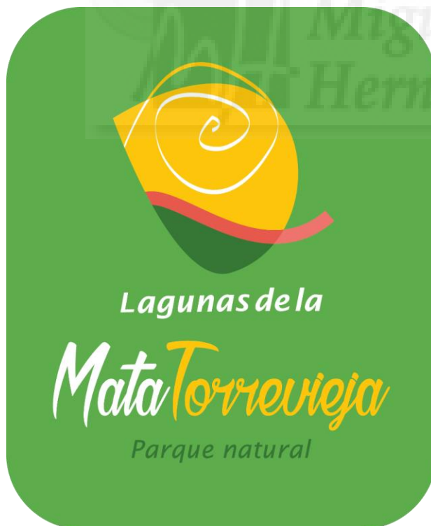
Fig.2: Marca turística.