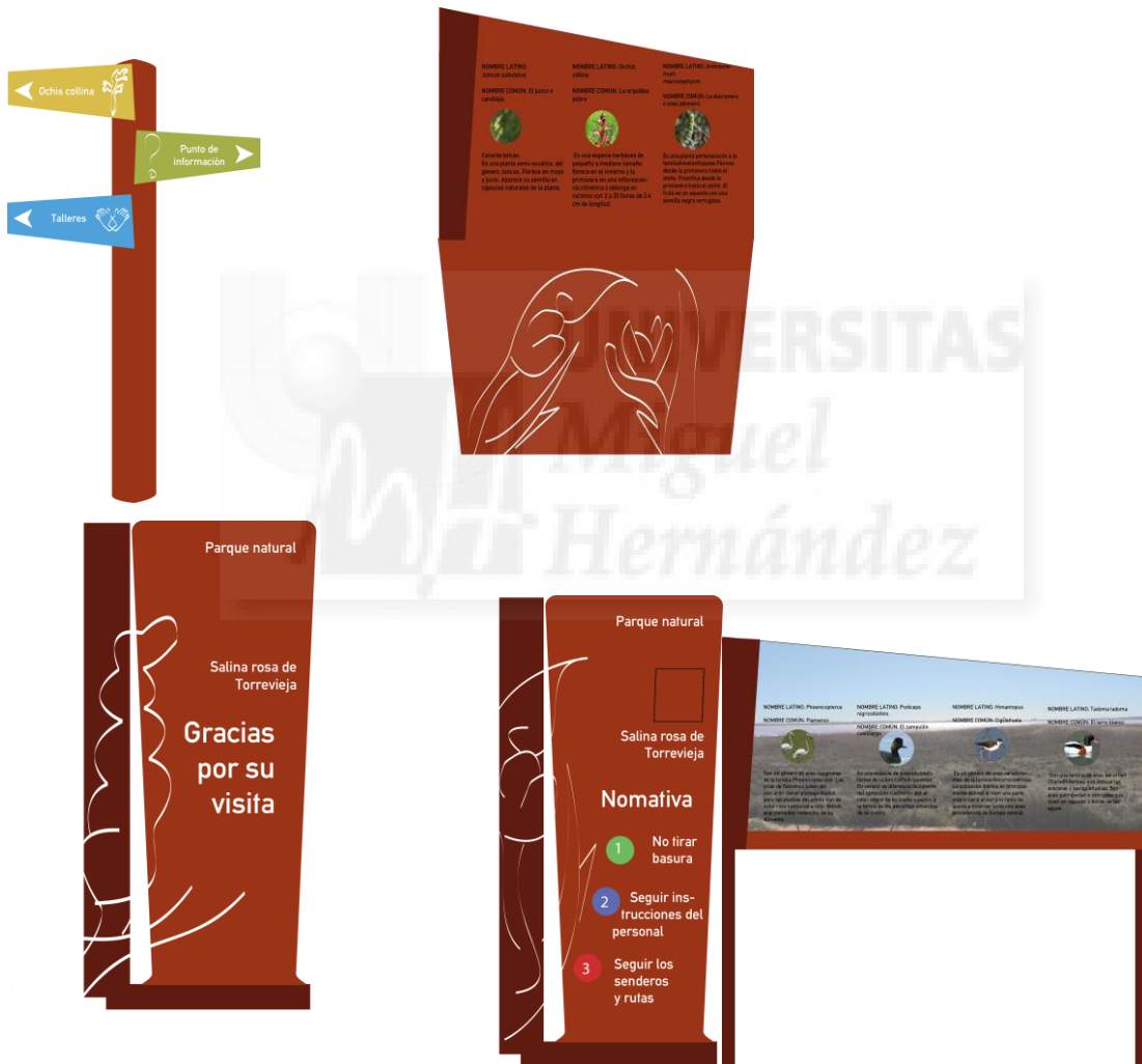
Fig. 4: Diseño de señalética.