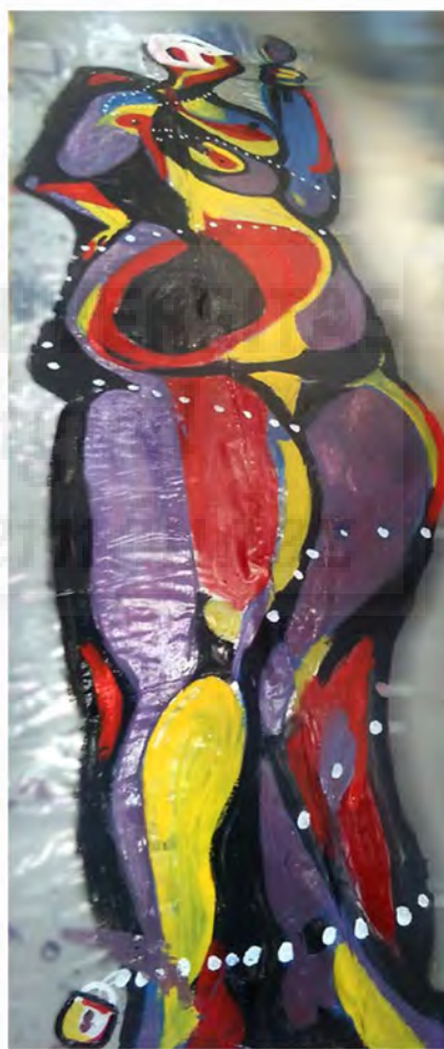
Fig.7. Seven It, (2016 ) Acrílico sobre polietileno medidas, 450 cm x 150 cms

Claves de Representación: color violeta, hinchado. Símbolo el espejo.