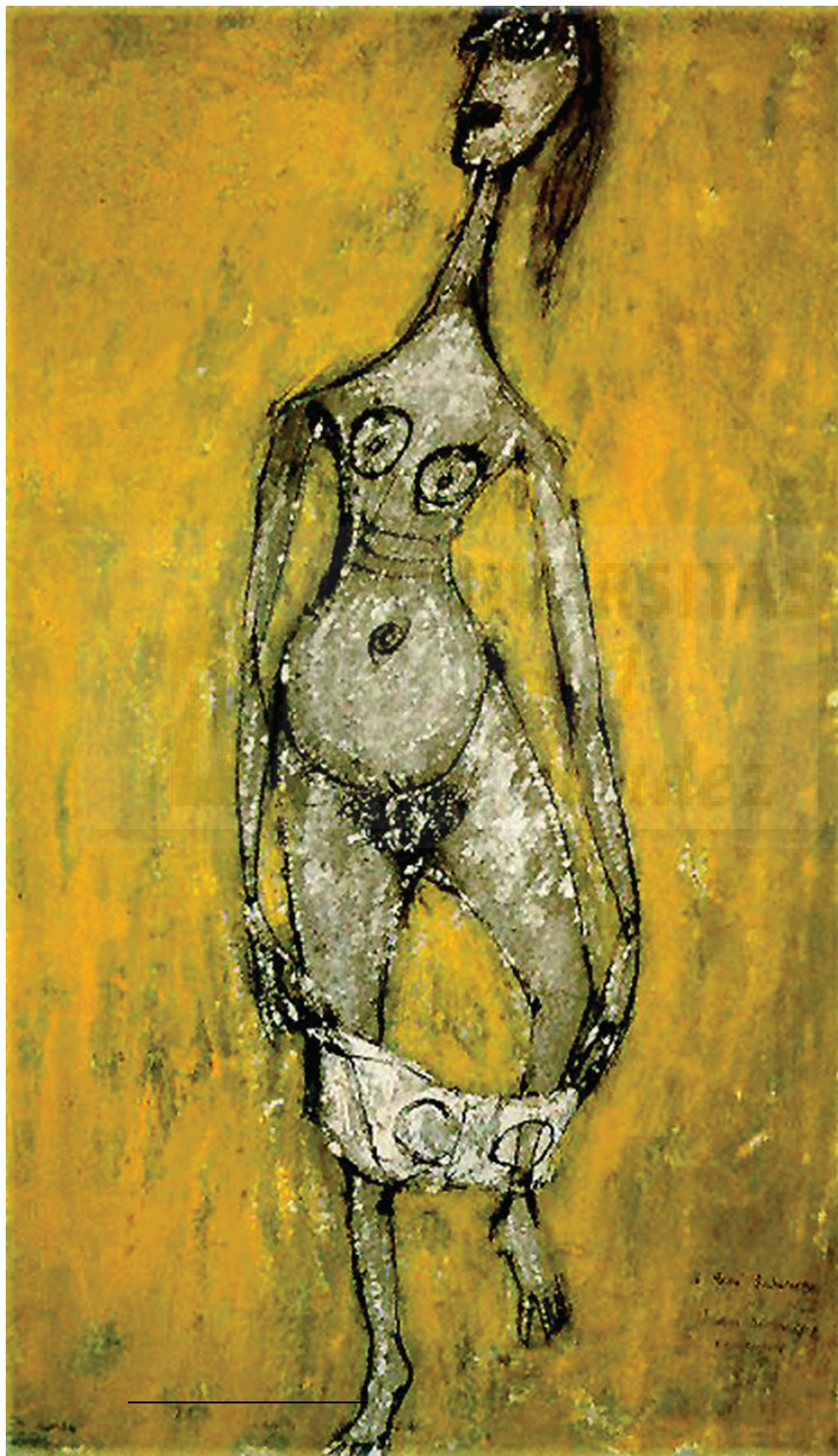
Fig. 3. Jean Dubuffet, Femme galante otant saculotte ,(1944), guache y tinta china, 50 x 33 cm.

En este trabajo uno de los referentes es Jean Dubuffet y la manera como opone los elementos figurativos de forma radical a los parámetros habituales y aplica el primitivismo en el arte, con la espontaneidad del trazo y el tratamiento expresionista del uso del color.