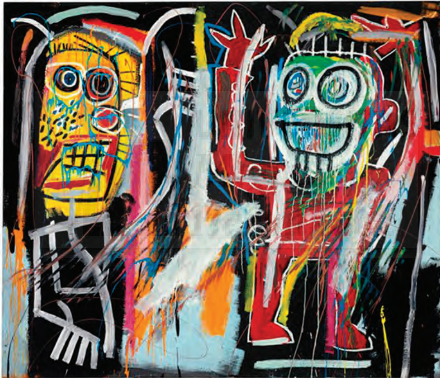
Fig. 4 . Jean-Michel Basquiat - Dustheads , (1982), Acrílico, barra de óleo, spray cerámico, pintura metalizada sobre lienzo.

Sus obras están pobladas de palabras-conceptos, imágenes vudú, totémicas y arcaizantes, retratos-homenajes a héroes negros -músicos de jazz, escritores, boxeadores- y referencias a la sociedad de consumo norteamericana.