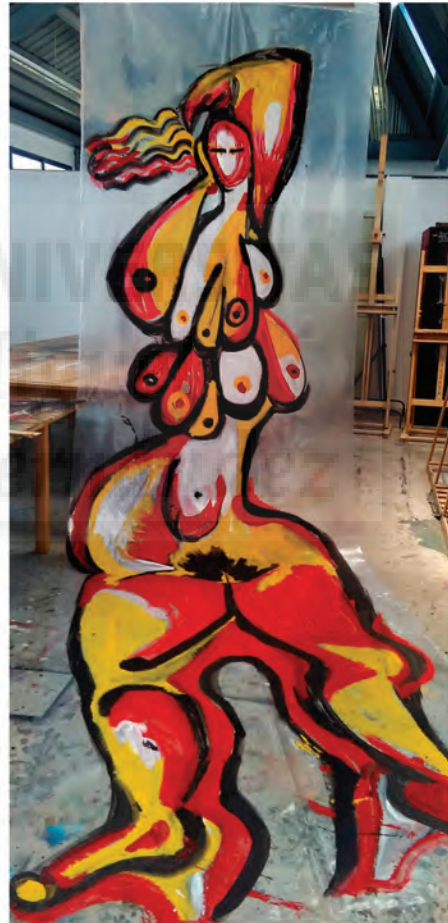
Fig. 8. Seven It (2016) Acrílico sobre polietileno, medidas 450 cm x 150 cm.

Claves de Representación: Muchos pechos grandes, color amarillo, rojo, fuego. Símbolo sexo con vello púbico.