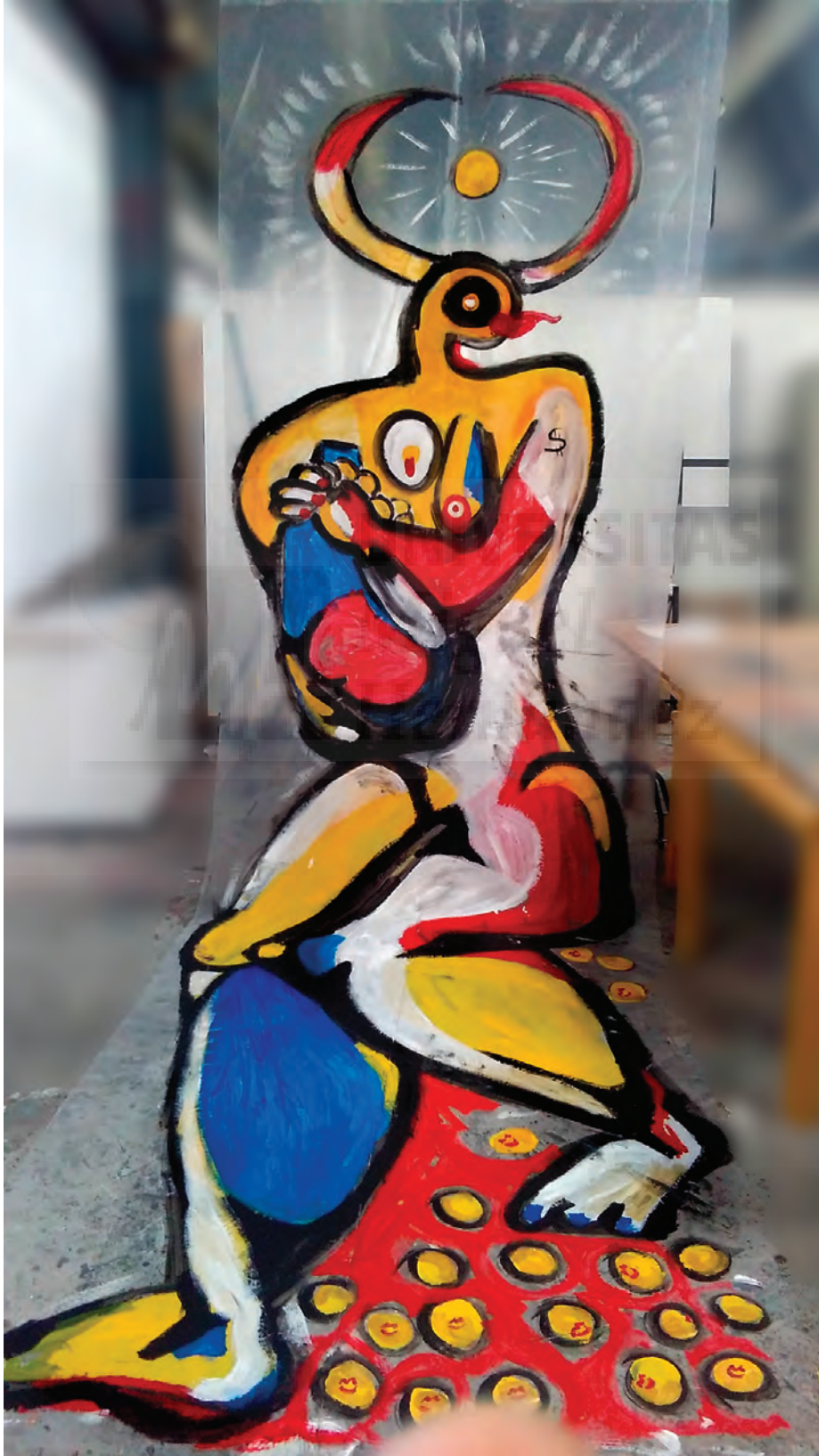
Fig. 9. Seven It. La Avaricia , (2016) Acrílico sobre polietileno 450 x 150 cm.

Claves de Representación: Dinero, tentáculos, saca de piedras, color dorado. Símbolo la serpiente tatuada