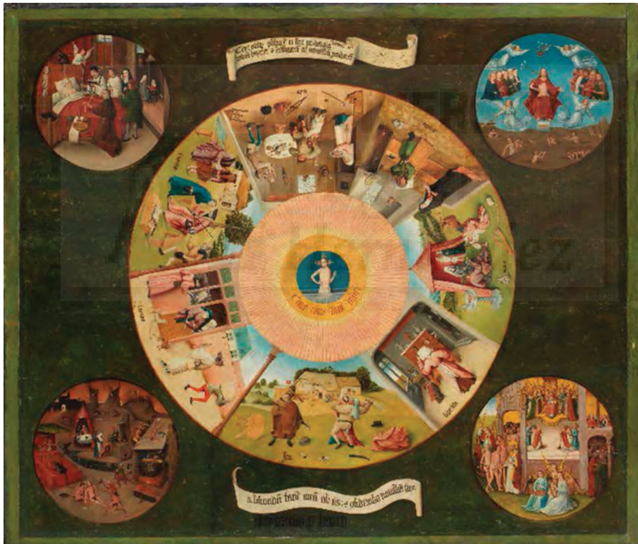
Fig. 1. El Bosco Mesa de los Pecados Capitales , (1505 – 1510) Técnica Óleo Tabla de madera de chopo, 119,5 x 139,5 cm.

La pieza Seven It , se configura en una expresión más abstracta, en un enfoque que se desvía de las connotaciones religiosas, pero que intenta, también, incluir una crítica social y de género con un lenguaje formal más cercano al Street Art o Graffiti .