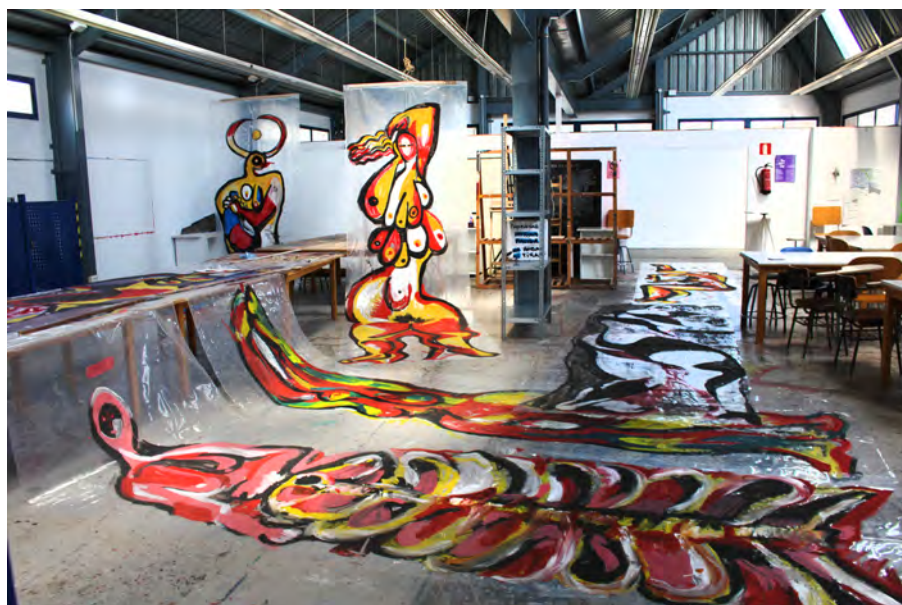
Fig. 10. Seven It (2016) Acrílico sobre polietileno medidas variables (450 x 150 cm. aprox.)