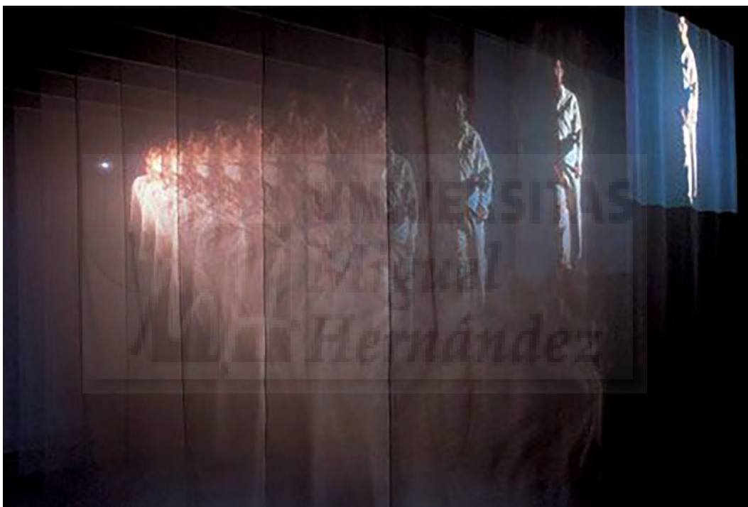
Fig. 5 . Bill Viola. The Veiling (detail), (1995). Video instalación de dos canales en color con proyecciones sobre nueve pantallas en suspensión y dos canales amplificadas en mono y cuatro altavoces, (350.52 x 670.56 x 944.88 cm.) (dimensiones optimas)

En nuestra pieza recurrimos al plástico transparente, atraídas por la estética de lo común que se convierte en extraordinario, también por el juego de lo extraño o de lo imperfecto.