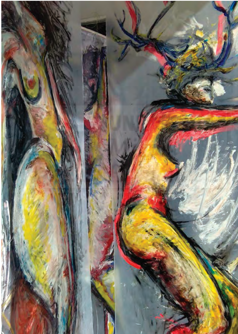
Fig. 2. el bosque de las malas (2015) Instalación pictórica/audio (9) Acrílico sobre polietileno transparente. Medidas Variables (220 x 600 x 600 cm .aprox.) Espacio Expositivo LAC -UMH, Bellas Artes, Altea.

Y contiene un recorrido por un bosque ficticio con el protagonismo de las malas y sus voces, como ecos penetrantes provocadores de sensaciones de agobio.