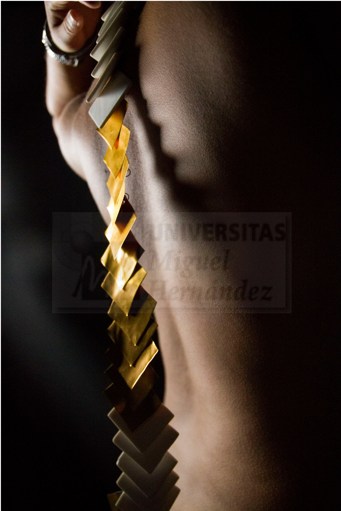
(Fig. 13.) Virginia Fuente Rodríguez: “Colonna portante I” (2016). Papel fotográfico 150 x 110 cm.