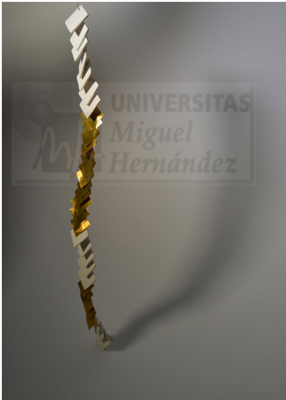
(Fig. 12.) Virginia Fuente Rodríguez: “ Colonna portante ” (2016). Porcelana y latón, 66 x 2cm.

La obra Colonna Portante muestra la parte perteneciente a la columna vertebral. Esta se ha reproducido en su totalidad por medio de una pieza artística efectuada en porcelana y latón, la disposición y estructura recuerdan a la sección ósea escogida.