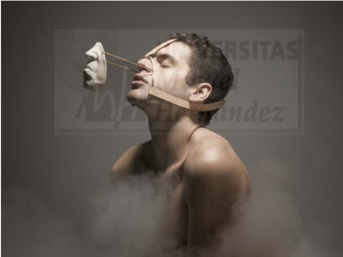
(Fig. 6.) Daniel Ramos Obregón: "Boca", de Outrospection; El cuerpo y la Mente , (2014). Moldes de yeso, extensiones de bronce y arnés de cuero curtido vegetal, medidas variables. (Fig. 5 y 6.)