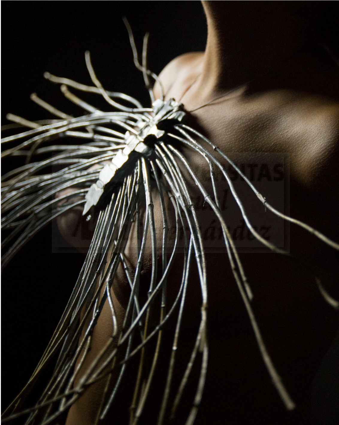
(Fig. 18.) Virginia Fuente Rodríguez: "Sterno III" (2016). Papel fotográfico 150 x 110 cm.