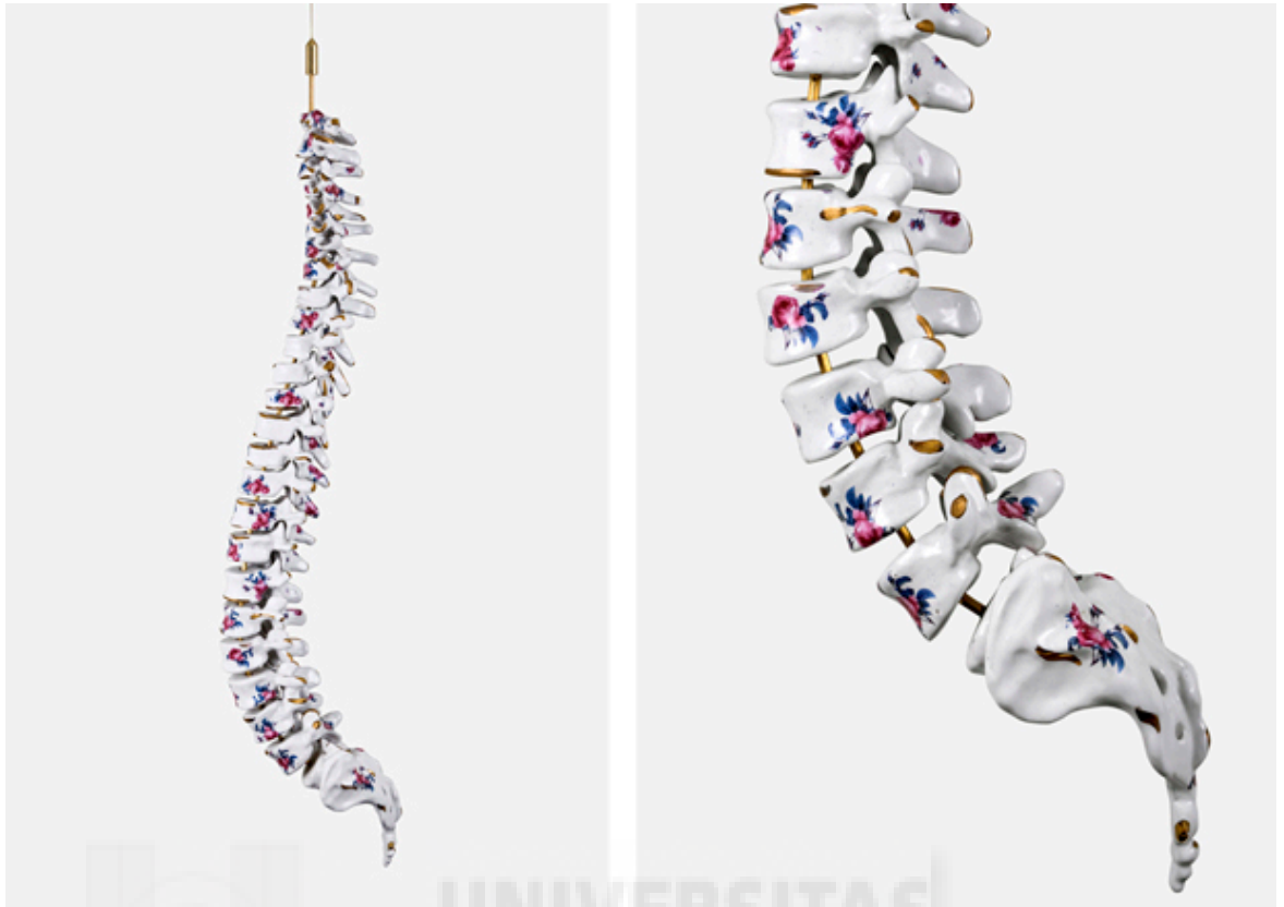
(Fig. 4.) María García-Ibáñez: Inmóviles de la serie H/P/F (Huesos/Piedras/Flores) (2011). Cerámica vidriada con oro y calcomanía, 80 cm x 15 cm.