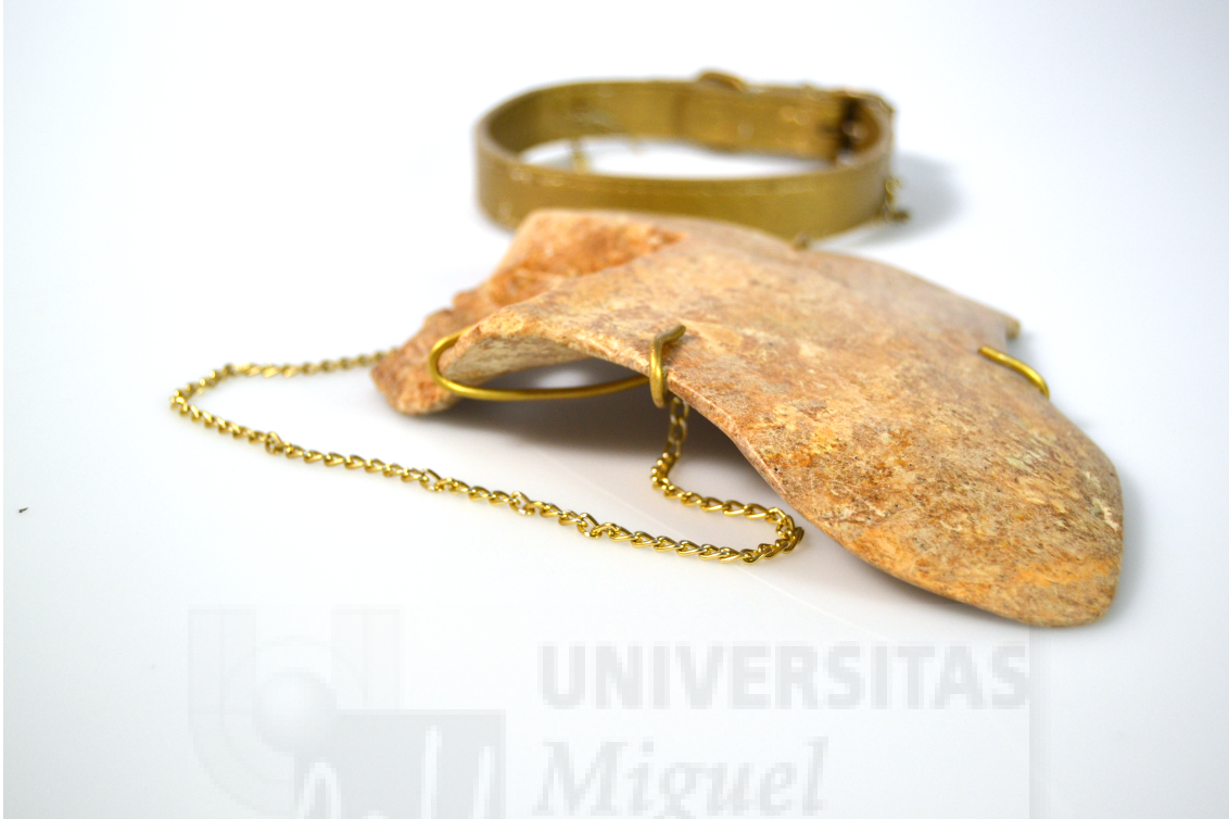
(Fig. 14.) Virginia Fuente Rodríguez: "Scapola" (2016). Piedra jabón y latón, medidas variables.

La pieza, Scapola , es la segunda obra que forma parte del proyecto Morphe y hace referencia nuevamente a una sección de la anatomía, el omóplato, realizado en esta ocasión en piedra jabón. Consiguiendo así el resultado deseado, obteniendo una obra escultórica con características propias de un elemento ponible y a su vez deseable, como complemento a la estructura convencional humana.