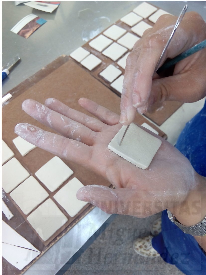
(Fig. 7.) Detalle porcelana.