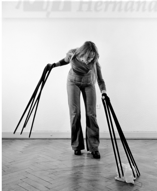
(Fig.1) Rebecca Horn: "Extensiones del brazo" (1972).

Por lo que respecta al trabajo de Rebecca Horn, se han recopilado algunos de sus pensamientos, ya que trata, principalmente, en sus obras el valor del cuerpo como un objeto mecánico. Además se ha escogido, a esta artista, debido a la singular manera de concebir el cuerpo, de igual modo que se trata en este proyecto. Es decir, para ella es un objeto que debería ser manipulado (Fig.1), haciendo una indagación de las formas y de su sensibilidad no explotada, a través de la escultura.