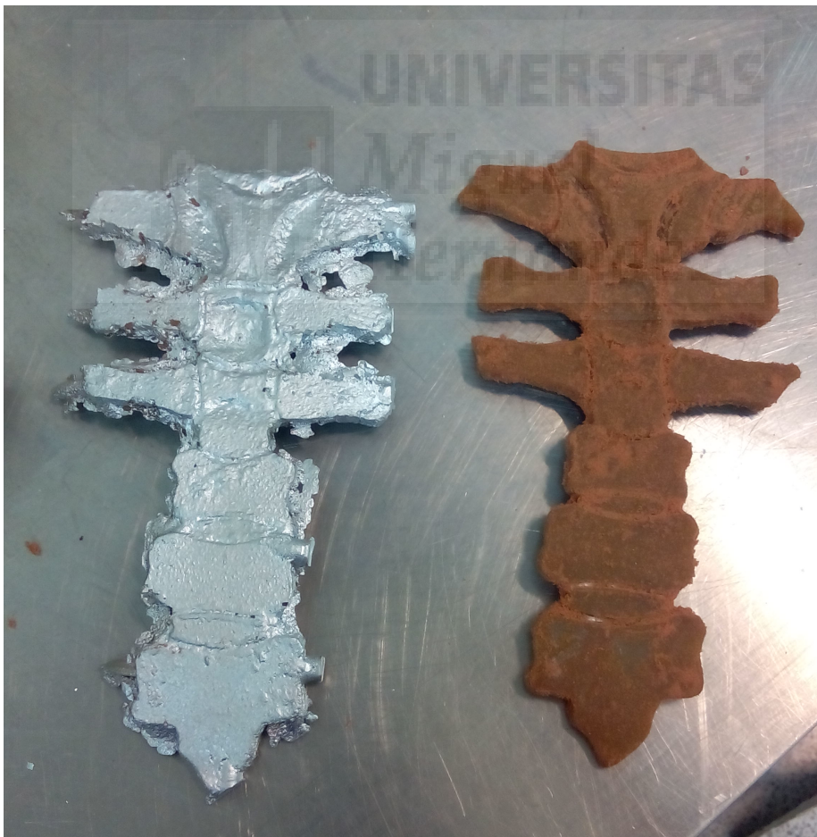
(Fig. 10.) Detalle pieza en cera y metal.

La segunda parte, se elaboró mediante una composición de ramas elegidas una a una y pegándolas entre ellas, posteriormente se hizo un degradado, con spray, de plateado a dorado. Ambas partes, se unieron para concluir la estructura torácica planteada como una extensión del individuo.