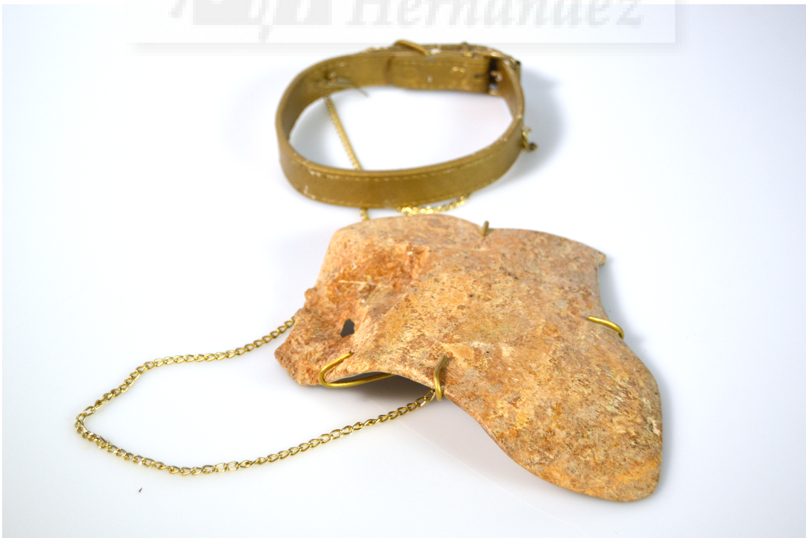
(Fig. 15.) Virginia Fuente Rodríguez: "Scapola" (2016). Piedra jabón y latón, medidas variables.