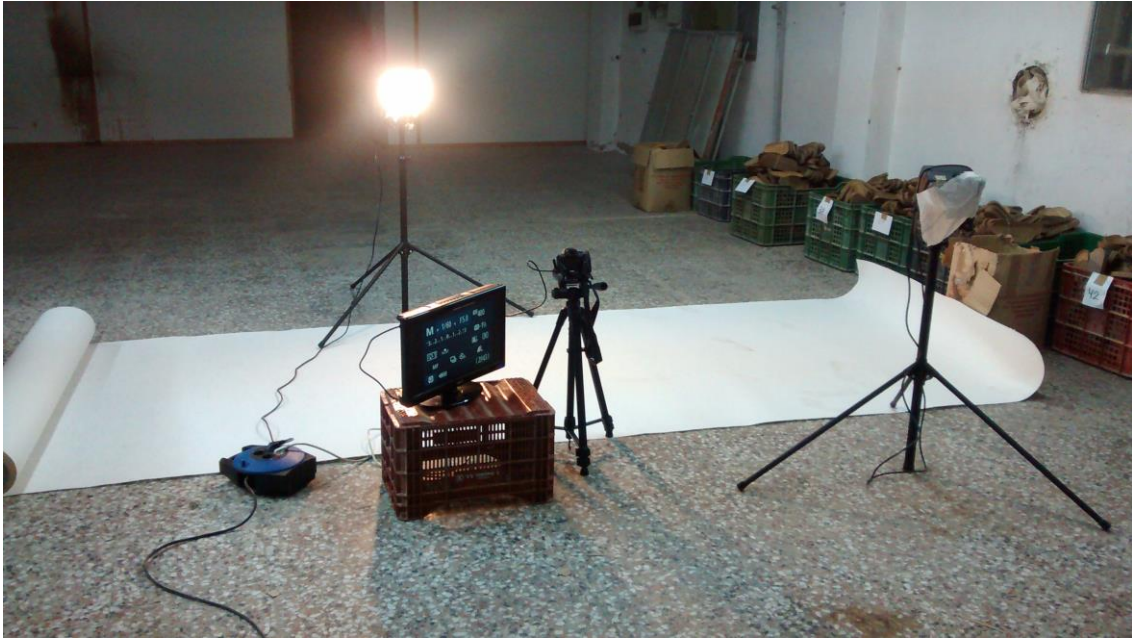
Fig. 7. Montaje para la escena de la moneda.