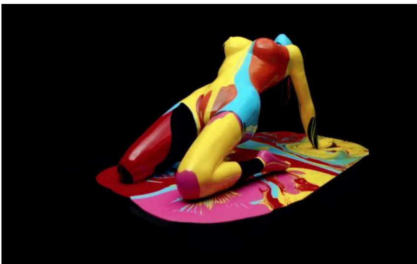
Fig.1. Fotograma, videoclip de Tame impala “The Less I Know The Better” 2015.

Esta forma de trabajar es muy característica de este dúo de directores que apuestan por dar, a partir de una historia sencilla, un punto de vista visual diferente y en ocasiones confuso con la intención de que el espectador reflexione. La ambigüedad de sus imágenes provoca que sea difícil comprender lo que se acaba de visualizar y el espectador se vea incitado a reproducirlo de nuevo.