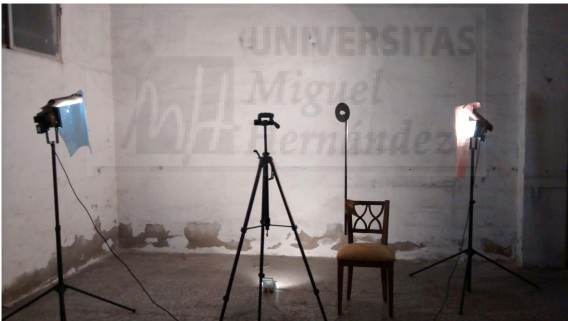
Fig. 8. Montaje para la escena del ojo con el cristal roto.