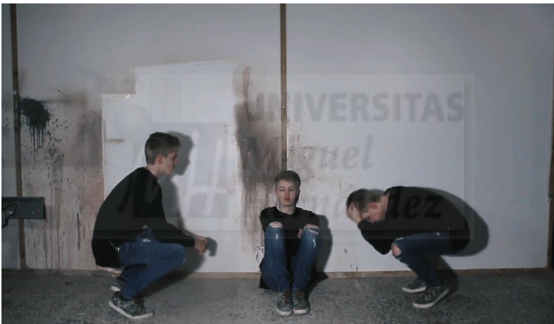
Fig. 11. Representación visual de la bipolaridad. Fotograma del videoclip.

Las noches de grabación fueron intensas pero muy divertidas y gratificantes.