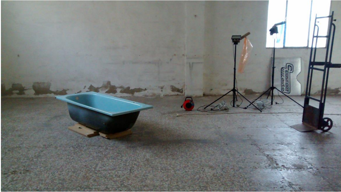
Fig. 9. Montaje para la escena de la bañera.

El tiempo total de rodaje se extendió durante un mes y dos semanas. En el mes principal se grabaron las escenas clave y en las siguientes dos semanas se repitieron escenas y se rodaron algunas tomas de recursos. La música se fue creando a lo largo del proceso de grabación, y la edición de escenas y el montaje final se realizó con Adobe Premiere. Esta parte se alargó hasta cuatro semanas más tras finalizar el rodaje, ya que también había que realizar una animación y añadir efectos con After Effects.