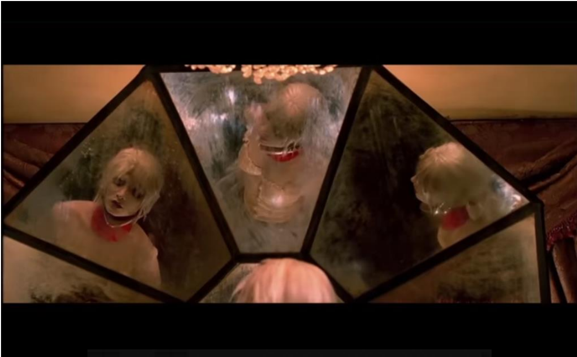
Fig. 3. Fotograma de la película “The Cell”, 2000.

En la película “The cell” una de las cosas estéticas más llamativas son los sueños que tiene la protagonista. Al ser visiones procedentes de la mente, éstas resultan irreales e inverosímiles, cuadrando en cierta manera con la visión deformada e infinita de significados que nuestro pensamiento es capaz de atribuir a cualquier símbolo o estímulo recibido. Nos interesa de este film, la representación visual de las maquinaciones imprevistas del cerebro.