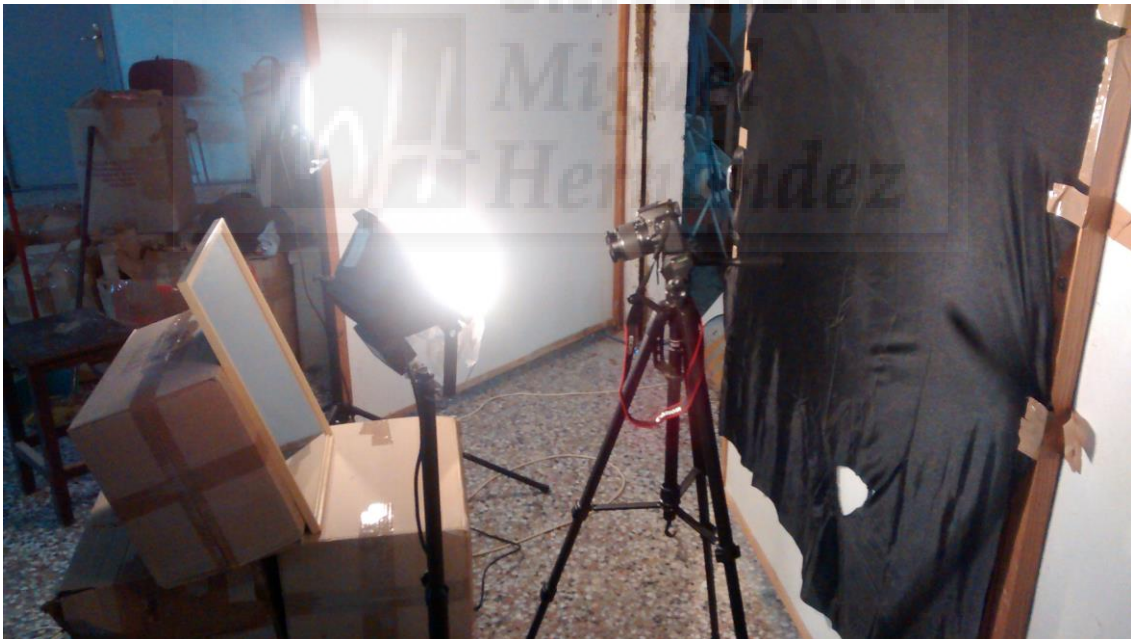
Fig. 6. Montaje para la escena de la pintura.

Después de grabar algunas pruebas elaboramos un Storyboard 5 sencillo para tener una idea general del montaje, de la edición final y sobre todo para definir la composición de luces y sombras de las tomas.