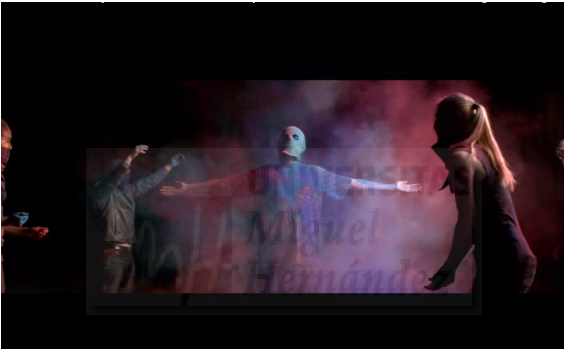
Fig. 4 Fotograma, videoclip de 30STM “Up In The Air” 2013.

El videoclip “Up in the air” es un video sin trama argumental; la música guía a un conjunto de personajes y situaciones ajenas las unas de las otras que generan angustia, rabia, libertad y euforia. Es artísticamente sublime, con unos colores radiantes, cámaras lentas y detalles muy bien cuidados. Este grupo musical siempre intenta realizar sus producciones audiovisuales experimentando metafóricamente a través del videoclip.