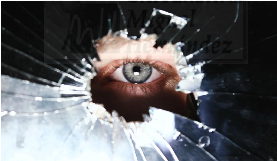
Fig. 12. Reflejos rotos. Fotograma del videoclip

LINK DEL VÍDEO EN YOUTUBE: https://www.youtube.com/watch?v=8xM6lft7DE