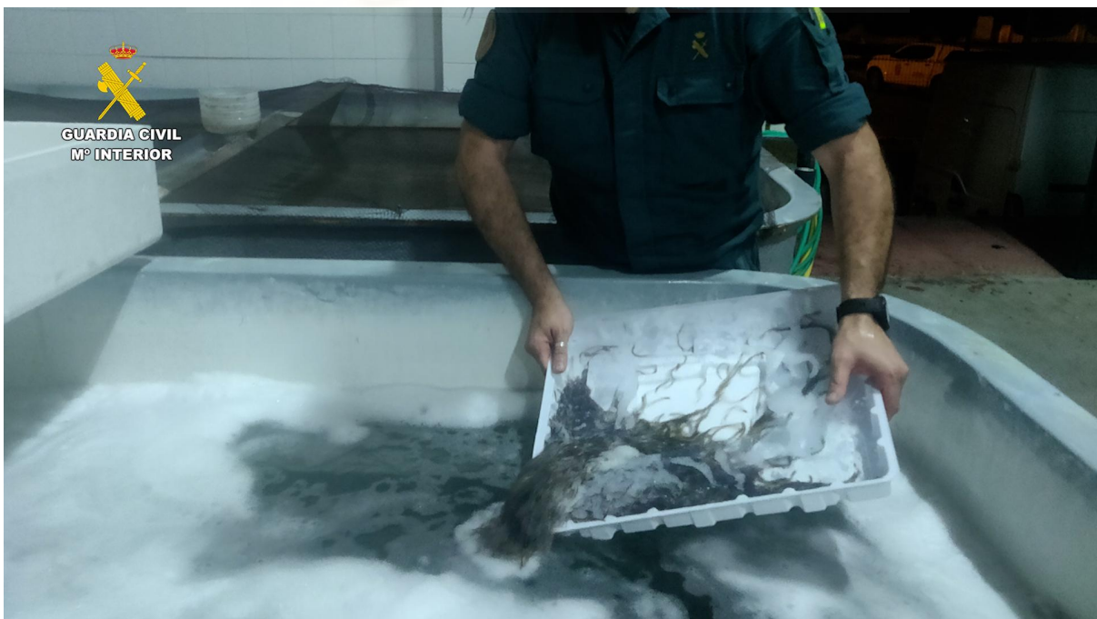
La Guardia Civil intervino 190 kilos de angulas en el Puerto de Algeciras a principios de 2023

WWF concluyó en su informe El negocio de la extinción que en nuestro país se trafica mucho con reptiles -fueron casi la mitad de especies incautadas entre 2006 y 2015-, tanto con su piel (60%) como con los animales vivos (40%). Las pieles suelen ser de caimanes, pitones y varanos, y la mayoría de reptiles vivos son tortugas mora, camaleones e iguanas, destinadas al mascotismo. Las plantas son el segundo grupo con más incautaciones, la mayoría son cactus y pseudopalmeras destinadas a la decoración. Le siguen los peces, con un pico muy alto de caballitos de mar en el año 2005 y grandes incautaciones de anguilas, destinadas principalmente a China cuando aún son angulas (crías) por el elevado precio que pagan.