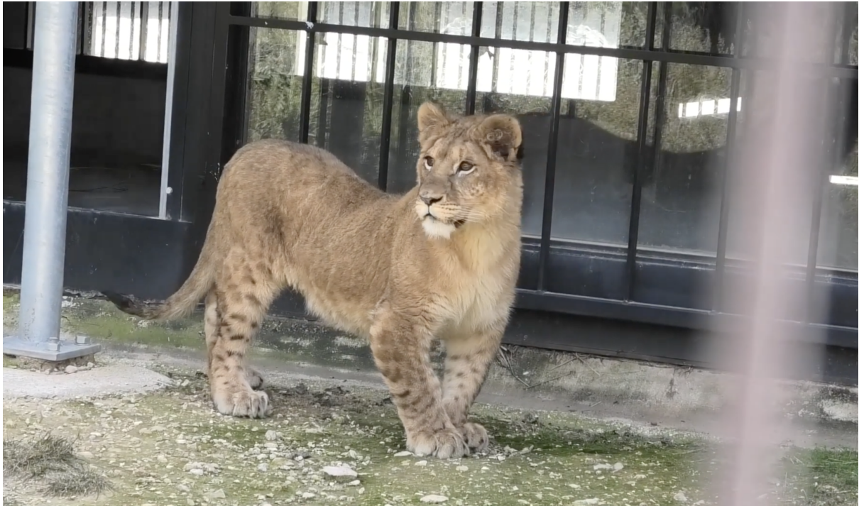
Flori, la leona con raquitismo, explorando las instalaciones exteriores por primera vez

“Problemas en la alimentación que derivan en problemas físicos, carencias sociales que originan problemas emocionales y psicológicos...”. Privar a un animal social de la socialización que necesita y separarle de su madre demasiado pronto también provoca trastornos. “En general, llegan de haber estado viviendo en sitios poco espaciosos y con muy pocos estímulos. La falta de estímulos en un mamífero va a hacer que, a nivel psicológico, tenga muchísimas carencias que pueden derivar en comportamientos repetitivos, estereotipados, que pueden incluso llegar a ser estereotipias graves, como autolesiones o automutilaciones: que se rasquen mucho o que se chupen mucho las colas hasta hacerse heridas...”.