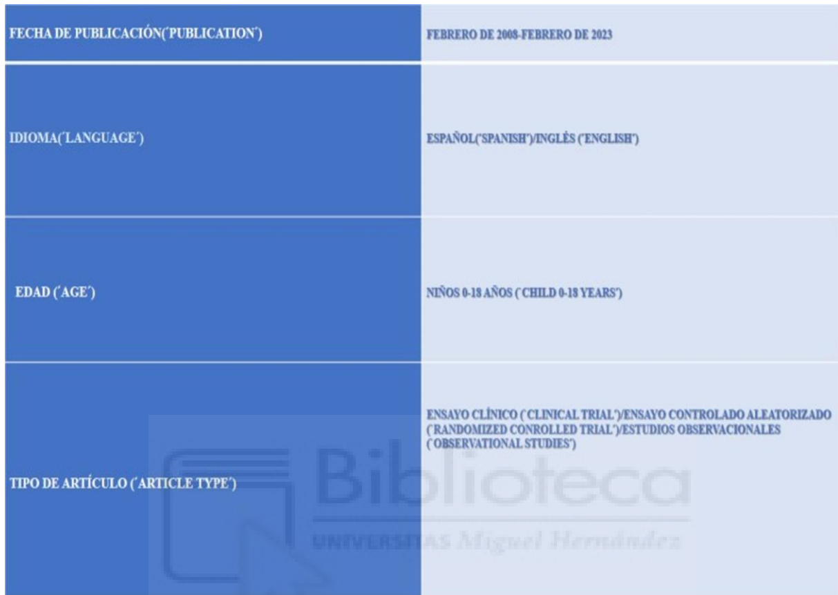
Tabla 1. Filtros aplicados.