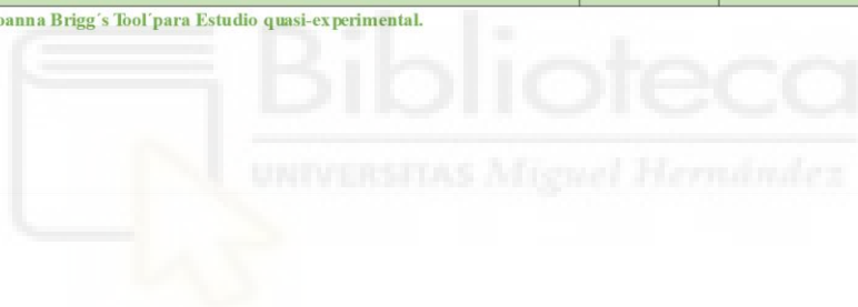
Tabla 8. Cuestionario 'Joanna Briggs Tool' para Estudio quasi-experimental.