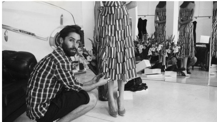
Figura 3: Juan Vidal.

- Juan Vidal , nacido en Elda, desde sus inicios en el mundo del diseño de moda ha sido reconocido por su creatividad, técnica y capacidad para diseñar colecciones de lo más innovadoras. Tiene un estilo marcado por la elegancia, la sencillez y la feminidad que ha recibido premios relevantes como el “Vogue Who’s On Next” o el Premio Nacional de Moda, ambos en 2015.