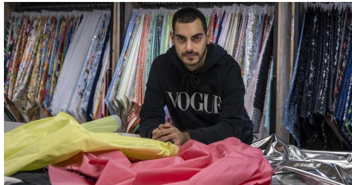
Figura 4. Domingo Rodríguez.

actuales con otras más antiguas y experimenta con materiales como el látex. Actualmente su estética es inspiración para la vestimenta de cantantes internacionales como Rosalía, Lola Índigo o Tini Stoessel, entre otras muchas más. Fue galardonado con el “Vogue Who’s on Next” en 2021 y en 2020 recibió el Premio Nacional de Moda en la categoría de Joven Talento.