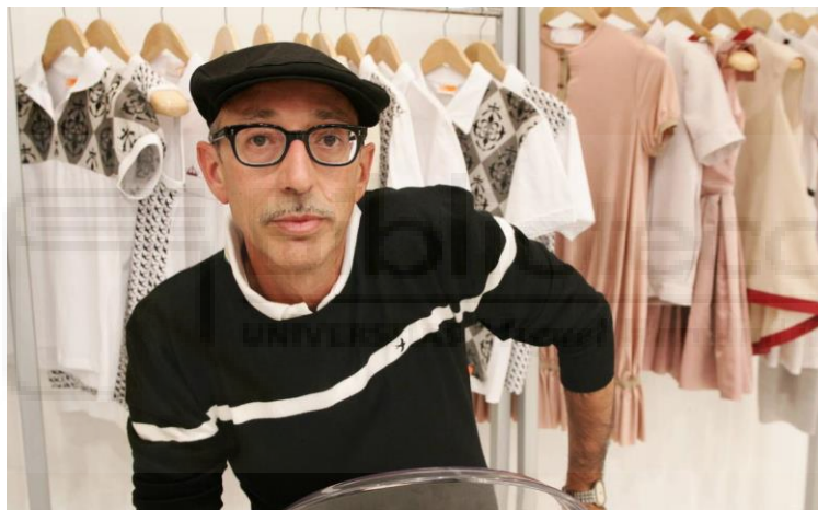
Figura 1. Antonio Alvarado.

- Antonio Alvarado es parte de la generación de diseñadores que cambió la imagen de la moda española en los años 80 tras la época de la transición. Nació en Pinoso y desde pequeño fantaseaba con la vestimenta de la gente. Acabó trabajando junto a Pedro Almodóvar para las vestimentas de sus largometrajes. Sus propuestas llegaron a la cima de las pasarelas internacionales y a medios prestigiosos como i-D o The Face. Fue una figura clave en la antigua Pasarela Cibeles, ahora denominada como Mercedes Benz Fashion Week de Madrid, y aunque cerró su firma en 2012, el pasado 2021 recibió el Premio Nacional de Diseño de Moda. El jurado le concedió este título por “haber abierto, a lo largo de su trayectoria, el camino a generaciones de diseñadores al abordar temáticas sociales que han cobrado una nueva dimensión en la actualidad, tales como la identidad o la sostenibilidad”. 1