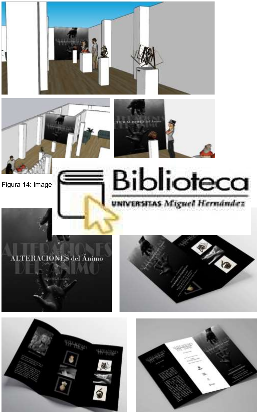
Figura 14: Image

Por último, muestro el resultado final trabajado sobre un posible modelo de instalación o montaje expositivo para la obra Alteraciones del ánimo , junto con el material gráfico que se incluiría.