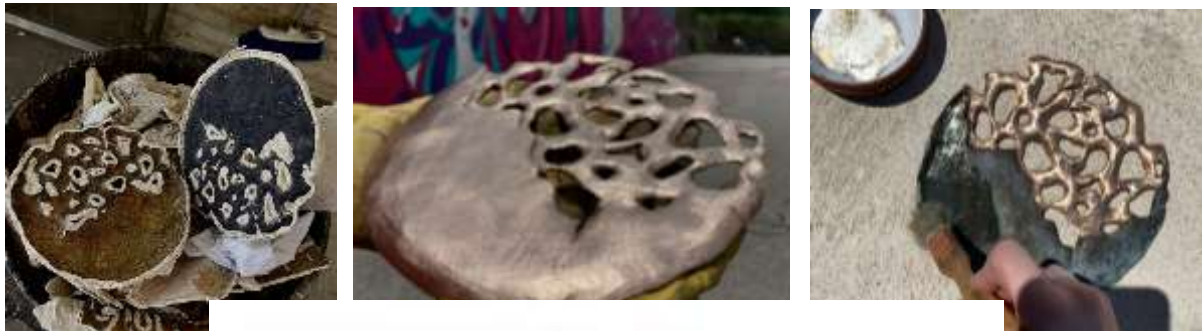
Figura 12: Imáge pieza en bronce,