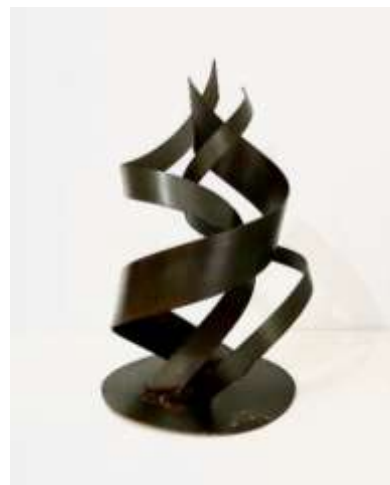
Figura 8: Alteraciones del ánimo II: Pensamiento (2022) y Fluidez (2022).