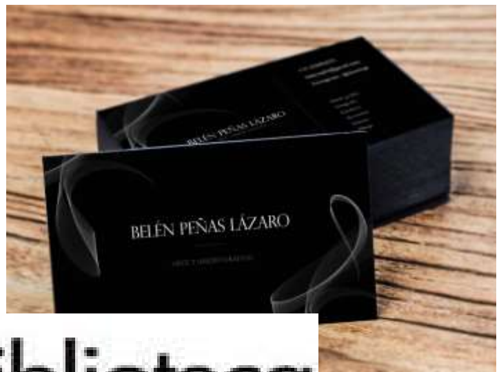
Figura 16: Imáge