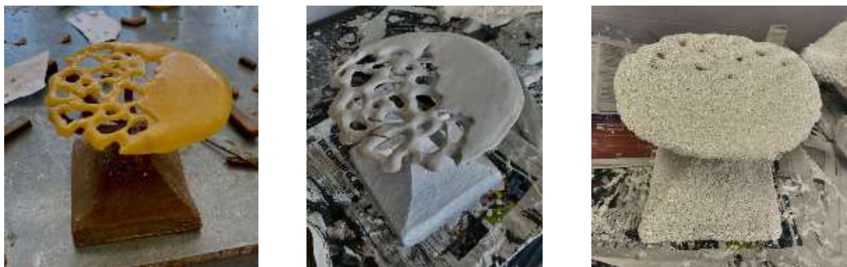
Figura 10: Imágenes del inicio del proceso práctico, pieza preparada en cera sobre árbol de colada, primeros baños y resultado final con el último grano grueso.