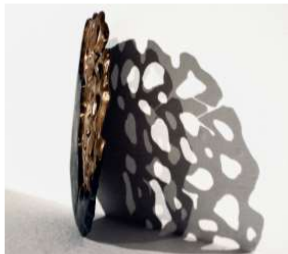
Figura 13: Alteraciones del ánimo III .

Belén Peñas Lázaro, El reflejo del alma (2023), fundición de bronce mediante colada con crisol, 20 x 20 x 0,5 cm.