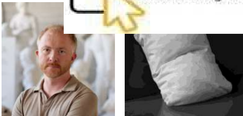
Figura 3: Imagen de Hakon Anton Fageras y su obra Down Marble (2018).

Hakon Anton Fageras (1975) es un escultor noruego contemporáneo. Destaca por su capacidad para transformar bolos de alabastro en aparentes almohadas, de manera que consigue engañar a nuestra percepción haciendo ver un material duro como uno súper esponjoso y ligero.