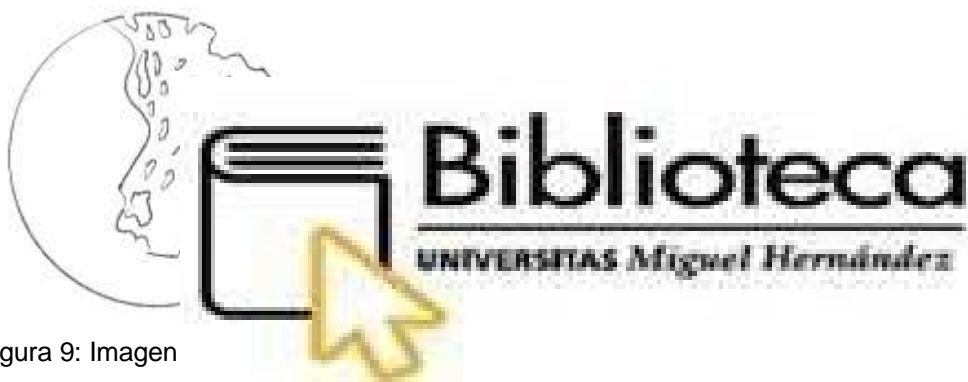
Figura 9: Imagen

Continuando con este proceso en el que el concepto de superación e introspección ha sido el protagonista de mi vida, este año siento que he vuelto a nacer y he llegado a la conclusión de que nuestro interior que es lo que realmente importa y donde verdaderamente residen nuestros sentimientos, emociones y vivencias, no siempre es lo que se refleja. De este modo decido comenzar a trabajar los conceptos mencionados anteriormente (interior, exterior), indagando más en el tema llego a la psicología y psique las cuales según la RAE significan alma y parte de la filosofía que trata del alma y sus facultades, de esta forma todo cobra sentido y surge El reflejo del alma , la pieza que pone fin a esta etapa y que tiene la capacidad de juntar la psicología con la creación artística.