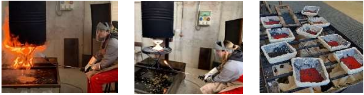
Figura 11: Imágenes del proceso de descere y resultado del proceso de fundición de bronce mediante colada con crisol.