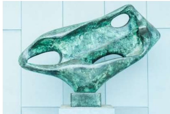
Figura 4: Imagen de Barbara Hepworth y su obra Sea Form (Porthmeor) , 1958.

Barbara Hepworth (1903-1975) fue una escultora británica del siglo XX. Conocida por sus obras abstractas, caracterizadas por formas orgánicas y geométricas. Fue una de las primeras artistas de Gran Bretaña en introducir el “agujero” en sus obras. La mayor parte de su trabajo está realizado con materiales como la madera, la piedra y el bronce, este último destaca en sus obras más conocidas, caracterizadas por sus formas curvas y la presencia de perforaciones.